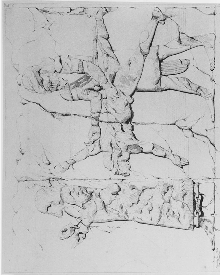
Çizim 1: Hamath kralı Yau-bi'di'nin Canlı Canlı Derisini Yüzülmesi (Albenda, 1986: pl. 78)