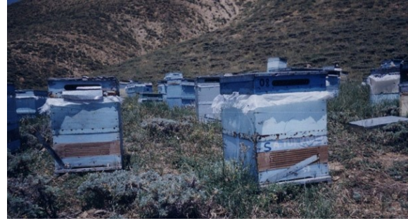
Şekil 2. Ön yüzüne Bell Board tipi ahşap propolis tuzağı takılmış koloniler