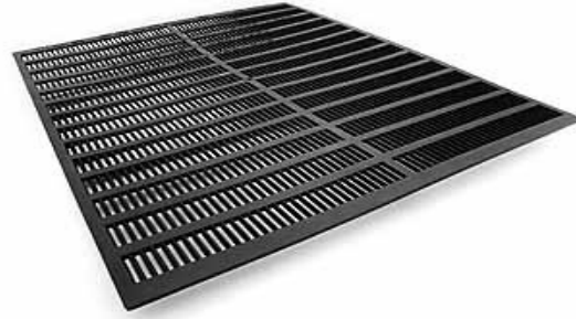
Şekil 1. Plastik ızgaralı örtü tahtası biçimindeki propolis tuzağı

yüzüne monte edilen Bell Board tipi ahşap tuzaklar kullanılmıştır. Propolis üretiminde gerekli olan plastik tuzaklar yurt dışından (J&D Manufacturing, Romeo şirketi) sağlanmıştır. Bell Board yöntemi için ise Langstroth tipi ahşap kovanlar özel olarak hazırlanmıştır. Bu amaçla bir grubun kovanın sadece ön yüzünde, diğer bir grup kovanın ise sadece yan yüzünde 7.5 cm genişliğinde boyasız gürgen tahta parçası kullanılmıştır. Bu tahta parçasına 0.46 cm genişliğinde 8 yarık açılmış ve arıların bu yarıkları propolisle kapatmaları sağlanmıştır (Iannuzzi 1993). Kullanılan propolis tuzakları Şekil 1, Şekil 2, Şekil 3 ve Şekil 4' te gösterilmiştir.