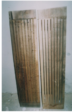
Şekil 4. Bell Board tipi ahşap propolis tuzağı