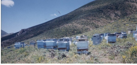
Şekil 3. Ön ve yan yüzüne Bell Board tipi ahşap propolis tuzağı takılmış koloniler