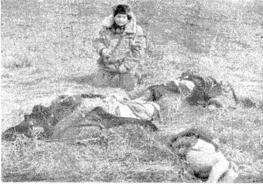
Fotoğraf 1:

Ayrıca savaşlar kadınları anne olarak da mağdur haline getirmektedir. Kadınlar sadece şiddeti, tecavüzü yaşayarak değil kendi bedenlerinin bir parçası olan çocuklarının ölümüne tanık olarak da mağdur olmaktadır. (Fotoğraf 10, 12)