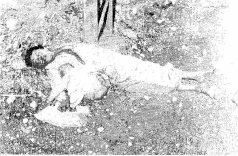
Fotoğraf 4: