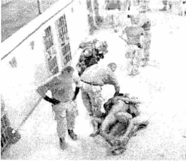
Fotoğraf 2: 27 şubat 2008