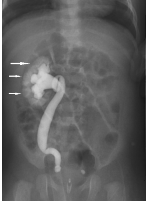
Resim 1. Sağ böbreğe IV. derece VUR ve aynı tarafa IRR (ok ile işaretli), sol böbreğe I. derece VUR (işeme sistografisi incelemesi).

idrar yolu enfeksiyonu geçirip geçirmediğinin yakın takibi yapılması gerektiği belirtildi. Hasta 2 yıl boyunca profilaksisiz izlendi ve iki kez idrar yolu (ilki üst üriner, ikincisi alt üriner sistem) enfeksiyonu geçirdi. İzleminin ikinci yılı sonunda hastanın işeme sistografisi, üriner ultrasonografisi ve DMSA'lı böbrek sintigrafisi tekrarlandı. İşeme sistografisinde sağda 3. derece VUR izlendi, ancak IRR düzelmişti (Resim 2). Solda ise toplayıcı sistemde VUR kaybolmuştu. Bu dönemde yapılan üriner sistem ultrasonografisinde; sağ böbrek 53x24 mm, sol böbrek 65,5x22 mm boyutlarında, parankim kalınlıkları her iki tarafta 9 mm olarak ölçüldü. DMSA'lı sintigrafi incelemesinde sağ böbrekte radyoaktif tutulumun %35, sol böbrek %65 oranında olduğu görüldü. Sağ böbrekteki tutulumun diffüz azalma şeklinde olduğu gözlemlendi (Resim 3). Hasta halen profilaksisiz ve idrar yolu enfeksiyonu açısından yakın takip ile izleme devam edilmektedir.