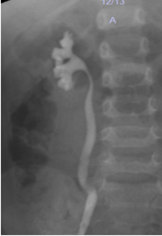
Resim 2. Sağ böbrekte IRR düzelmiş ve VUR derecesi azalmış, Sol böbreğe olan VUR düzelmiş (işeme sistografisi incelemesi).