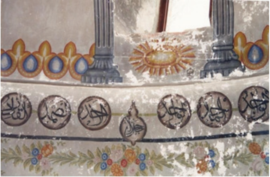
Foto.6: Mimari tasvirli süslemeler ve Esmâ-ül Hüsna yazılarından detay

Kubbe kasnağında toplamda 8 adet pencere yer alır. Bu pencerelerin çevresi mavi renkli iri akantus başlıklı sütunlar ile çevrenmiştir (Foto.5-6). Kasnakta yine yer yer silik olmakla birlikte lacivert ve kırmızı renklerde Allah'ın isimleri yer almaktadır. Alt sırada, hemen pencere bitiminde sıralı bir şekilde hardal renginde palmet motifleri vardır. Pencerelerin hemen altında da yine hardal renk ile uygulanmış güneşe benzer elips şeklinde madalyon motifi ile burada hareketlilik sağlanmıştır (Foto.6). Buranın hemen alt eteğinde kemerlerin üst hizasında madalyonlar içinde Esmâ-ül Hüsna yazıları bu kısmı dolaşır. Madalyonlar, kemer kilit taşının hemen hizasından siyah bir kontür çizgisi ile ayrılmıştır (Foto.6).