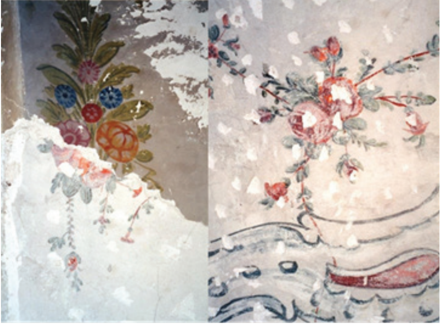
Foto.11: Pandantif kenarlarında yer alan bitkisel süslemeler Foto.12: Pandantiflerdeki gül demetleri

Camiye girişte kuzey yöndeki pandantifin alt sırasında müezzın atama kitabesi bulunmaktadır (Foto.13). Bu kitabenin Latin harflerle okunuşu şu şekildedir: