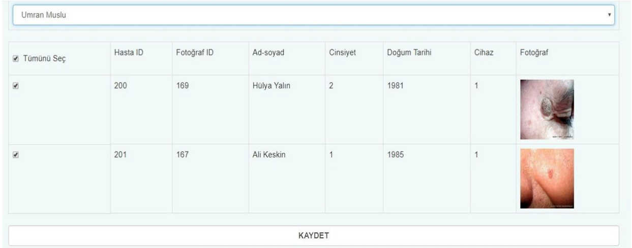
Şekil 4. Hasta Gönderme (A), Hasta Gönderme (B)