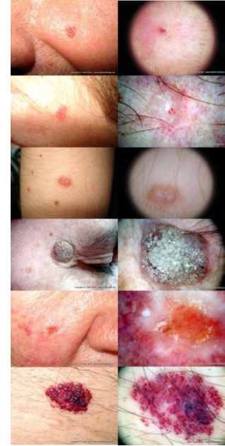
Şekil 1. Aktinik Keratoz, Bazal Hücreli, Dermatofibrom, Seboreik Keratoz, Skuamöz hücreli karsinom, Vasküler tümör

Hitit Üniversitesi Tıp Fakültesi, Plastik Rekonstrüktif ve Estetik Cerrahi Kliniğinde, ardışık 100 deri tümörü hastasının preoperatif fotoğrafları çekildi. Hastaların hastalık bilgileri ve fotoğrafları bu çalışma için özel olarak tasarlanmış web sitesine yüklendi. Web sitesi alt yapısını PHP web programlama dili ve MYSQL veri tabanı programı oluşturmaktaydı. Deri ve Zührevi Hastalıklar Anabilim Dalı Kliniğinde konusunda uzman bir teledermatolog tarafından hastalar değerlendirildi. Daha sonra bu tanımlar histopatolojik tanımlarla karşılaştırılarak teletıp tekniğinin plastik cerrahideki başarısı istatistiksel olarak araştırıldı. Araştırmamız kapsamında fotoğraflanan deri tümörlerine ilişkin sırasıyla klinik (sol) ve dermatoskopik (sağ) görüntülerden bazı örnekler Şekil 1' de gösterilmiştir.