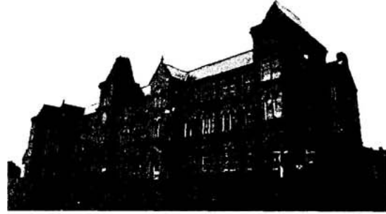
Huddersfield çalışma evi, 2001

a) Speenhamland sistemiyle çalışma evleri dışında verilen yardım uygulamasına son verildi (1834 Tarihli Yoksul Yasası: Madde 54): 1834 Yeni Yoksul Yasasının öngördüğü standart bir yardım biçimiydi. Bunun daha etkili ve denetim altında yapılabilmesi için bağımsız