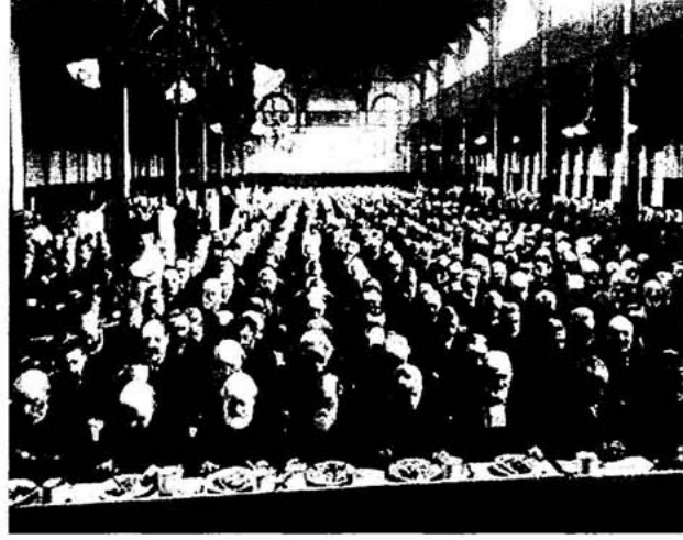
Marylebone, Parish Çalışma Evi Yemekhanesi, 1900

ancak tedbir alınabilen kaçınılmaz bir durum olarak durmaktadır. Yoksullara yaşamları garanti altına alınarak yardımda bulunulması bu tehlike açısından iki önemli sonuç doğurmaktadır: 1) Mevcut yoksul yardım sistemi yiyecek miktarı açısından her hangi bir artışa neden olmadan yoksulların gelir düzeyini artırarak, çocuk sahibi olmalarını özendiriyor. 2) Yardımlar, çoğu zaman yoksulları yardıma bağımlı yapıyor ve ahlâki olarak bozuyor (Malthus, 1959: 29-30).