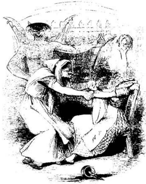
THE "MILK" OF POOR-LAW "KINDNESS."

Punch Dergisinden Yayınlanan Yeni Yoksul Yasası karşıtı bir poster: 'Yeni Yoksul Yasasının şefkati'