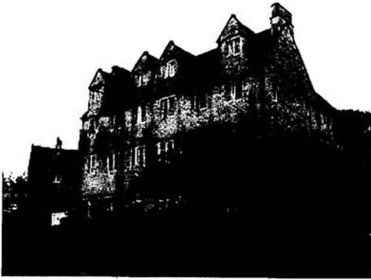
Parish çalışma evi, Box, Wiltshire, 1729

İngiltere’de Endüstri Devrimi öncesinde yoksul yardımı hak olmanın çok gerisinde toplumca üstlenilmesi gereken bir görev olarak tanımlanmıştır. Daha çok dinsel ve ahlâki değerlerce tanımlanan bu anlayış içinde bireylerin neden yoksul olduğu tartışma dışında kalmış, çalışabilir veya çalışmaz durumda olsun her kim ihtiyaç içindeyse yardım alması uygun görülmüştür. Sınıfsal ayrışmanın henüz keskinleşmediği bu yapıda çıkar birlikliği ve bu çıkarların karşılıklı bağımlılığına inanç, kendine yeten geleneksel yapının sosyal yardım anlayışını biçimlendirmiştir. Yoksulluk ancak sosyal düzeni tehdit edecek bir aşamaya geldiği zaman bir sorun olarak görülmüştür. Bu çerçevede yoksullara yönelik koruyucu düzenlemeler daha çok dinsel ve vicdani değerler içererek, aile, mahalle ve kilise yetkilileri tarafından üstlenilmiştir (Marshall, 1965: 15). Yoksul yardımlarının parish idarecilerinin yönetimine bırakılması 1536 tarihinde kabul edilen yasayla gerçekleşmiştir. 2 Bu yasayla her parish bölgesindeki yoksullar için vergi toplayabilmekteydi.