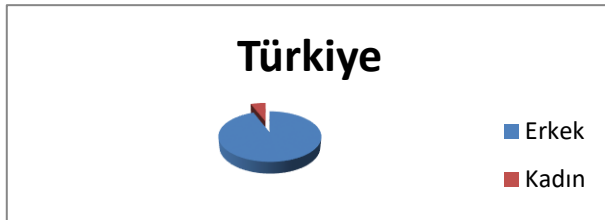
Tablo 3: Türkiye'deki kadın-erkek güreşçi oranı.