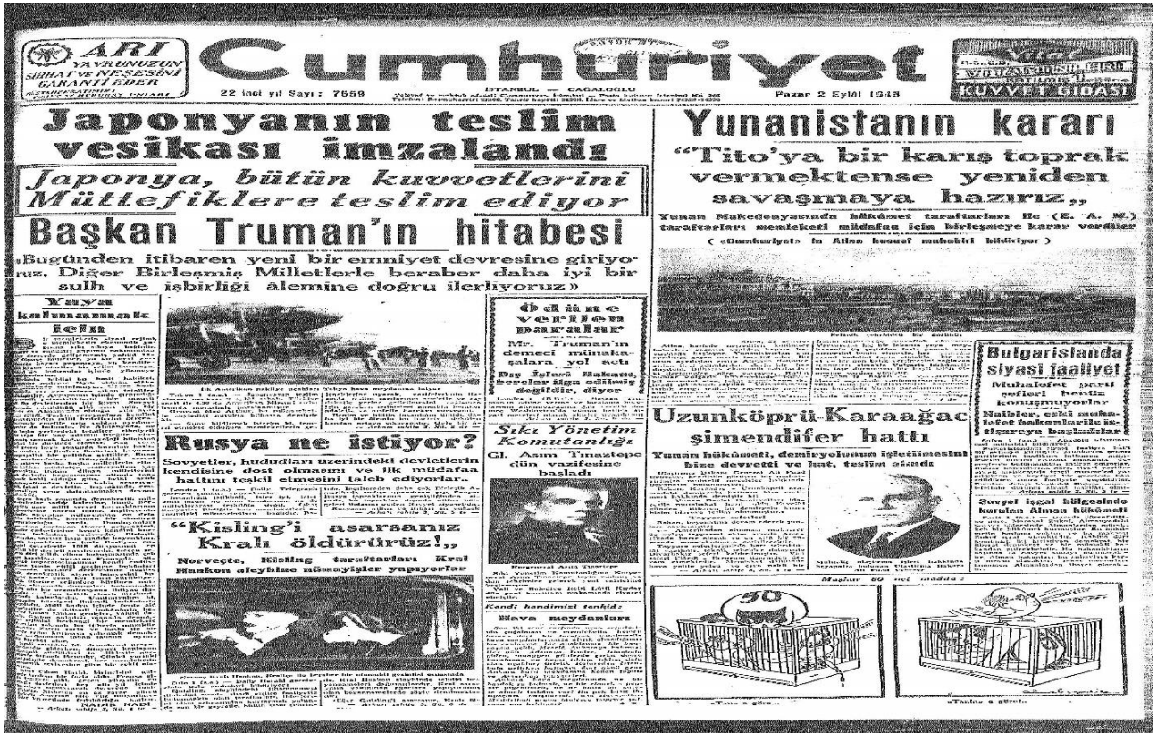
Ek 4: Cumhuriyet, 01.09.1945, s. 1.