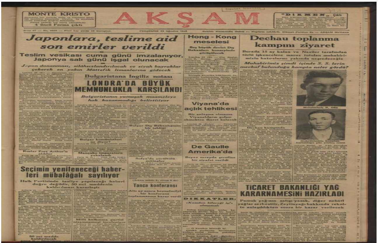
Ek 3: Akşam, 23.08.1945, s. 1.