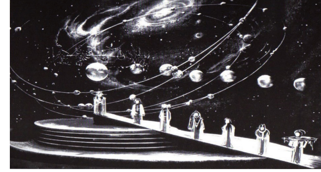
Görsel 6. Dünyanın Harmonisi, Die Bühne mein Leben (Çevik, 2011: 81)