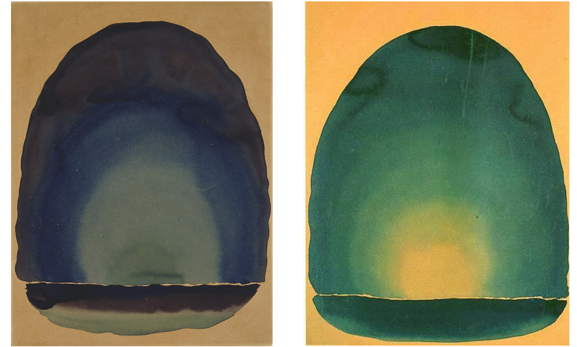
Görsel 15. Georgia O'Keeffe, Light Coming on the Plains No. III , 1917. Watercolors. (1887-1986) (Solda)

Georgia O'Keeffe, 20. yüzyılın önemli Amerikan modernizminin öncü ressamlarından olan O'Keeffe, soyut kompozisyonları ile görsel anlatımını zenginleştirmiş, ilerleyen zamanlarda saf soyutlamayı uygulayan sanatçılardan biri olmuştur. Eşi Stieglitz'in ölümünden sonra 1949'da New Mexico'ya taşındığında sonraları zamanının çoğunu dünyayı dolaşarak geçirmiştir. Ziyaret ettiği yeni yerlerden ilham kaynakları bulmuş ve 1965 yılında bulutların üstünde gökyüzünde görüldüğü gibi, bulutların havadan görünüşlerini gösteren bir dizi çalışma yapmıştır 5 . Georgia O'Keeffe'nin suluboyaları adeta gökyüzünün görme alanımızı doldurduğu şekli ile oluşturulmuştur. Güneş, ay ve bulutlar, figüratif olan her şey çıkartıldığında soyut bir biçime dönüşür. O'Keeffe, Teksas'ın üzerindeki muazzam gökyüzü, sanatında natüralizm ile saf soyutlama arasında dolaşmaktadır 6 .