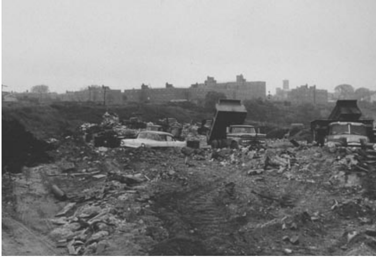
Görsel 11. Mierle Laderman Ukeles, Mayor Thomas W. Danehy Park, Cambridge, Massachusetts, Park yapımı öncesi.

Ukeles, bu çalışmasında bir astrofizikçi tarafından çekilen radyo teleskop görüntüsünden tasarlanan teleskopik görüntüyü 24 metrelik bir fotoğrafa dönüştürmüş, 65 bölüme ayırmış ve bir ekip ile birlikte geri dönüştürülmüş kauçuktan yeni bir çalışma üretmiştir. Geri dönüştürülmüş kauçuk granül malzemeleri kullanarak renkli dans pisti yapmıştır. Çalışmalarında kullanılan malzemeleri seçen sanatçıyı, Cambridge Sanat Konseyi, yetkili kuruluşlar tarafından tescillenen su bazlı ve toksik olmayan özellik taşıyan bu granülleri kullandığı için araştırmalarında ve uygulamalarında desteklemiştir. Bu anlamda sanatçı, sanatsal yaratım sürecindeki farklı materyal kullanımı ile de oldukça dikkat çekmiştir. 2