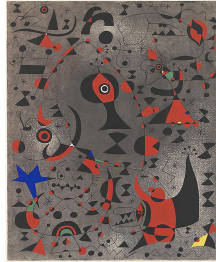
Görsel 18. Joan Miró. from the Constellation series. 18 x 15 in. (45.7 x 38.1 cm), 1941. (Solda)