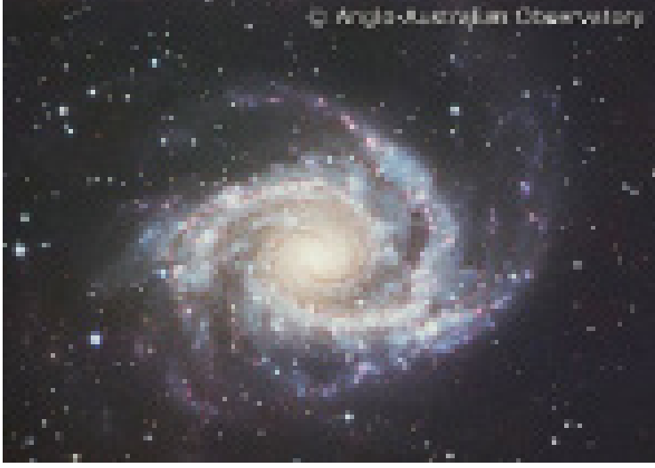
Görsel 10. Sanatçının esin kaynağı.

York Şehir Sanitasyon ve Ulaştırma Bakanlığı) tarafından kapsamlı üç test yapılmıştır. Ek olarak yaklaşık 7 metre çaplı çalışmada plastik atıklarından yapılmış bir galaksi görseli de bulunmaktadır. Höyüğün tepesinde ziyaretçiler bir tahta oturarak alanın olağanüstü manzarasını izleyebildikleri için tepenin kraliçesi/kralına dönüşürler. Sanatçı peyzaj mimarı John Kissida ile höyüğü ve çevresindeki alanı bitkilendirme üzerine ortak çalışmalar da yapmıştır (Türkdoğan, 2017: 59-62).