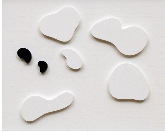
Görsel 20. Jean Arp, Constellation with Five White Forms and Two Black, Variation III , 1932, Oil on wood, 23 5/8 x 29 5/8 inches (60 x 75.5 cm), Solomon R. Guggenheim Museum, New York.

gibi gökyüzüne ait formların takımyıldızlarından esinlenen soyutlanmış biyomorfik yansımalarıdır. Arp, genel olarak bu biçimlere kozmik formlar demektedir. Arp'ın ahşap kabartmaları tesadüfi yaklaşımlara olanak sağlayan bir kompozisyon anlayışı ile dada ve gerçeküstücülük ile yakından ilişkili olup, Joan Miro ve Henry Moore gibi sanatçıları etkilemiştir (Kear, 2016 11 ).