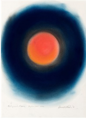
Görsel 13. David Nash, Eclipsed Moon , 2015, Galerie Lelong&Co.-Paris. 49x36 cm.

Nash'in işsizlik ve nükleer savaşa karşı duyduğu bir tepkinin sonucunda doğanın ve gezegenin yok olmaması için uzun vadeli bir inanç eylemi yapmıştır. Orman, gökyüzü, toprak çalışmasının önemli bir üçlüsünü oluşturmaktadır, 3,4 Nash'in arazi çalışmaları oldukça uzun süren, neredeyse uzun yıllar sonucunda amacına ulaşabilen, doğanın tam da göbeğinde, gezegenimizin korunmasını vurgulayan çok etkili çalışmalardır. Bunun yanı sıra "Eclipsed Moon (Tutulmuş Ay)" isimli çalışmasında ise direkt gökyüzünden bir surete yer vererek kağıt üzerine pastel boya ile sanatsal anlamıyla özgün bir yorumla dönüştürmüştür.