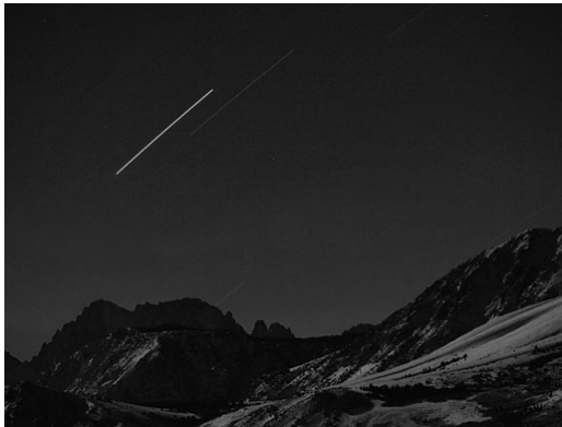
Görsel 9. Trevor Paglen, Gök Cisimleri, İstanbul, Fotoğraf, 2009.

Trevor Paglen'in çalışması, sosyal bilimler, astronomi, güncel sanat dinamikleri gibi kavramlar arasında dolaşmaktadır. Konularının genel çerçevesini ise deneysel coğrafya oluşturmaktadır. Sanatçı, gökyüzündeki yıldızların ışık çizgileriyle bölündüğü fotoğraflar çekmiştir. Bu fotoğraflar vizörden geçen ve uzun pozlandırma ile yakalanan uyduların izleridir. Bu sunum, adeta gizli operasyonların görsel bir ifadesi yorumunda ve yörüngesinde ilerleyen Dünya fotoğrafları da bir gözlem istasyonundaki monitörler gibi duvarları kaplamaktadır. Kozmik bir görseelliği sunan fotoğrafları, kara dünyanın belirsizliğini vurgulamaktadır. Bu proje (11. Uluslararası Sanat Bienali 12 Eylül-8 Kasım 2009, Antrepo No: 3) Michelle Dizon, Prof. Dr. M. Türker Özkan, Doç. Dr. A. Talat Saygıç, Yrd. Doç. Dr. M. Taşkın Çay, Yrd. Doç. Dr. Hasan Hüseyin Esenoğlu, Yrd. Doç. Dr. İpek H. Çay, Araştırma Görevlisi Sinan Aliş, Araştırma Görevlisi F. Korhan Yelkenci, Özge Ünal ve Arzu Yayıntaş'ın yardımı ve işbirliğiyle gerçekleştirilmiştir 1 .