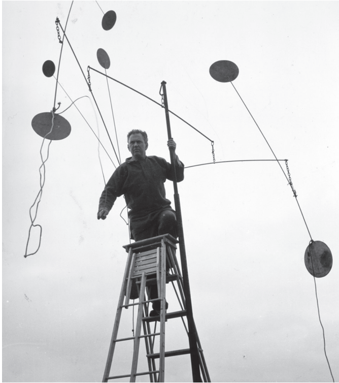
Görsel 3. Alexander Calder çalışırken