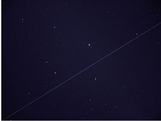
Görsel 8. Trevor Paglen, Gök Cisimleri, İstanbul, Fotoğraf, 2009.

Trevor Paglen, 1974'de doğmuştur. Berkeley ve New York'ta yaşayan sanatçını on birinci İstanbul Bienali'ndeki çalışmaları değerlendirildiğinde konularını deneysel coğrafya merkezli seçtiği anlaşılmaktadır. İstanbul'un üzerinde geri ileri dolaşan askeri ve keşif istihbarat uydularını saptayan "Gök Cisimleri (İstanbul) 2009" çalışması, İstanbul Üniversitesi Astronomi Bölümü'nün işbirliği içinde gerçekleştirilmiştir. Sanatçı gizli askeri operasyonlar, uydu gözlemcileri, CIA programları, gizli askeri endüstriyel kompleksin kara dünyası ve gizli uydular gibi durumları araştırmaktadır. Bu çalışmasının da etkili sunumu ile, saf astronomik resimleri andıran bu fotoğraflarda kara dünyanın belirsizliğine bir göndermede bulunduğu söylenebilir (Baliç, 2009: 210-211; Baliç'den Aktaran: Albayrak, 2015, s.16-17).