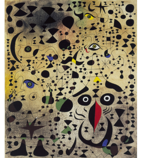
Görsel 19. Joan Miró. The Beautiful Bird Revealing the Unknown to a Pair of Lovers, (from the Constellation series). 1941. (Sağda)