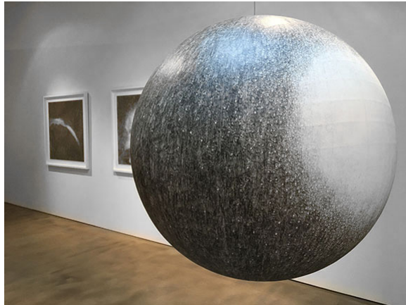
Görsel 5. M28 Globular Cluster in Sagittarius, 2000, Ink on paper mounted on Lucite 24" diameter globe