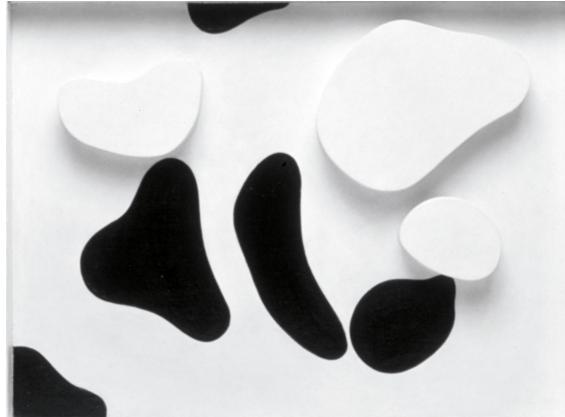
Görsel 21. Jean Arp, Constellation selon les lois du hasard , Painted wood, Object: 549 x 698 mm frame: 772 x 910 x 100 mm, Jean Arp (Hans Arp) 1886–1966, Tate Collection.