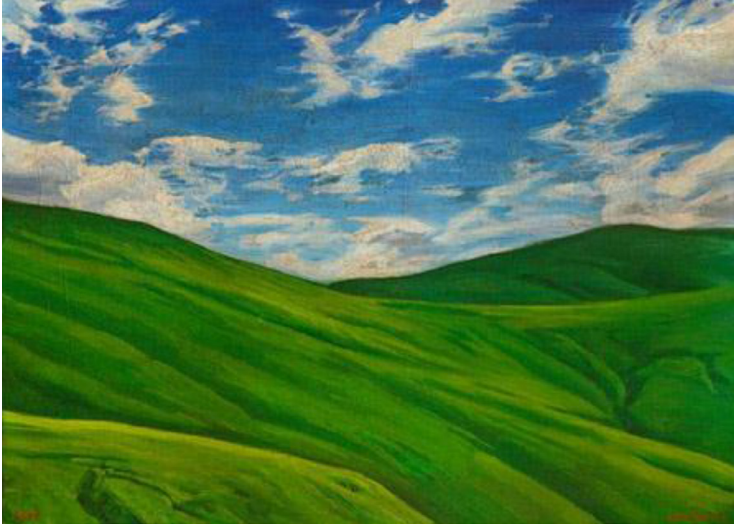
Görsel 1. Emre Tandırlı, Le paradis virtuel (Sanal cennet) , 2007, Tuval üz. Yağlıboya, 54 x 75 (Tandırlı, 2012: 165).

Emre Tandırlı'nın doğa imgelerinde geleneksel malzeme ile doğa görünümlerinin bir tür simülasyonları ile karşı karşıya kalınmaktadır. Günümüz teknolojilerinin dijital görüntülerinin yerine ideal güzelliği vurgulayan mistik ve sanal cennetlere dönüşen yeni doğa görünümleri ile Tandırlı, doğanın yüzyıllardır süregelen pitoresk olgusuna güncel bir yorum getirmektedir (Tandırlı, 2012: 164).