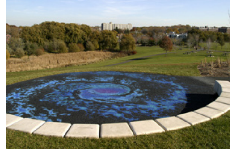
Görsel 12. Mierle Laderman Ukeles, Turnaround/Surround, 1989, Mayor Thomas W. Danehy Park, Cambridge, Massachusetts

Ukeles, bu çalışmasında bir astrofizikçi tarafından çekilen radyo teleskop görüntüsünden tasarlanan teleskopik görüntüyü 24 metrelik bir fotoğrafa dönüştürmüş, 65 bölüme ayırmış ve bir ekip ile birlikte geri dönüştürülmüş kauçuktan yeni bir çalışma üretmiştir. Geri dönüştürülmüş kauçuk granül malzemeleri kullanarak renkli dans pisti yapmıştır. Çalışmalarında kullanılan malzemeleri seçen sanatçıyı, Cambridge Sanat Konseyi, yetkili kuruluşlar tarafından tescillenen su bazlı ve toksik olmayan özellik taşıyan bu granülleri kullandığı için araştırmalarında ve uygulamalarında desteklemiştir. Bu anlamda sanatçı, sanatsal yaratım sürecindeki farklı materyal kullanımı ile de oldukça dikkat çekmiştir. 2