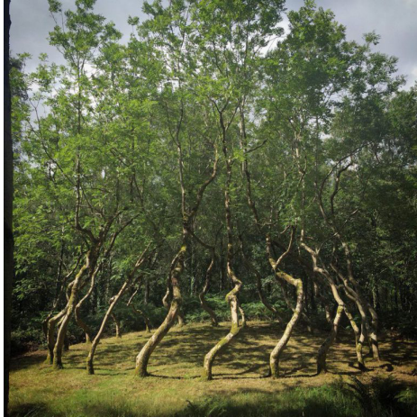
Görsel 14. David Nash, Ash Dome, in Wales .