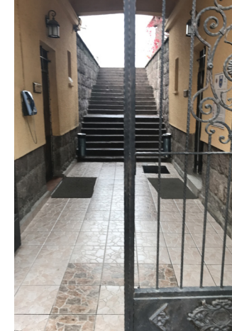
Görsel 5. Roma Hamamı Açık Hava Müzesi Girişi

Kentsel kültürel mirasın vurgulandığı açık hava müzelerinin herkes için tasarım kavramı doğrultusunda mekansal düzenlemelerin yapılması, müze ziyaretçilerinin erişilebilirliğini arttırmaktadır. Bu kapsamda kentsel arkeolojik miras açısından önemli yeri olan Ankara Roma Hamamı açık hava müzesinin mekanlarının erişilebilirliği ve kullanılabilirliği değerlendirilmektedir. Çalışmanın yapıldığı Roma Hamamı Açık Hava Müzesinin girişi ve kapısı herkes için erişilebilir mekansal özellikleri taşımamaktadır. Bu alanda TS 12576 standartları ile belirlenmiş tasarım ilkeleri kullanılmalıdır. Müzede, dikey dolaşım elemanları olan rampa ve merdivenler, için gerekli düzenlemelerin yapılması erişilebilir, güvenli ve konforlu müze mekanlarına imkan verecektir.