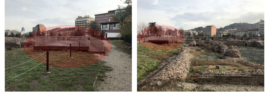
Görsel 7. Roma Hamamı Açık Hava Müzesinde Yer Alan Seyir Platformu

Roma Hamamı Açık Hava Müzesi sergi dolaşım alanlarındaki yer döşemelerinde uygun malzemenin kullanılmadığı gözlemlenmektedir. Dolaşım alanlarındaki zemin malzemesinin kaygan olmaması ve hissedilebilir yüzeylerin kullanılması tercih edilmelidir. Kentsel mekanın kullanımı ve erişilebilirliği zemin kaplaması olarak kullanılan hissedilebilir yüzeyler, açık hava müzelerinde bireylerin ulaşılabilirliğini arttıracak şekilde gerçekleştirilmelidir. Hissedilebilir yüzeyler, müze ziyaretçileri için algılanabilir şekilde düzenlenmelidir. Yürüme kılavuz izi, yön değiştirme, uyarıcı elemanlar şeklinde hissedilebilir yüzeyler üç bölüme ayrılmaktadır. Müzede yatay dolaşım alanlarının genişliği standartlara uygun ölçülerde olmalıdır. Özellikle arkeolojik açık hava müzelerinin sergi dolaşım alanları üzerinde, uygun yerlere ziyaretçilerin dinlenebilmesi için oturma elemanları yer alabilir.