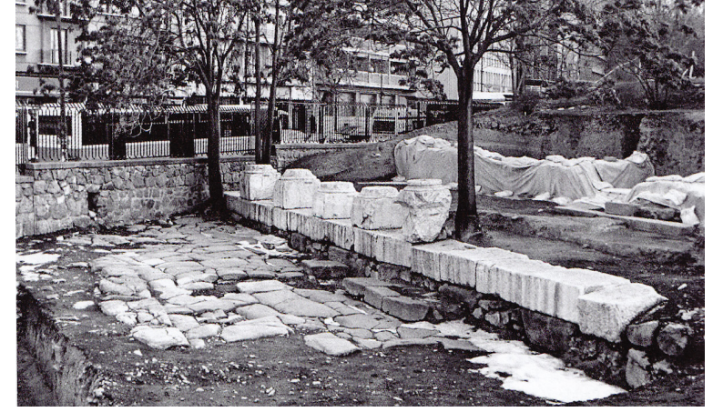
Görsel 4. Büyük Hamam

Sütunlu yol/cadde; Roma döneminde etrafında galerilerin de bulunduğu sütunlu yollar inşa edilmiştir (Görsel 2, 22) (Anadolu, 2001: 13). 19. yüzyılda Von Vincke tarafından yapılmış Ankara'nın planı incelendiği zaman; kente her yönden ulaşan yolların olduğu görülmektedir. Özellikle Çankırı kapı olarak isimlendirilen ve sütunlu yolun bulunduğu yerden giren kuzeybatı yolunun kente bağlandığı söylenebilir. Hamam binasının ve Palaestra'nın doğusunda yer alan Sütunlu yolun/caddenin Roma dönemi kentinin ana yollarından biri olduğu ve kentin kutsal alanı olan Augustus Tapınağı'nın bulunduğu yere kadar devam ettiği düşünülmektedir (Görsel 4) (Kadioğlu vd., 2018: 244). Kazı çalışmaları sonucunda Büyük Hamama ait Palaestra'nın güneydoğu köşesi ve kuzeybatı-güneydoğu yönlü sütunlu caddenin bir bölümü ortaya çıkarılmıştır. 2007 yılında sütunlu caddenin üst kottan akan toprak ve bitki ile kaplanmasından dolayı caddenin kuzey ve güneyinde kazı çalışmaları gerçekleştirilmiştir (Kadioğlu vd., 2018: 159-60).