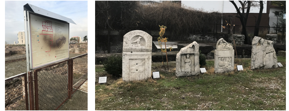
Görsel 8a (solda)-8b (sağda) Roma Hamamı Açık Hava Müzesindeki Mevcut Bilgilendirme Elemanları

Açık hava müzesinde Büyük Hamam yapısının izlenebildiği iki adet platformun bulunduğu alandaki çevresel düzenlemelerde rampa kullanımı, müze ziyaretçilerinin ergonomik ve fiziksel gereksinimleri doğrultusunda uygun tasarlanmıştır (Görsel 7).