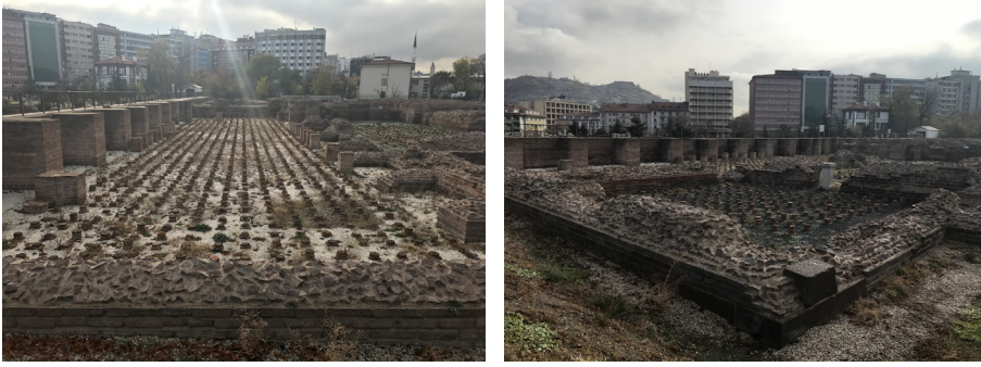
Görsel 3. Büyük Hamam

Roma (Caracalla) Hamamı (Görsel 2, 20) duvar, kemer, tonoz, sıva, harç, taban mozaikleri, su yolu gibi mevcut kalıntılar sayesinde özgün plan şeması görülmektedir. Hamam, palaestra ve kapalı hamam kısımlarından meydana gelmektedir. Yapıda mevcut bölümleri duvarlar oluşturmaktadır. Hamamın ısıtma sistemine ait duvar (Görsel 3), kemer, tonoz, yuvarlak tuğlalı sütunlar ve diğer mevcut yapı elemanları bulunmaktadır. Ayrıca kazı alanında taban mozaikleri, sıvalar ve mermer kaplamalar yer almaktadır (Şener, 2017: 234). Roma Hamamının ana binası Caldarium (sıcak), Tepidarium (ılık) ve Frigidarium (soğuk) bölüm olmak üzere üç ana gruba ayrılmaktadır.