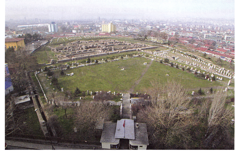
Görsel 1. Ankara Roma Hamamı Açık Hava Müzesi Genel Görünüm

Bizans, Selçuklu ve Osmanlı dönemlerine ait seramikler ile höyüğün tarihsel katmanları belirlenmiştir (Kadioğlu, Görkay ve Mitchell, 2018: 181).