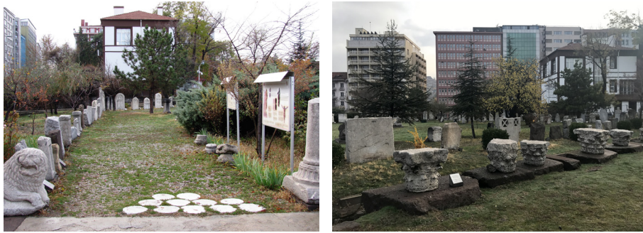
Görsel 6a (solda)-6b (sağda) Roma Hamamı Açık Hava Müzesi Mevcut Dolaşım Alanı

Müze girişinde yer alan mevcut merdivenin yanında bütünleyici rampalı yolun yer alması gerekmektedir. Bu çözüm ziyaretçiler için düşük fiziksel çaba ile eşit kullanım ve herkes için erişilebilirlik açısından önemlidir (Görsel 5). Rampa kaygan olmayan yüzeye sahip olmalı, konumu kolayca algılanabilmelidir. Rampanın fiziki olarak mümkün olmadığı mekansal durumlarda, taşıyıcı sistem olarak merdivenin içine gizlenebilen platform asansör veya merdiven asansörü gibi müze ziyaretçilerinin kolay ve güvenli şekilde müze sergileme alanına ulaşılabilirliği sağlanmalıdır. Tekerlekli sandalye kullanan müze ziyaretçileri için yeterli manevra alanı bulunmalıdır.