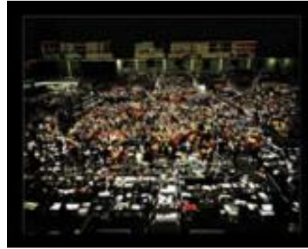
Fotoğraf 4: Chicago Board of Trade, 1997, 2,355,597 $ Sotheby's London, Haziran 26, 2013 ( https://artsy.net/post/sothebys-andreas-gursky-stock-exchanges ) (10/05/2014)