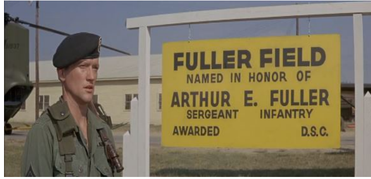
Şekil 4. Yeşil Bereliler (1968) – İsim Plaketleri

Albay üsse indiğinde birlikte çalışacağı Albay Cai'dan son durumla ilgili bilgi alır ve kurulan kamplara gitmek üzere A takımıyla birlikte yola çıkacakları sırada, tanıtım sırasında savaşla ilgili sorular soran Gazeteci Bay Beckworth'de yanlarına gelerek onlarla gitmek istediğini söyler. Başta asker alanlarının sivillere göre olmadığını vurgulamasına rağmen gazetecinin ısrarı üzerine gelmesine müsaade eder. Gerçekleri anlatma ve propaganda amacı taşıyan filmin bu sahnesinde, gazeteciyi büyük bir rahatlıkla aralarına almaları ve savaş alanına götürmeleri izleyici tarafından güvenoyu sağlamaktadır. Devamında, henüz tamamlanmamış olan kampa iniş yaparlar ve etrafta güvenlik kontrolü yapan Albay, kampı geliştirmek için çalışmalar başlatarak herhangi bir işgal durumunda nasıl önlemlerin alındığını öğrenir. Devamında, kamp alanında bulunan ve ailesi Vietkong (Kuzey Vietnamlılar) tarafından öldürülmüş yetim bir çocuk olan Hamchunk, her şeyi bulan Peterson ile karşılaşır ve işi gereği tercümanlık yapması için çocuğu kullanabileceklerini söyler.