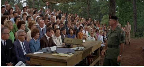
Şekil 1. Yeşil Bereliler (1968) - Tanıtım Sahnesi

çekilen film, yeşil berelilerin bir tanıtım organizasyonuna gelerek kendilerini tanıtımlarıyla başlamaktadır. Bu sahnede bir düzine askerin ayrı ayrı uzmanlık alanlarına göre eğitim aldıkları ve farklı diller bildikleri yansıtılmak istenmiştir. Amerikan halkı arasında kendilerini tanıtan, yeşil berelileri dinleyen gazeteciler onlara Vietnam savaşı hakkında sorular sorarlar ancak Amerika basınının yapılan bu müdahaleye karşı oldukları oldukça net bir şekilde gözükmemektedir. Yeşil bereliler savaşa girmelerinin sebebini kadınların ve çocukların katledilmesi, halkın işkence görmesi olarak açıklar ve diğer devletlerin savaşa dâhil olduklarını kanıtlamak için önlerine savaş alanında buldukları başka milletlere ait silahları atarlar. Bu doğrultuda yeşil bereliler savaşa müdahale etme gerekçelerini Amerika'nın 11 yıl süren kurtuluşu için verdiği mücadele ile bir tutmuşlardır. Böylece izleyiciye savaşa neden girdikleri açıklanmış ve o dönemde savaşa gönderilen yeşil bereliler daha yakından tanıtılmıştır.