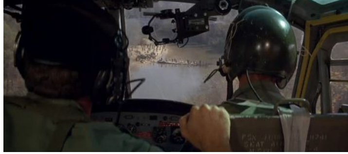
Şekil 6. Yeşil Bereliler (1968) - Helikopter

bitenlere tanık olan gazeteci, etraftaki Güney Kore askerleriyle sohbet eder ve Amerika'nın getirmiş olduğu helikopterler için onlar olmasa savaşı kazanamayız vurgusu yaparlar. Dönemin şartlarında ABD tarafından sağlanan güvenlik yardımı için getirilen silahlar, savaş boyunca Güney Kore'nin şartları eşitlemesine yardımcı olduğu bilinmektedir ve filmin birçok sahnesinde bu önem, farklı şekillerde vurgulanmaktadır. Sahnenin devamında ise helikopterler, etraftaki arazide bulunan Vietkong'luların inşaa ettiği köprüyü fark ederler ve bombalayarak karşı kıyıya geçmelerini önlerler.