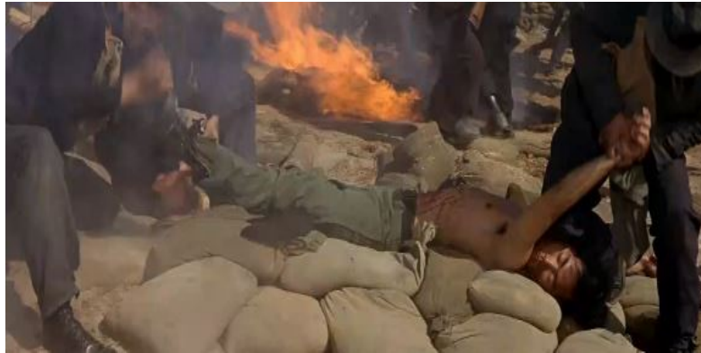
Şekil 6. Yeşil Bereliler (1968) - Yağmalama Sahnesi.

Sahnenin devamında destek ekiple buluşan Albay ve takımı, kurdukları hava pususu sonucu kamp alanına girmeyi başarırlar. Çatışma, gün doğumuna kadar devam eder ve içlerinde bulunan hainler tek tek ortaya çıkmaktadır. Gözcü kulesinin de yıkılması üzerine kamp alanından geri çekilmek zorunda kalan Albay, yeşil berelilere imha emrini verir ve sivil halkla birlikte kamp alanından ayrılırlar. Amerikan üssüne sivil halkı götüren uçakların birine Hamchunk'nda binmesini sağlayan Peterson, onun güvende olmasını sağlayarak takım arkadaşlarının yanına döner. Bu esnada Vietkong'lular kamp alanında zaferlerini kutlarken ve ölen askerlerin eşyalarını yağmalarlarken gösterilmektedir.