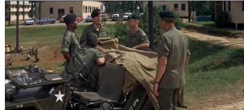
Şekil 2. Yeşil Bereliler (1968) - A Takımı

Başrol oyuncusu olan John Wayne, Albay Mike karakteri olarak karşımıza çıkar ve savaş ile ilgili toplantıdan çıkan Albay, tanıtımın yapıldığı alanda görülür. Tanıtım bitiminde bir gazetecinin yanına gelerek ona savaşı sorması üzerine, daha önce Güney Asya bölgesinde bulunup bulunmadığını sorar ve hayır cevabını aldığı anda gülümseyerek yanından ayrılır. Çünkü bu sahnede izleyiciye daha önce orada olmayanların savaşta yaşananları asla tam anlamıyla bilemeyecekleri, basının her dediğine inanmamaları ve halka karşı 'biz oradaydık, biz biliriz' imajı yansıtılmak istenmiştir. Bir sonraki sahnede yeşil bereli asker, Albay'ın yanına gelerek Vietnam Savaşına gitmek için gönüllü olmak ister. Onu kabul eden Albay, akla gelebilecek her şeyi bulabilmesiyle mimlenmiş olan son adayı uzaktan diğer takım arkadaşlarına izletir ve onu da takıma dâhil eder. Devamında Albay gecenin bir vakti tüm koğuştan kaldırarak Vietnam'a yola çıkararak Amerika'dan ayrılırlar. Güney Vietnam'da Amerika'nın kurmuş olduğu askeri üsse iniş yapan Albay ve takımı, belli alanlarda ölen askerlerin isimleri verilmiş tabelalarla karşılaşır. Öyle ki bir sahnede bir yeşil bereli, Albay'a öldüğü takdirde istediği ismin yazılması için ricada bulunmaktadır. Böylece izleyicinin gözünde yeşil bereliler kutsallaştırılarak, öldükten sonra da isimlerinin hatırlandığı ve unutulmadıkları hissi verilmektedir.