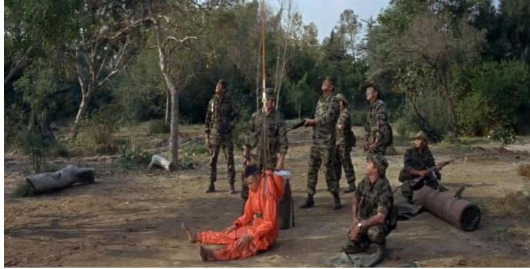
Görsel 7. Yeşil Bereliler (1968) - General Ti Teslim Sahnesi

Vietkong askerleri onları fark etmeden General Ti'nin bulunduğu evin içine girerek onu dışarı çıkarmayı başarırlar ve yolda takip edilmemeleri için köprüyü patlatan yeşil bereliler, General Ti'i almaya gelen uçağa binmesini sağlarlar. Görevini başarıyla tamamlayan Albay, takımıyla birlikte üsse geri döner ancak görev esnasında kaybettikleri kişilerden biri olan Peterson'u Hamchunk'ın beklediğini görür ve yanına giderek onunla konuşur. Peterson'un cesur olduğunu söyleyerek yeşil beresini ona verir ve Hamchunk'a yeşil bereli olarak hitap eder. İkisinin sahil kenarında yürümesini izleyen kamera görüntüsü ile film bitirilir.