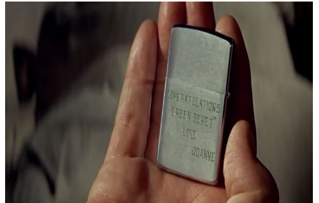
Şekil 3. Yeşil Bereliler (1968) - Peterson ve Hamchunk Şekil 4. Yeşil Bereliler (1968) - Çakmak