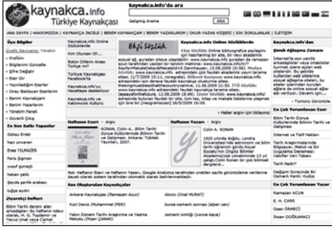
Ekran Görüntüsü 1: Kaynakca.info Ana Sayfası (21.03.2011)

18.04.2011 tarihi itibarıyla sitenin 5700’ün üzerinde çoğu üniversite öğrencisi ve eser sahibi üyesi bulunmaktadır. Site içeriğine, “operatör” ve “editör” rollerindeki üyeler katkıda bulmaktadırlar. Bu yolla şimdiye kadar 105.700 eserin künyesi (ve bazılarının tam metni) ve 1500 yazarın biyografisinin girişi ve kontrolü yapılmıştır.