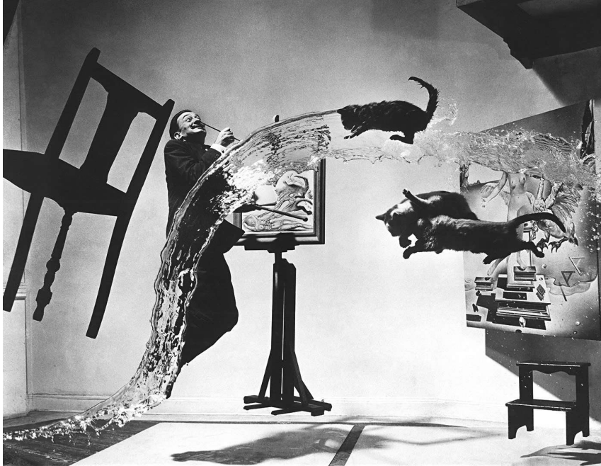
Figür 2: Philippe Halsman, "Dali Atomicus", 1948.

İkinci Dünya Savaşı'nın, Bauhaus okulu üzerinde olumsuz etkileri olsa da, okulun fotoğrafa verdiği ayrıcalık ve farklı yaklaşımın etkileri var olmaya devam etmiştir. Gelişmeye devam eden teknoloji ile birlikte fotoğraf artık çok farklı uygulama alanları olan ve iyiden iyiye bir sanat formu olmayı başarmış bir kavram haline gelmiştir. Şüphesiz ki gelişen endüstri, gelişen fotoğraf teknolojisi ile birlikte fotoğrafçıların farklı uygulama alanlarına ilişkin arayışlara girişmesinin önünü açmıştır. Bu noktada öncü çabalardan birisine de Philippe Halsman ile şahit oluruz. Halsman'ın "Dali Atomicus" isimli çalışması tamamen sanatsal bir çabalar bütünüdür. Çekim sürecinde fotoğrafçıya yardım eden asistanların bulunması, içerdiği insan figürünün popüleritesi ve belirli bir fantastik amaç doğrultusunda çekilmiş olması gibi unsurlar bir araya getirildiğinde, fotoğrafın modern tarihi içerisindeki önemli eserlerden birisidir.