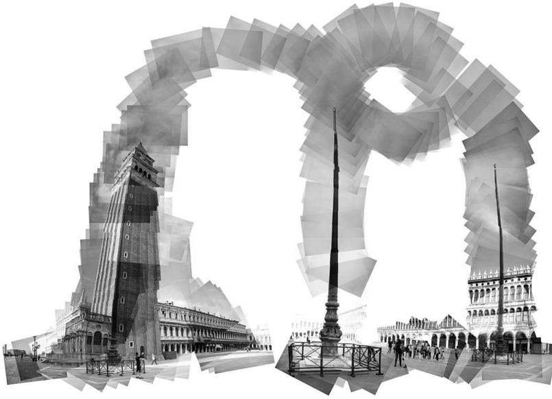
Figür 3: Venedik-Marco Polo Meydanı, Hatagrafi-2014

ve sanat eseri olmaya ilişkin bir çaba sergileyecektir. Kısacası sayısal teknolojilerin verdiği harikulade imkanların varlığını, hedefe ulaşmak için cepte duran pozitif olgulardan ziyade bağlamı yakalamaya yönelik ve dikkatli kullanılması gereken araçlar bütünü olarak görmek gerekmektedir.