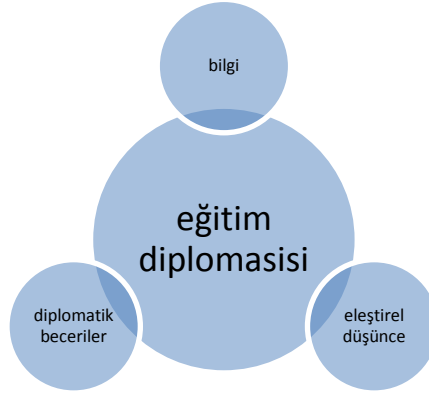
Şekil 2. Eğitim diplomasisinin bileşenleri

Yukarıdaki tanımların ışığında eğitim diplomasisi çok aktörlü, çok boyutlu ve çok düzeyli bir eğitim yönetimi stratejisidir. Yerel, karşılıklı iki ülke arası, bölgesel ve küresel düzeyde olmak üzere eğitim diplomasisi yürütülmektedir. Eğitim diplomasisi diplomatik beceriler, müzakere ve diğer iletişimsel araçlarla kamu ile kamu, devletle kamu arasında yerel, bölgesel, küresel eğitim sorunlarını çözmeyi amaçlamaktadır (Höne& Murphy, 2018) bu bağlamda eğitim diplomasisi bir liderlik alanı olarak ortaya çıkmaktadır. Eğitim liderlerinin diplomatik beceriler geliştirmeleri ülkenin eğitim diplomasisinin etkinleşmesi açısından önemlidir.