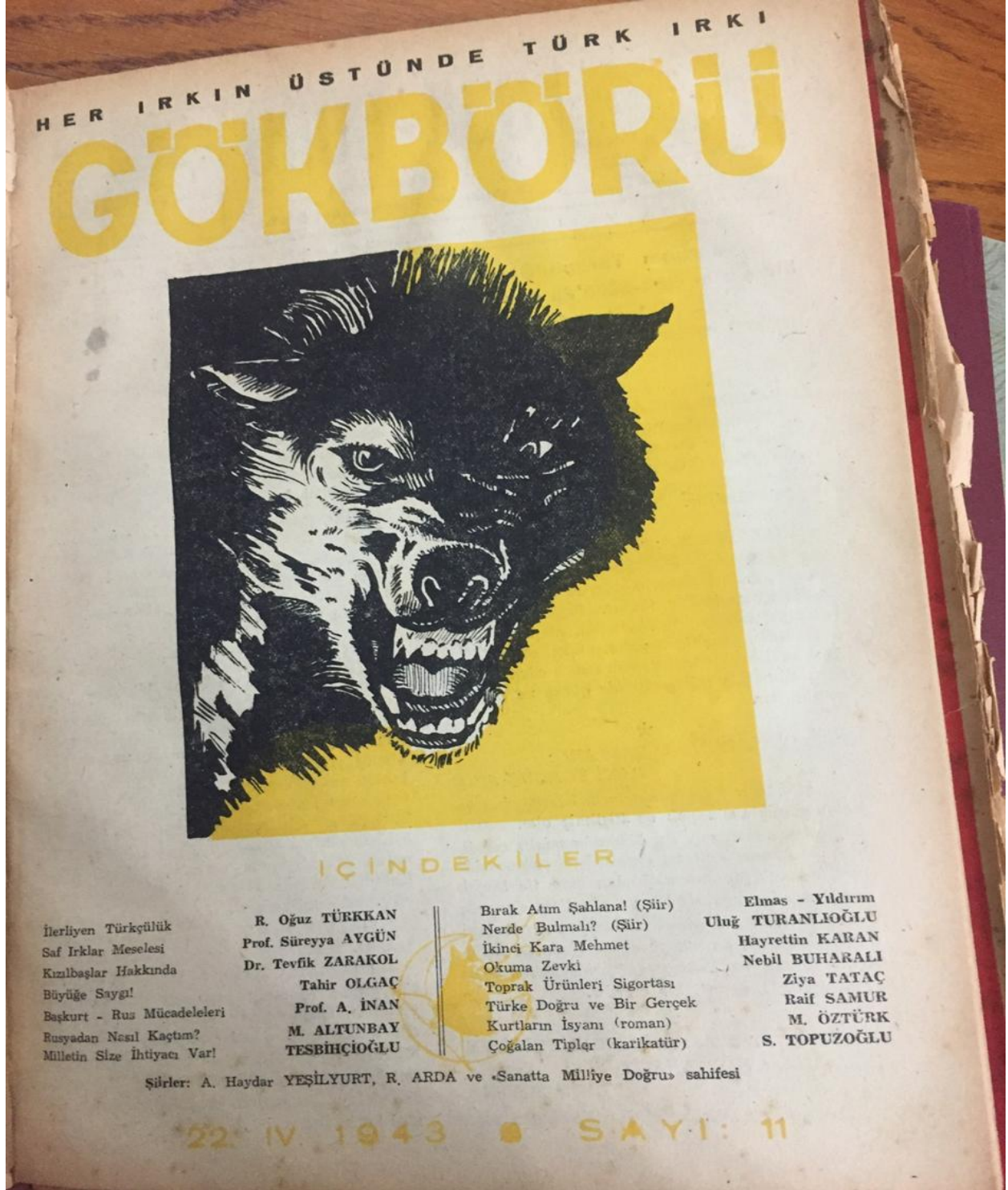
Ek-5: Gök-Börü Dergisi 11. Sayı Kapağı