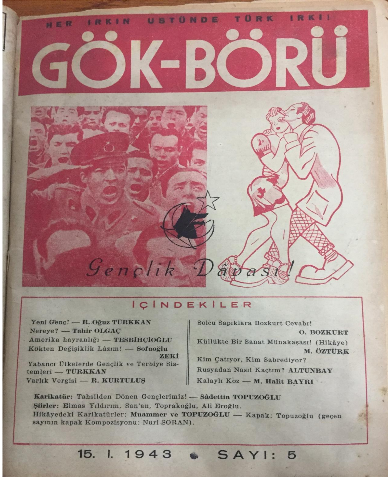
Ek-3: Gök-Börü Dergisi 5. Sayı Kapağı