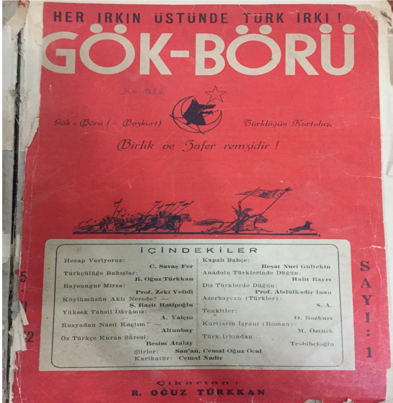
Ek- 1: Gök-Börü Dergisi 1. Sayı Kapağı