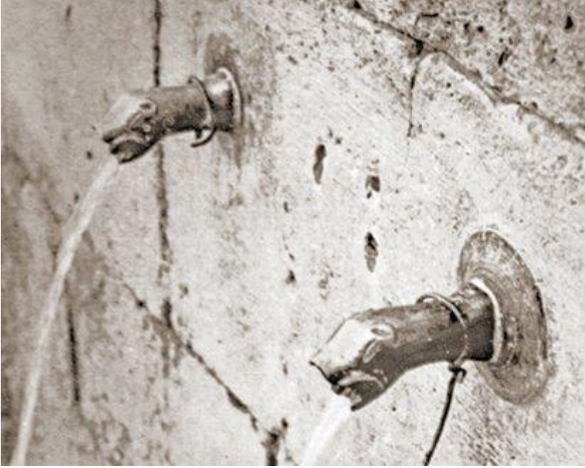
Resim 1: Hunad Hanı Çeşmesi Ejder Başlı Lülesi

üzere çeşmelere, “ hayat pınarı ”, “ suyun gözü ” anlamı yüklenmiştir. Bu nedenle çeşmelerin ve özellikle çeşme lülelerinin biçimleri konu kapsamı adına önemlidir.