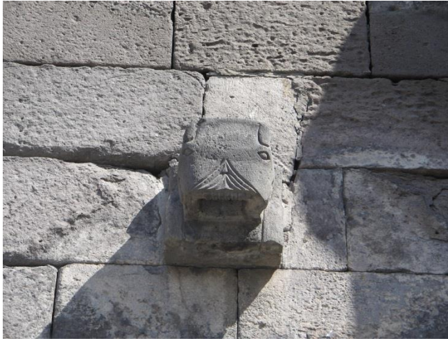
Resim 3: Hunad Hatun Külliyesi, Aslan Formlu Çörten.

Mimaride havuz ; İslam mimarisinde eyvan, avlu, havuz gibi mimari öğeler fonksiyonel olduğu kadar sembolik anlamlarda taşımaktadır. Örneğin dört eyvan geleneği, Büyük Selçuklu Devleti