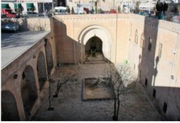
Resim 2: Mardin Şehidiye Medresesi, Selsebilli Eyvan ve Avlu Aksında Yer Alan Havuz (Çağlayan, 2017: 637).

külliyesinde yer alan yüksek kabartma tekniğindeki çörten örnekleri bu bağlamda önemlidir 19 (Resim 3).