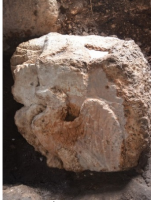
Resim 3. Kutsal Alan İçinde Ele Geçen Kartal Figürü (Foto. Semih Mutlu).