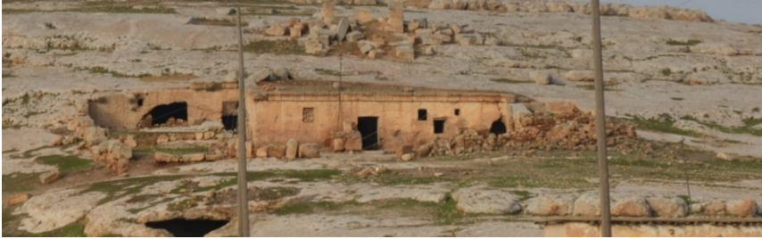
Resim 1. Kartalın bulunduğu kutsal alanın güneyden görünümü (Foto. Semih Mutlu).

Şanlıurfa Büyükşehir Belediyesine, Eyyübiye Belediyesine, Haliliye Belediyesine ve Karaköprü Belediyesine araştırmalarımıza yaptıkları katkılardan dolayı teşekkür ederiz.