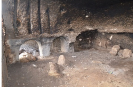
Resim 2. Kutsal Alanın İç Bölümü (Foto. Semih Mutlu).