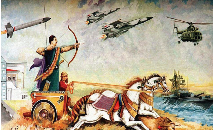
Görsel 3. Kadim ve modern zamanlar arasında varsayılan bağlantıları vurgulayan bir propaganda afişi. 71

konuşmalarında vurgulamaya hayatı boyunca devam etmiştir. Ancak Mezopotamya teması, Araplıktan ziyade Iraklılığı vurguladığı için ve Iraklılık kimliğinin inşasına katkıda bulunacağı düşünülerek rejim tarafından bilhassa desteklediği için önem arz etmektedir. 70