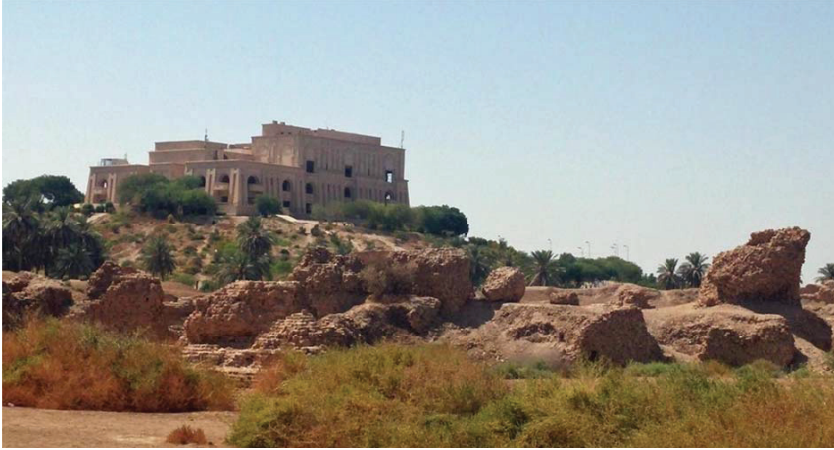
Görsel 2. Sümer tapınağı Ziggurat biçiminde inşa edilen, Saddam Hüseyin'in başkanlık sarayı. 67

Irak-temelli bu kimlik formülünün doktriner anlamda merkezinde ise Mezopotamya miti vardı: kadim Mezopotamya'nın genetik ve kültürel mirası olarak Irak'ı öne çıkarmak. Bu anlayışa göre Sümer ve Akad krallıkları, Irak vatanının birliğinin ilk ifadesini sunmuşlardır. 68 Antik Mezopotamya'nın Iraklılığa topyekûn biçimde entegre edilişi, rejimin ulus-inşa projesinin temelini teşkil etmiştir. Bu projeye, modern Irak ile kadim Mezopotamya arasındaki devamlılığı vurgulayarak Iraklıların kendilerini Mezopotamya halklarının etnik torunları ve kültürel mirasçıları olarak görmesi, bu geçmişleriyle gurur duyması, böylece Iraklılar için Sünni-Şii ve Arap-Kürt ayrımlarını aşan ortak bir tarihin oluşturulması ve Mezopotamya mirasının Arap ailesi içerisinde Irak'ın üstünlüğünü ve emsalsizliğini göstermesi amaçlanmıştır. 69 Bu Mezopotamya teması, rejimin düşüşüne kadar devam eden pan-Arapçı söylemlerde görülebileceği üzere Baas döneminin tek kimlik vurgusu değildi. Nitekim Saddam Hüseyin, pan-Arapçı temaları da