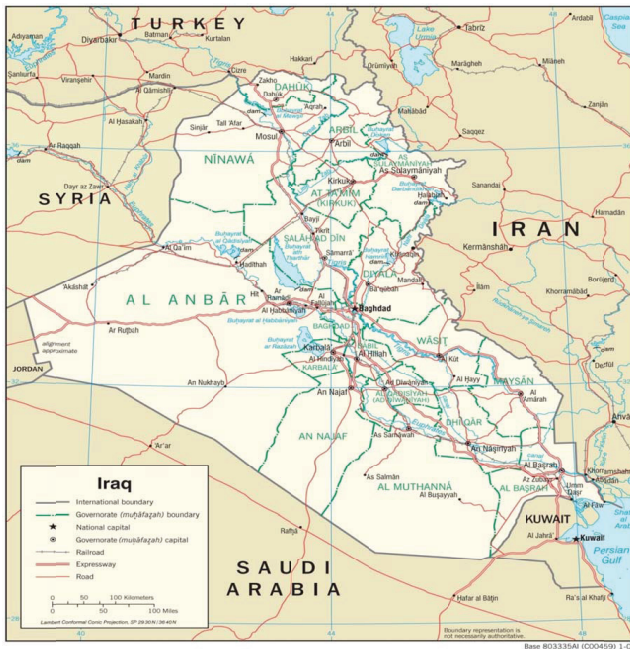
Harita 1. Irak haritası. 19

mik isyanları ideolojik bir yöne çevirmiştir ve isyanlar sırasında Irak'ın bağımsızlığını talep eden sesler yükselmiştir. Vatansızlık ve milliyetçilik kavramları, toplumsal çoğunluğun belirgin bir kavrayışı söz konusu olmasa bile isyan sloganlarının önemli bir parçası haline gelmiştir. 17 Aynı zamanda, toplumdaki kriz birlikteliği, Sünnilerin ve Şiiilerin ileri gelenlerini defalarca bir araya getirmiş ve iki topluluğun toplandığı ritüeller (mesela, Hz. Hüseyin'i anma günleri) de sık sık dayanışma çağrılarında ve siyasî gösterilere dönüşmüştür. 18 Dolayısıyla 1920 isyanları, milliyetçi bir çıkış noktasına sahip değildir, ancak Arap milliyetçiliğinin yanında ve mezhepçiliğin ötesinde Iraklılığın toplumsal ve siyasî anlamda kuruluşunda önemli bir sıçrama noktası olmuştur.