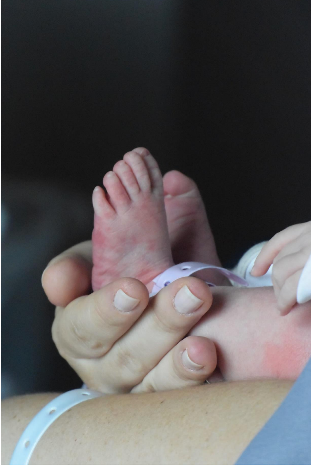
M. A. Akşit Koleksiyonundan