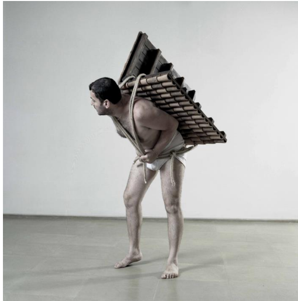
Resim 5. Adrian Paci, “Back to Home” 150x150 cm Renkli Baskı Fotoğraf, 2001

Sanatçının “Back Home” adlı çalışmasında da, Arnavutluk’tan İtalya’ya göç etmiş bir ailenin konu edildiği görülmektedir. Fotoğraf, video ve enstalasyon gibi medyumlardan yararlanılarak 2001 yılında üretilmiştir. Fotoğraflardan oluşan seride, Arnavutluk’tan göç etmiş aileler eski evlerinin içinde şimdiki halleriyle bir röprodüksiyon içindedir. Şu an İtalya’da yaşayan aileler, sanatçıya Arnavutluk’taki eski evlerinin fotoğraflarını çekmesini izin vermiş ve çalışmanın son halini almasını sağlamışlardır. Oluşan röprodüksiyonda, şiirsel etki ve göç kavramının ters yüz edilmesini gösterirken, göçün dramatik etkisini de izleyiciye aktarmaktadır. Çünkü kendi yurtlarında kendilerine atfettikleri değerler bilinci ve birçok özellik yeni değerlerle karışmış, harmanlanmış yeni bir melez oluşum yaratmıştır. Diğer yandan, aynı kişiler artık farklılaşmış, entegrasyonla farklı bir kişiliğe dönmüştür. Eski mekânındaki, evindeki kişiler değildir, kimlikleri de o evdeki eski kimlik değildir. Sanatçı bu iki zıtlığı birleştirerek; yani melez oluşumun üstüne giderek, izleyiciye yeni-eski kimlikler arasındaki çatışmayı aktarmaktadır.