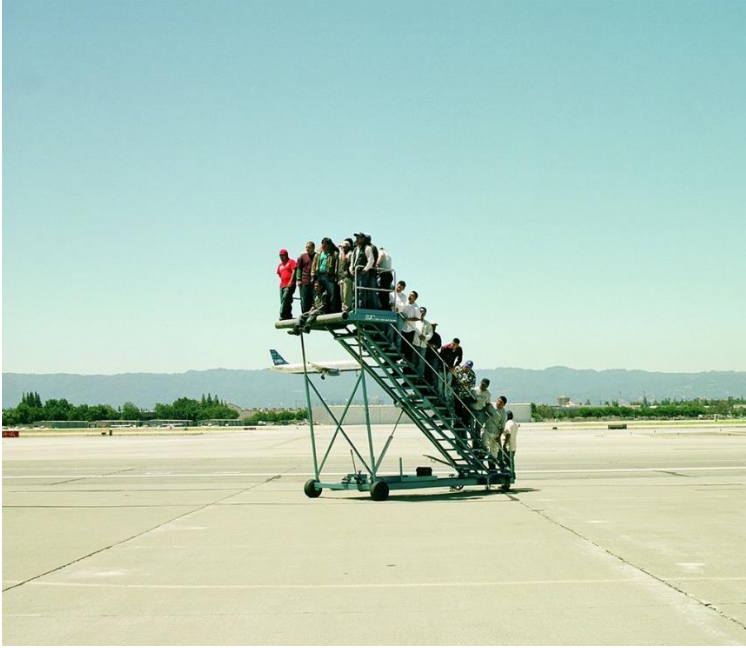
Resim 1. Adrian Paci, “Centro di Permanenza Temporea” Video, 2007