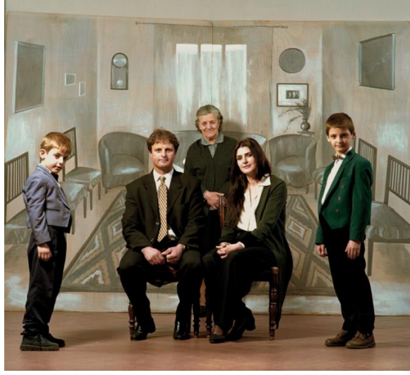
Resim 4. Adrian Paci, “Back Home” 110x 120 cm Renkli Fotoğraf Baskı 2001

Sanatçının “Back Home” adlı çalışmasında da, Arnavutluk’tan İtalya’ya göç etmiş bir ailenin konu edildiği görülmektedir. Fotoğraf, video ve enstalasyon gibi medyumlardan yararlanılarak 2001 yılında üretilmiştir. Fotoğraflardan oluşan seride, Arnavutluk’tan göç etmiş aileler eski evlerinin içinde şimdiki halleriyle bir röprodüksiyon içindedir. Şu an İtalya’da yaşayan aileler, sanatçıya Arnavutluk’taki eski evlerinin fotoğraflarını çekmesini izin vermiş ve çalışmanın son halini almasını sağlamışlardır. Oluşan röprodüksiyonda, şiirsel etki ve göç kavramının ters yüz edilmesini gösterirken, göçün dramatik etkisini de izleyiciye aktarmaktadır. Çünkü kendi yurtlarında kendilerine atfettikleri değerler bilinci ve birçok özellik yeni değerlerle karışmış, harmanlanmış yeni bir melez oluşum yaratmıştır. Diğer yandan, aynı kişiler artık farklılaşmış, entegrasyonla farklı bir kişiliğe dönmüştür. Eski mekânındaki, evindeki kişiler değildir, kimlikleri de o evdeki eski kimlik değildir. Sanatçı bu iki zıtlığı birleştirerek; yani melez oluşumun üstüne giderek, izleyiciye yeni-eski kimlikler arasındaki çatışmayı aktarmaktadır.