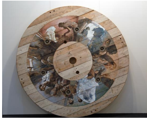
Resim 8. Adrian Paci, “Wedding” 220 cm, Ahşap Üzerine Boya, 2001

Düğünler, genellikle tüm ailenin ve dostların bir arada olduğu, şenlikli törenlerdir ve bu törenler çoğunlukla çeşitli kültürel öğeler, seremoniler barındırmaktadır. Sanatçının ele aldığı bu konu aynı ismi taşımaktadır. “Düğün” adlı çalışmada, ahşap bir dairenin üzerine sosyalist gerçekçi resimlerle bir aile portresi çizmektedir sanatçı. Mutlu, kalabalık bir aile düğününün resmedildiği ahşap, bir tür belge şeklinde bize ulaşmaktadır. Oradan ayrıлып, yeni yaşam alanında büyük, kalabalık bir aile eksikliği, yine sıla hasreti ve kültürel ritüellere gönderme barındırmaktadır. Arnavutluk’un sosyalist rejimden sonra yaşadığı geçiş sürecine rağmen, sanatçının ve onun gibi göç edenlerin anıları dönüşüme uğramamıştır. Bellek kavramının bir göçmen olarak ne şekilde esere yansıdığı ve izleyiciye aktarıldığı görülmektedir.