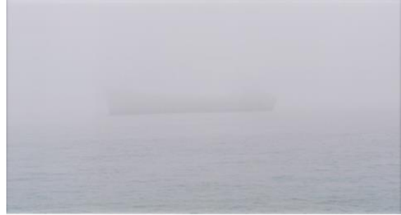
Resim 3. Adrian Paci, “Column”, Video, 2013.