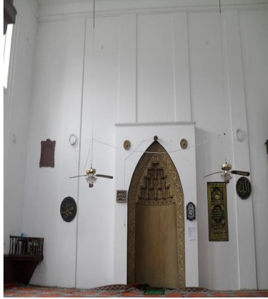
Fot.11. Hayriye Camii hariminde muhafaza dolabı