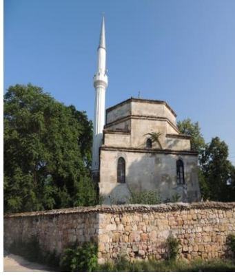
Fot.1. Kozluca'da Amca Hasan Ağa Camii