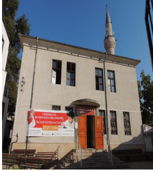
Fot.3. Kırcaali Camii