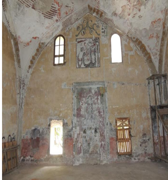
Fot.14. Karloğlu Ali Bey Camii kible duvarı ve boş muhafaza nişi