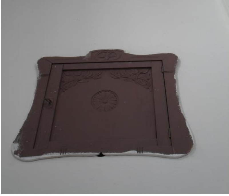
Fot.12. Hayriye Camii muhafaza dolabı kapağında detay