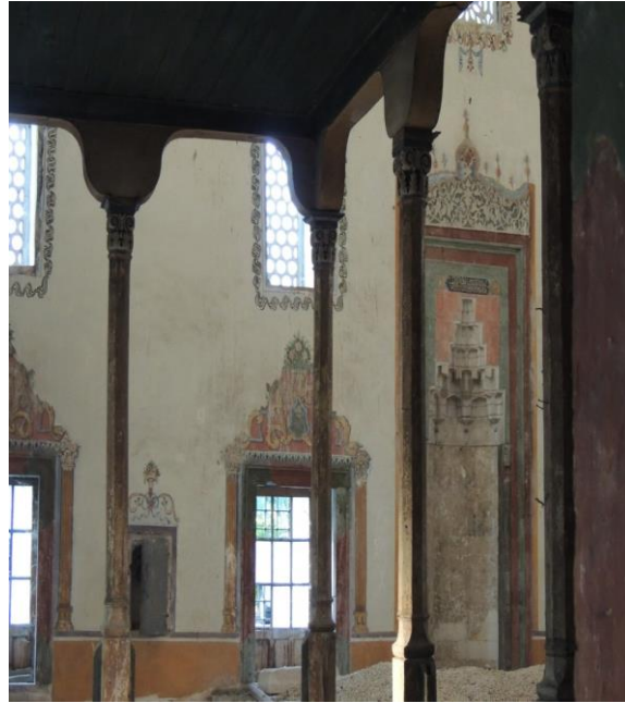
Fot.16. İbrahim Paşa Camii kible duvarında bezemeli sakal-ı şerif nişi