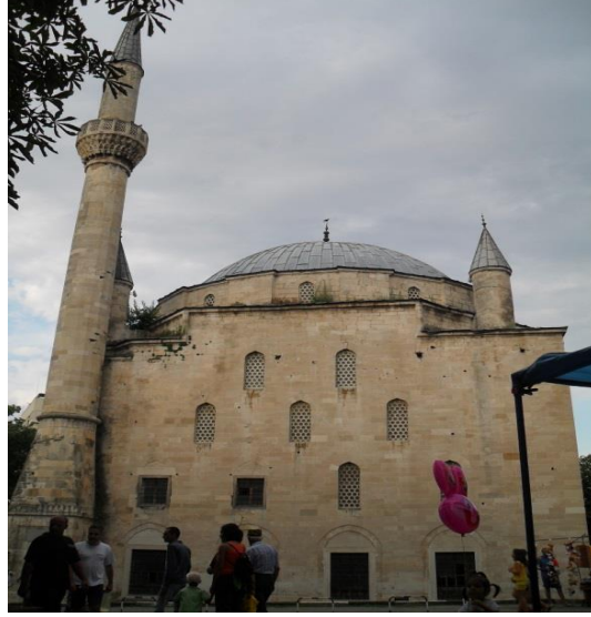
Fot.15. Hezargrad'da İbrahim Paşa Camii