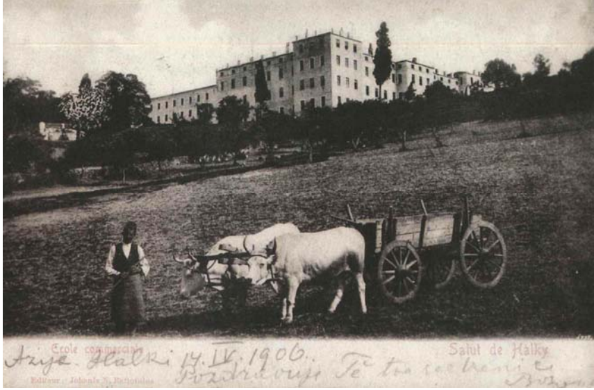
Resim 5: 14 Nisan 1906 Tarihli Bir Kartpostalda Heybeliada Rum Ticaret Mektebi