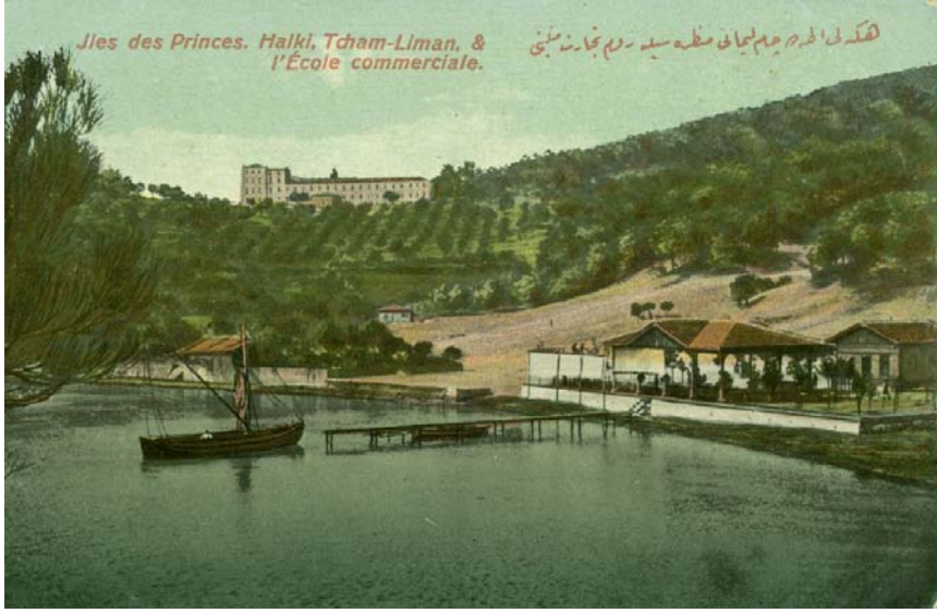
Resim 1: Heybeliada Çam Limanı'ndan Rum Ticaret Mektebi'nin Görünüşü