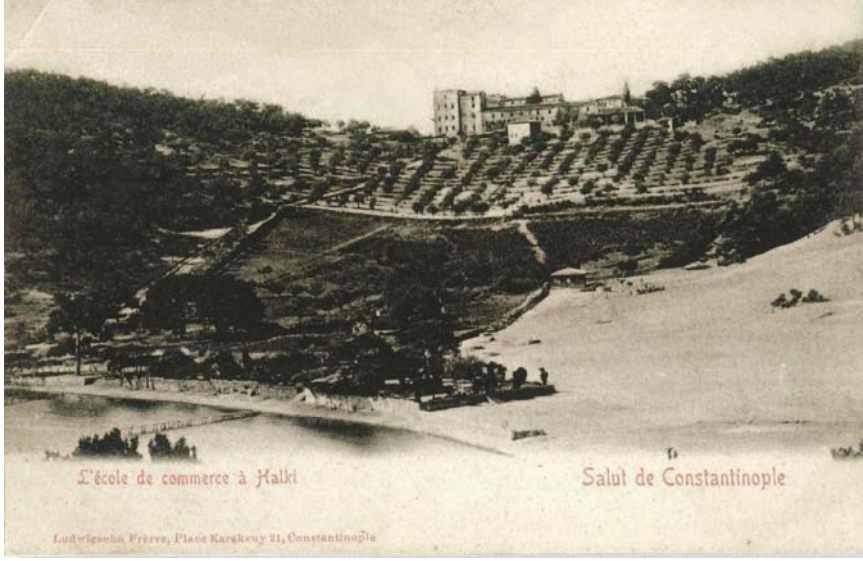
Resim 6: Heybeliada Rum Ticaret Mektebi ve Çam Limanı