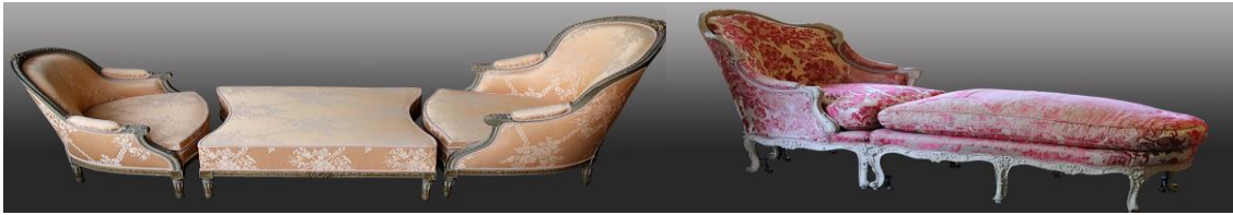
Şekil 3. Duchesse brisee kanepesi

Duchesse Brisée olarak adlandırılan şezlong formulu oturma elemanı ise, iki veya daha fazla ayrı parçanın bir araya getirilerek biçimlenen örnekler verilen addır. Bu biçimlenişte, sırtlığı ve kolçakları olan bir koltuğun ucuna bir veya iki parçanın eklenerek uzanma koltuğu formuna dönüşmesi söz konusudur (Şekil 3). Zarafet olgusunun hâkim olduğu XV. Louis döneminde, var olan birçok mobilyanın yeniden yorumlanmasının ürünlerinden biri olan bu mobilya da doğrudan kadın kullanıcılara yönelik tasarlanmıştır (URL 3).