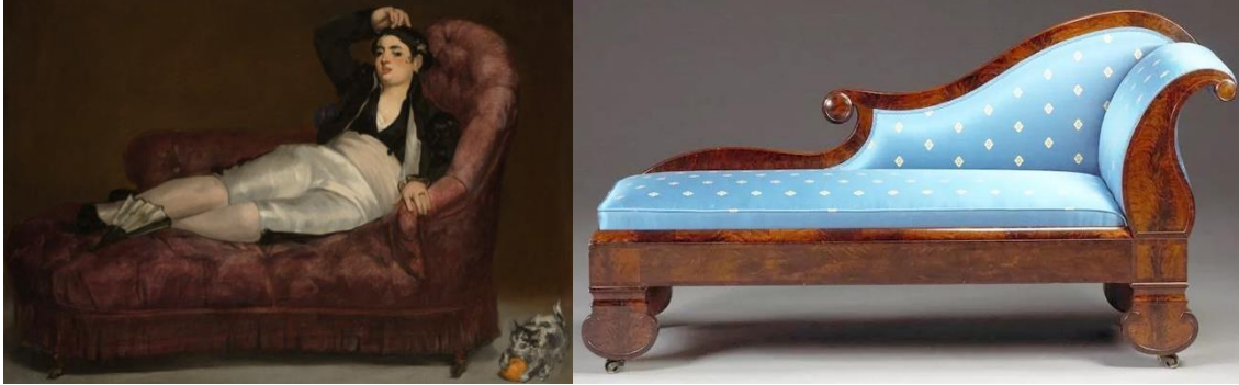
Şekil 2. Meridienne Kanepe

kullanıma alanına sahiptir. Meridienne adının ise güneşin meridyene yakın olduğu gün ortasında dinlenme amacına hizmet etmesinden geldiği bilinmektedir (URL 1).