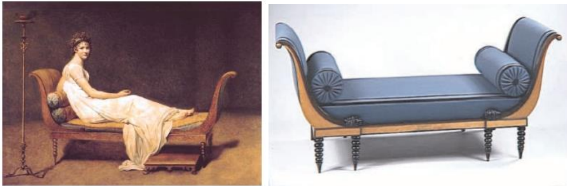
Şekil 1. Madame Recamier, Jacques Louis David, 1800 ve Recamier Şezlong