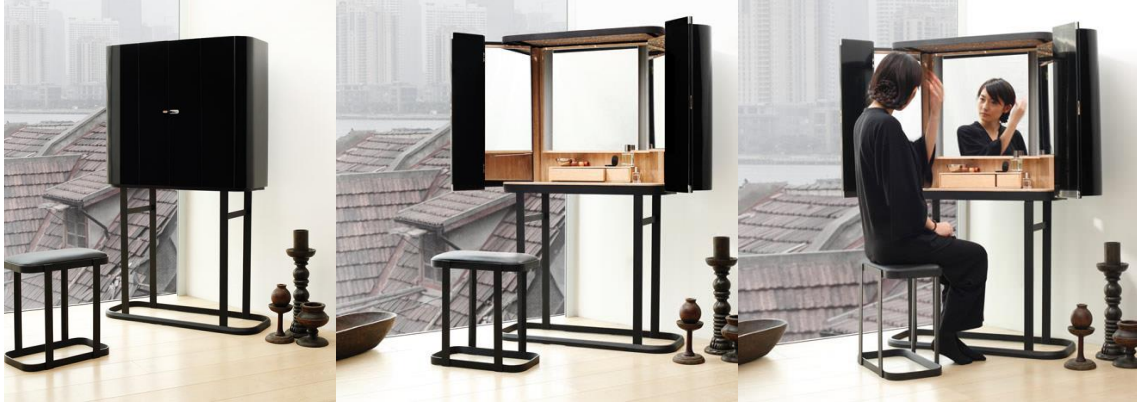
Şekil 6. Modern bir tuvalet masası örneği