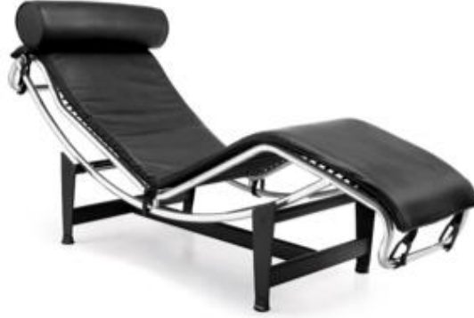
Şekil 4. Le Corbusier'in ‘dinlenme makinesi

bağdaşan mobilyalara örnek olarak “baba koltuğu”, “emzirme koltuğu” gibi işlevsel ve fiziksel anlamda doğrudan kullanıcıya yönelik biçimlendirilen mobilyalar verilebilir.