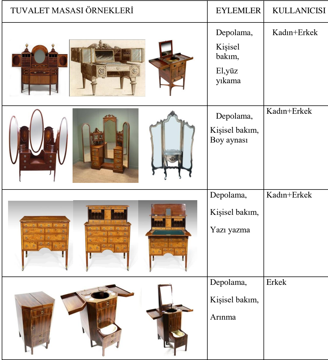
Tablo 2. Farklı eylemler barındıran tuvalet masaları

“Gentleman’s Dressing Table” (Bayların tuvalet masası) olarak üretilen bu mobilya; depolama, el, yüz yıkama ve bide görevi üstlenen kişisel temizlik eylemlerini barındırmaktadır. Yine kullanım şekline göre farklı görüntüler oluşturabilmektedir. Bu örneği, diğer tuvalet masalarından farklı kılan en önemli özelliklerden biri, el, yüz yıkama gibi kişisel temizlik eylemlerine ek olarak daha özel bir temizlik ihtiyacına yönelik bir üniteye de sahip olmasıdır. Bu durum, mahremiyet olgusunu da beraberinde getirmektedir. Diğer tuvalet masalarında yapılan eylemler için böyle bir durum söz konusu değilken bu mobilyada kullanım esnasında mahrem bir alana ihtiyaç duyulacağını söylemek mümkündür. Mobilyanın öne çıkan bir başka farklı özelliği ise, adından da anlaşılacağı üzere, doğrudan “erkek”lerin kullanımına yönelik tasarlanmış olmasıdır. Bu mobilya, açıkça bir cinsiyetleşmenin görüldüğü örneklerden biri olarak değerlendirilebilir.