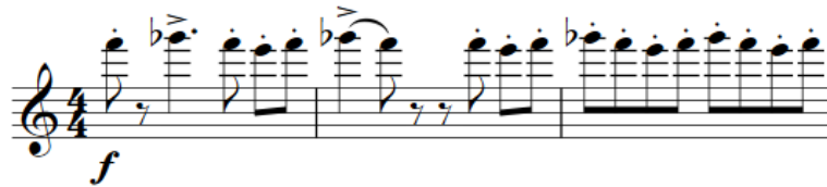
Şekil 26. F. Poulenc Klarnet ve Piyano için Sonat, 26-28. ölçüler arası Kaynak: (Poulenc, 1963: 6-7)

Bölümde 26. ila 28. ölçüler arası 3. oktav seslerin en yoğun kullanıldığı yerlerden biridir (Şekil 26). Bu kısımda aksan, staccato ve legato artikülasyonları kullanılmıştır. Bu artikülasyonlar gözden kaçırılmamalı ve özenle icra edilmelidir. Klarnetin üçüncü oktav seslerinde her oktavdaki seslerde yapıldığı gibi çene, dudak, dil ve diyafram nefesi kontrolü sağlanmalı ve ton renginin bozulmamasına dikkat edilmelidir.