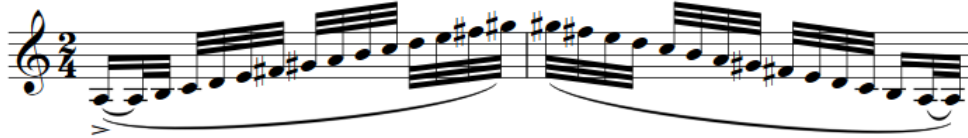
Şekil 20. F. Poulenc Klarnet ve Piyano için Sonat, 19. ölçü, 4. çalışma şekli

31. ölçüden itibaren piyano ve klarnet arasındaki soru-cevap ilişkisi gözden kaçırılmamalı ve nüanslar özenle icra edilmelidir. İlk olarak 31. ila 32. ölçülerde piyano 2 ölçülük solosunu duyurmaktadır. Piyanonun ardından klarnet ona cevap vermektedir (Şekil 21). Piyano solosunun ilk ölçüsünde 4'lük değerinde, klarnet solosunun ilk ölçüsünde ise 8'lik değerinde notalar vardır. Piyano ve klarnetin 2. ölçülerinde 2 noktalı sekizlik ve 2 tane 64'lük nota bulunmaktadır. Klarnet ve piyano arasında bu soru-cevap ilişkisi 41. ila 44. ölçüler arasında ve 55. ila 58. ölçüler arasında da devam etmektedir. Nüans olarak bakıldığında ilk soloyu piyano pianissimo nüansı ile, klarnet ise mezzoforte nüansı ile icra etmektedir. 2. soloda her iki entrümanda da mezzoforte nüansı kullanılmıştır. 3. soloyu ise piyano pianissimo nüansı ile, klarnet ise piano nüansı ile icra etmektedir. Bu kısımda piyano ve klarnetin birbirini dinleyerek ve her ikisinin de 2. ölçülerinde gelen nota değerlerini yazıldığı gibi, aksatmadan icra etmeleri bölümün müzikal bütünlüğünün sağlanması açısından önemlidir.