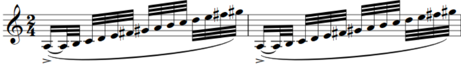
Şekil 19. F. Poulenc Klarnet ve Piyano için Sonat, 19. ölçü, 3. çalışma şekli