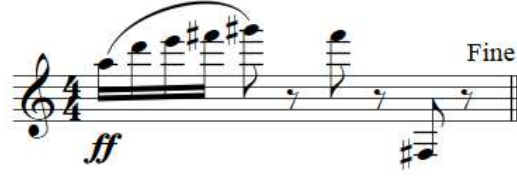
Şekil 27. F. Poulenc Klarnet ve Piyano için Sonat, 128. ölçü (son ölçü) Kaynak: (Poulenc, 1963: 8)

Bölümün son ölçüsünde de 3. oktav sesleri yoğun kullanılmıştır. Ancak bölüm klarnetin en alt oktavındaki fa diyez sesiyle sona ermektedir (Şekil 27).