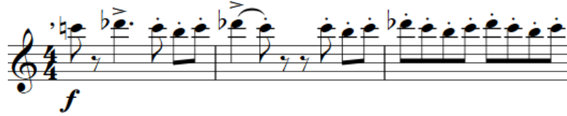
Şekil 25. F. Poulenc Klarnet ve Piyano için Sonat, 18-20. ölçüler arası Kaynak: (Poulenc, 1963: 6)

Bölümün 18. ila 20. (Şekil 25), 26. ila 28. ve 83. ila 85. ölçülerinde özellikle aksan ve staccato artikülasyonları gözden kaçırılmamalı ve bu kısımlar özenle icra edilmelidir. Sadece bu kısımda değil eserin bütün bölümlerinde müzikal karakterin ortaya çıkması açısından artikülasyonların ve nüansların önemi büyüktür. Ayrıca eserin her bölümü ritmik bir şekilde icra edilmeli ve tempo aksatılmamalıdır.