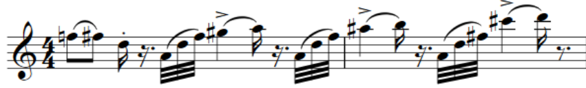
Şekil 22. F. Poulenc Klarnet ve Piyano için Sonat, 3-4. ölçüler arası Kaynak: (Poulenc, 1963: 6)