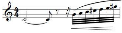
Şekil 8. F. Poulenc Klarnet ve Piyano için Sonat, 22. ölçü