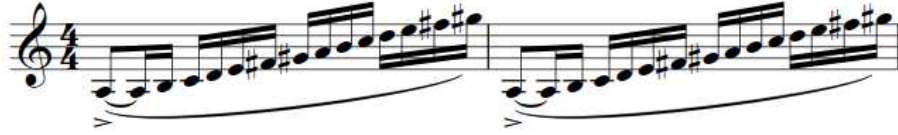
Şekil 17. F. Poulenc Klarnet ve Piyano için Sonat, 19. ölçü, 1. çalışma şekli