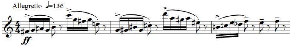
Şekil 1. F. Poulenc Klarnet ve Piyano için Sonat, 1-3. ölçüler arası

1. ila 3. ölçüler arasında (Şekil 1) 16'lık nota değerinde 4'lü nota grupları vardır. Her 4'lü nota grubunun ilk notasında aksan artikülasyonu kullanılmıştır. Bu artikülasyon icra edilirken atik ve çevik olunmalı, tempo aksatılmamalı ve piyano ile olan birliktelik göz ardı edilmemelidir. Aynı artikülasyon 11., 41., 42. ve 109. ölçülerin ilk notalarında da kullanılmıştır, bu ölçülerde dikkatle icra edilmelidir.