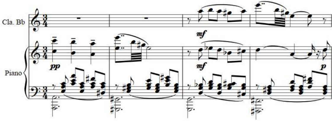
Şekil 21. F. Poulenc Klarnet ve Piyano için Sonat, 31-34. ölçüler