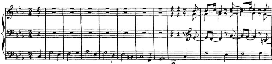
Örnek 5: J.S. Bach, Passacaglia ve Füg