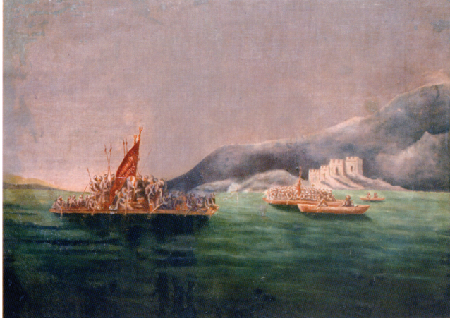
Resim 3- Halim Bey, “Şehzade Süleyman’ın Rumeli’ye Geçişi”, tuval üzerine yağlıboya, 87 x 116 cm, İstanbul Deniz Müzesi Resim Koleksiyonu, DB:522 ( İstanbul Deniz Müzesi Resim Koleksiyonu , s.79. )

İstanbul Deniz Müzesi Resim Koleksiyonu’ndaki “Şehzade Süleyman’ın Rumeli’ye Geçişi” adlı tablonun, Hasan Rıza’nın Askeri Müze Koleksiyonu’ndaki tablosuyla benzerliği dikkate alındığında; Yetik, Boyar ve İslimyeli’nin bilgi verdiği ressam Halim’in Edirne’de Hasan Rıza ile tanıştığı, feyz aldığı ve hatta birlikte sergi açtıkları bilgisinden de hareketle resmin Yetik, Boyar ve İslimyeli’nin bilgi verdikleri ressam Halim tarafından yapılmış olduğu düşünülebilir.