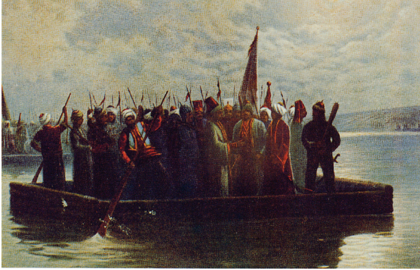
Resim 5- Nazmi Ziya, “Salla Geçiş”, 13 x 18 cm. ( Nazmi Ziya , s.114.)

Nazmi Ziya'nın, Türk tarihinden kahramanlık içeren resimler kapsamında “Salla Geçiş” resmini, bu kapsamda yapmış olması da muhtemeldir. Eseri, Halid Naci'nin Milli Saraylar Koleksiyonu'ndaki yağlıboya tablosunun adeta kopyası gibidir. Ancak, Nazmi Ziya'ya atfedilen resimde, çok küçük ayrıntılarla değişikliğe gidilmiştir. Özellikle, soldaki figürlerde, duruşlar aynı olmakla birlikte, başta sol kısımda arkası dönük olarak kürek çeken figürün yanında duran figürün kıyafetinde ve başlığında olduğu gibi özellikle baş ve başlıklarda küçük farklılıklar yaratmıştır.