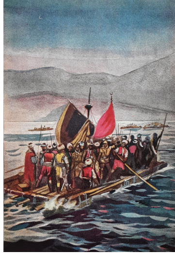
Resim 9- “Orhan devrinde Osmanlıların sallarla Rumeli’ye geçişleri”, (Mufassal Osmanlı Tarihi Tablosu No.3). (Resimli - Haritalı Mufassal Osmanlı Tarihi, s.80.)

Resimdeki renkler, deniz, denizdeki dalgalar, sal ve üzerindeki figürler genel olarak Münif Fehim’in tarzına uygundur. Ancak, kitapta Münif Fehim’e ait olan resimlerin altlarında açıklama olarak sanatçının adı belirtilmiştir. Bu resimde ise “(Mufassal Osmanlı Tarihi Tablosu No.3)” açıklaması verilmiştir. Kitapta, benzer nitelikte renkli resimler vardır ve altlarına sanatçı adı belirtilmeden numara değişmek kaydıyla bu açıklama ile yetinilmiştir. Münif Fehim, İskit Yayınevi için çok sayıda resim, illüstrasyon, kapak tasarımı hazırlamıştır ve bunlar gerek kitaplarda gerekse ansiklopedi ve dergilerde yayımlanmıştır. İskit Yayınevi tarafından Ocak 1950’de ilk sayısı yayımlanan Server R. İskit’in haftalık Resimli Tarih Mecmuası ’nın kapak sayfalarında Münif Fehim’in renkli ve iç sayfalarında ise siyah beyaz resimleri vardır. Sanatçının dergideki yazılara görsel açıdan değer katan gerek tablo niteliğinde, gerekse illüstratif nitelikte hamasî olarak özellikle Türk tarihinden önemli kişilikler, olaylar, savaş, kahramanlık ve zafer temalı suluboya, guaj çalışmaları yer almıştır. Resimli - Haritalı Mufassal Osmanlı Tarihi de 1957 yılında, İskit Yayınevi tarafından yayımlanmıştır.