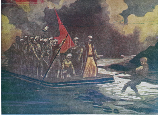
Resim 6- Münif Fehim, “Rumeliye Geçiş”. (Resimli Yirminci Asır / Yirminci 20. Asır, C.1, S.9, 11 Ekim 1952, arka kapak.)