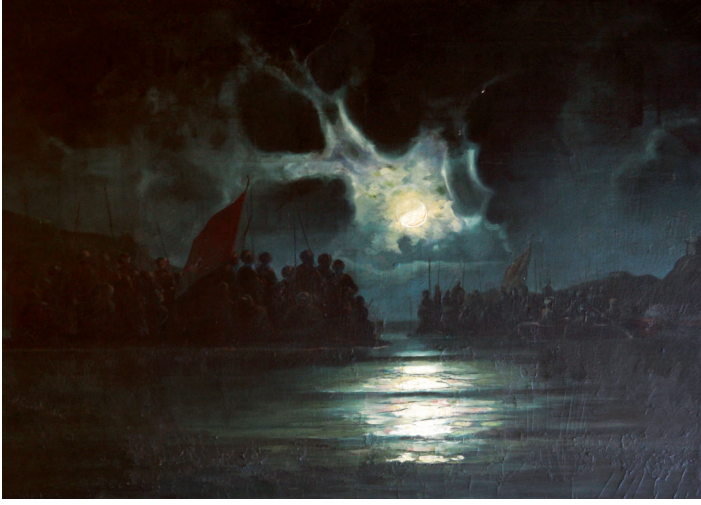
Resim 2- Hasan Rıza, “Osmanlıların Rumeli’ye Geçişi, 1321/1905, tuval üzerine yağlıboya, 102 x 148 cm, Edirne Belediyesi Resim Koleksiyonu.