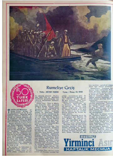
Resim 7- Münif Fehim, “Rumeliye Geçiş”. (Resimli Yirminci Asır / Yirminci 20. Asır, C.1, S.9, 11 Ekim 1952, arka kapak.)

Münif Fehim’in ikinci resmi de ilkinе benzemekle birlikte, burada denizde küreklerle çekilerek ilerleyen sal ve üzerinde yine kalabalık figürler vardır. Önceki resimde olduğu gibi sağ geride ikinci sal belirir ve geri planda açık bulutlu gökyüzü ile kompozisyon sonlanır. Bu resim, önceki resme göre daha aydınlıktır. İlk resim yatay gelişirken, burada dergi kapağı tasarımına uygun olarak dikey kompozisyonlu kurgulanmıştır. Münif Fehim, özellikle tarihi konulu resimleriyle döneminde yayımlanan tarih dergileri ve kitaplarının en popüler ismi olmuştur. Dergiler, kitaplar için kapaklar,