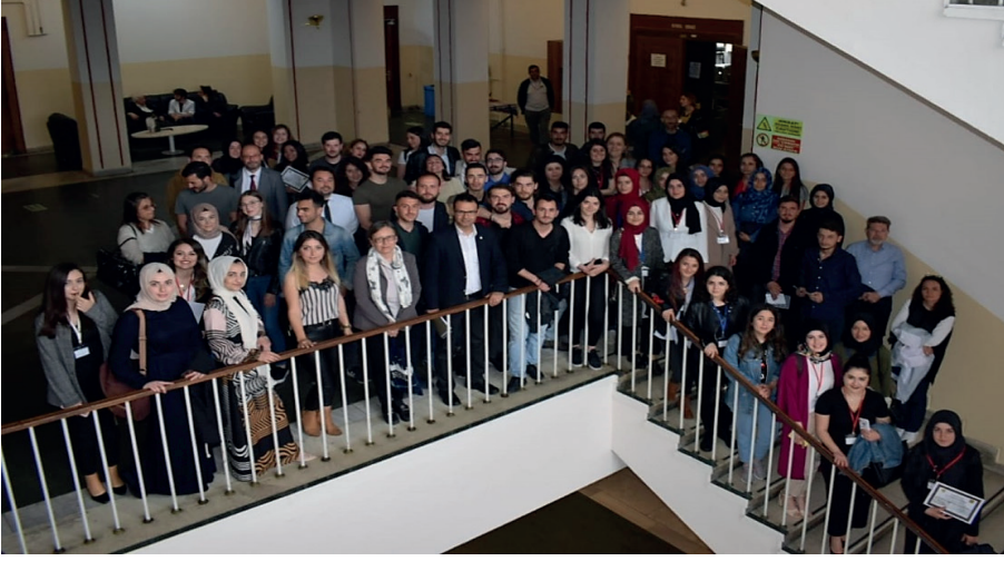
Istanbul Üniversitesi Edebiyat Fakültesi Bilim Tarihi Bölümü V. Öğrenci Kongresi katılımcıları.