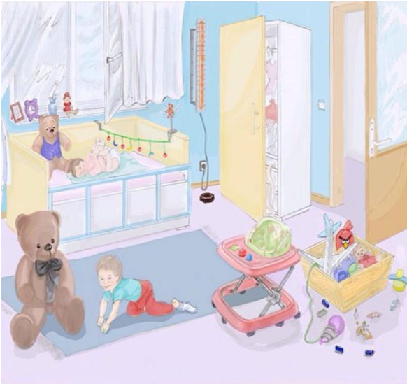
Resim 3. Çocuk Odası