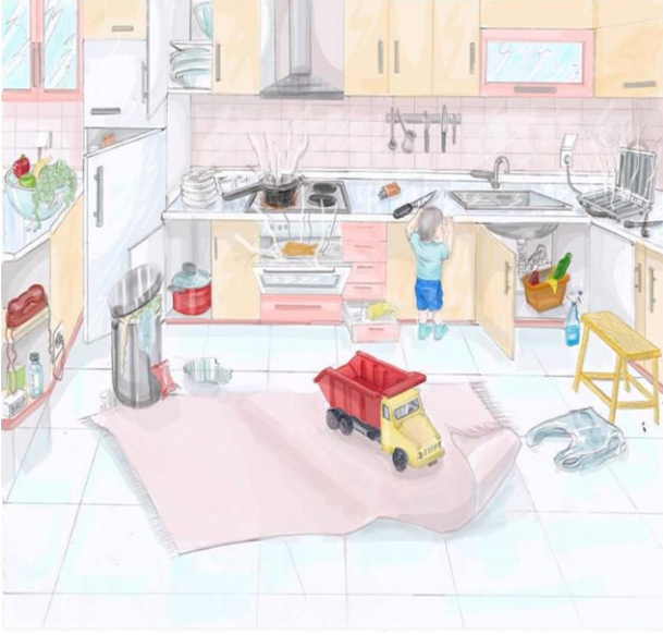
Resim 1. Mutfak