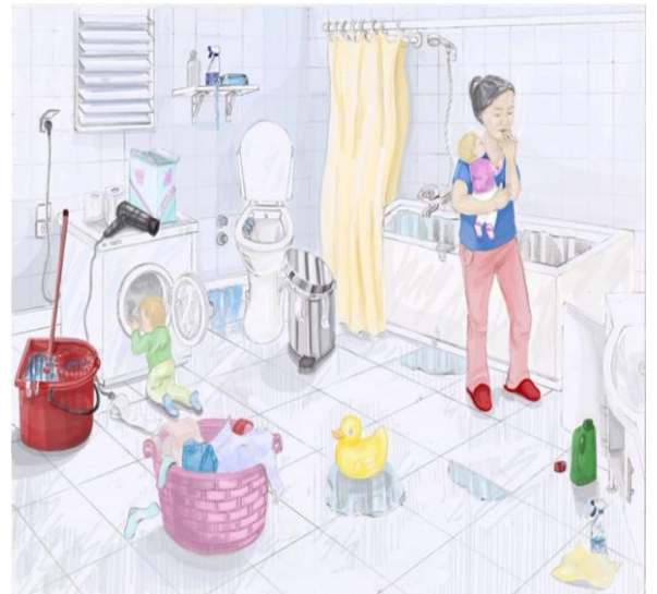
Resim 4. Banyo/Tuvalet