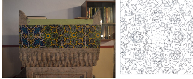
Görsel 8, Çizim 6. Vaaz kürsüsü korkuluğu çinileri ve detay çizimi.

Hama sütunları üzerindeki mermer levhanın meydana getirdiği kürsünün korkuluklarında yer alan bir sıra çinide minber ve vaaz kürsüsündeki çinilerin deseninin aynı görülmektedir.