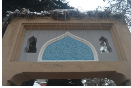
Görsel 1. Caminin bahçe kapısı üzerinde bulunan sivri kemerli kitabe.