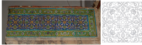
Görsel 12,Çizim 9. Müezzin mahfil korkuluk çinileri ve detay çizimi.

2.03x4.08 m. boyutlarında üç kaş kemer üzerine oturan müezzin mahfilinin korkuluklarındaki ulama tarzındaki çinilerde, sekiz kollu beyaz yıldızın dört ucunda beyaz hurdeleri rumîler, dört ucunda tepelikler bulunur (Görsel 12, Çizim 9). Bunun ortasındaki sarı pençten çıkan dört kollu yıldızın uçlarından gelişen hatâyîler, rumîlerin arasındaki boşlukları doldurmaktadır. Desenin zemini kobalt, kapalı formların içi yeşille boyanmıştır. Çiçeklerin içinde küçük sır üstü kırmızı uygulamaları görülür. Bu çiniler, 26.5x26.5 cm. boyutlarındadır. Bordür desenini tepeliklerden çıkan hurdeleri rumîler ve bunların arasından dolaşan hatâyîler oluşturur. Bordür zemini yeşildir.