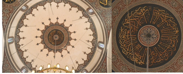
Görsel 15,16. Cami ana kubbe kalemîşi süslemeleri ve göbek yazısı

“Ey inananlar! Cuma günü namaz için ezan okunduğu zaman Allah’ı anmaya koşun; alım satımı bırakın ; bilerseniz , bu sizin için daha iyidir.” (mealler.org).