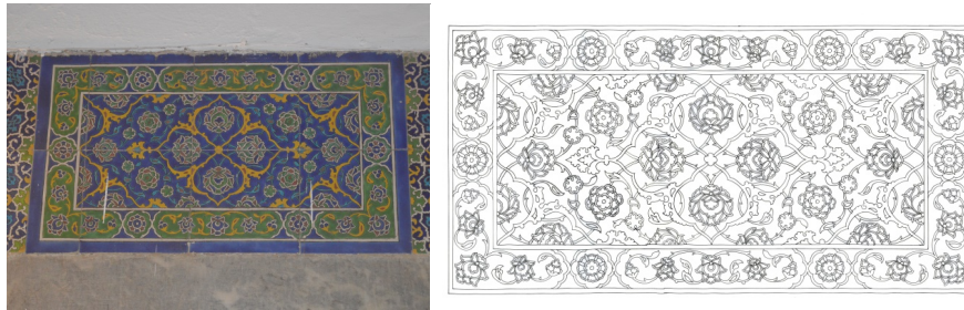
Görsel 7, Çizim 5. Mihrap duvarı sol pencere alınlığı ve detay çizimi.

Mihrabın sol tarafında bulunan panonun ortasındaki dikdörtgen alınlığın deseninde merkezde dörtlü kapalı form şeklinde rumî ve köşelerinde bunun çeyrekleri konulmuştur (Görsel 7, Çizim 5). Rumî kapalı formların boşlukları turkuaz dallarla birbirine bağlanan hatâyî üslubunda çiçek motifleriyle bezenmiştir. Bu alanın etrafını kartuş paftalarına ayrılmış elma yeşili zeminli bir bordür çevreler. Bordürün desenini hatâyîler oluşturur. Bordürün dışında turkuaz bir bant vardır. Bunun dışında kalan kare alanın ulama tarzındaki deseninde ortadaki rozetin uçlarından çıkan beyaz kartuş çizgileri birbirine bağlanarak artı şeklinde formlar oluşturulmuştur. Bunların arasında oluşan madalyonların içinde kobalt zemin üzerine turkuaz rûmîlerden oluşan desen görülür.