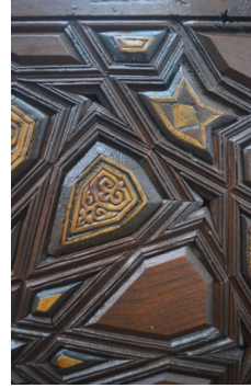
Görsel 19,20. Cami ahşap pencere kapaklarının kündekârî bezemeleri.