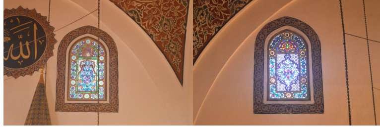
Görsel 17,18 . Caminin alçı vitraylı kafa pencereleri.

Bunların altında ise mihraplı bir pano düzeni içerisinde Kara Memi üslubunda yarı stilize motiflerden oluşan kompozisyon ve diğer pencerelerde de hem geometrik hem de bitkisel motiflerle bezenmiş desen şemaları görülür (Görsel 18).