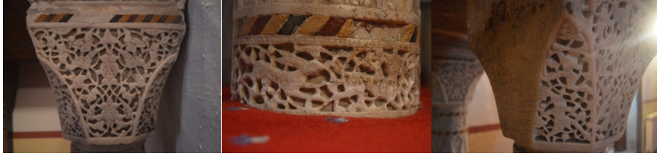
Görsel 2,3,4.Hama sütunları süsleme detayları.

Caminin en ilgi çekici süslemesi, güney doğu köşesinde bulunan dört zarif sütun üzerine oturan kürsüdür. Sütunların kasnak kitabesindeki yazılarda adı geçen şahıs Hama Eyyûbileri'nden II. Muzaffer Eyyûbi (1229-1244) yahut aynı adı taşıyan III. Muzaffer (1284-1298) olmalıdır. Tarih verilmediğinden eserin hangi sultana ait olduğu kesinlik kazanmamıştır. Boyları 1.60 m. olan dört sütun, üzerine mermer bir levha konularak kürsü haline getirilmiştir. Sütunların gövdeleri zikzak yivlerle süslenmiştir. Yukarıya doğru genişleyen sütun başlıklarının köşeleri pahlanarak üçgen formu verilmiştir. Yalnız iki yan yüzü işlenen mermer başlıklar, insan ve çeşitli hayvan figürlerinin yer aldığı rumî üslubunda motiflerle dantel gibi bezenmiştir (Görsel 2, Çizim 1). Sütunların zemine basan kısımlarında da on santim kalınlıkta bantlar halinde kıvrım dallar üzerinde çeşitli hayvan figürleri işlenmiştir (Görsel 3). Sütun başlıklarının köşe üçgenlerinde üzüm asmalarının kıvrım dalları arasında ellerinde sepetle üzüm toplayan iki figür bulunur (Görsel 4, Çizim 2).