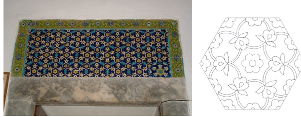
Görsel 6, Çizim 4. Harim kısmı doğu duvarı pencere alınlığı ve detay çizimi.

yeşil zemin üzerinde, sarı dallarla birbirine bağlanan hatâyî üslubunda çiçeklerden kompoze edilmiş bordür çevreler.