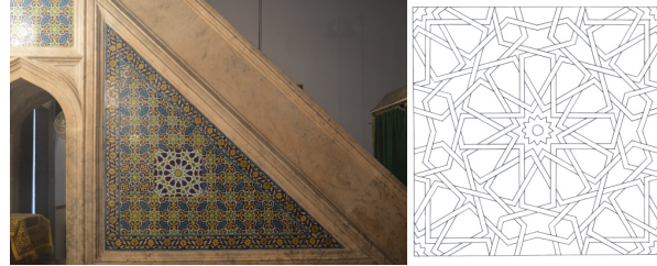
Görsel9, Çizim7. Minber yan alınlığı çinileri ve detay çizimi.

Minberin yan alınıklarının sol tarafının merkezinde, 33.5x33.5 cm. ebadında oniki kollu yıldızdan gelişen geometrik bir desen göze çarpar (Görsel 9, Çizim 7). Bu desen, yapıdaki pencere kanatlarında bulunan kündekarfî işçiliğindeki yıldızlarla bütünlük oluşturmaktadır.