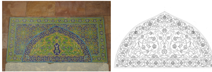
Görsel 5, Çizim 3. Son cemaat yeri pencere alınlığı ve detay çizimi.

Son cemaat yerinde portalin iki yanındaki pencerelerin üzerinde 70x170 cm. ölçüsünde, ortasında sivri kemerli bir alan bulunan dikdörtgen formunda simetrik çini alınlıklar yer alır (Görsel 5, Çizim 3). Ortadaki sivri kemerli kısmı, içinde çin bulutları ve hatâyî üslubunda çiçeklerden oluşan bir bordür çevreler. Bordür karoları 12x27 cm. ebatlarındadır. Dikdörtgen panonun bordüründe ise, yeşil zemin üzerinde sarı renkte kapalı form şeklinde hurdeli rumîler ve bunların ortasında beyaz saplarla birbirine bağlanan hurdeli tepeliklerden oluşan bordür yer alır. Bordür karolarının ölçüleri 13.5x27 cm.'dir. Ortadaki kemer içinde deseni, yeşil zemin üzerinde sarı renkte hurdeli rumîlerden oluşan ayırma bir kompozisyon ve bunların arasından kıvrım dallarla dolanan hatâyî tarzı çiçekler oluşturur. Sivri kemerli alınlığı oluşturan çinilerin boyutu 27x27 cm.'dir.