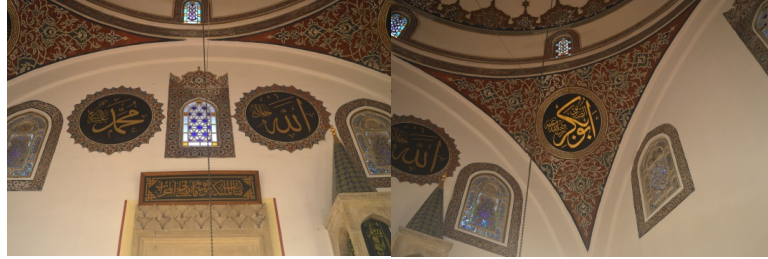
Görsel 13,14. Mihrap duvarı ve pandantiflerdeki kalemîşi süslemeler ve madalyonlar

Harim kısmının kible ve kuzey yönündeki duvarlarda beş adet yazılı madalyon ve bunların etrafını süsleyen kalem işleri görülür. Mihrabın sağ üstünde yer alan madalyonda celi sülüs tarzında hat yazısı ile, siyah zemin üzerine altın yıldızla “Allah (c.c.)”, soldakinde “Muhammed (a.s.)” yazmaktadır (Görsel 13). Bu madalyonların ortasında ve iki yanında yer alan nakışlı pencerelerin etrafı da kalem işleriyle bezelidir. Kuzey duvarındaki üç madalyondan ortadakinde “Ya Hazret-i Bilal-i Habeşî (r.a.)”, sağdakinde “Hüseyin (r.a.)”, soldakinde “Hasan (r.a.)” yazmaktadır. Madalyonların sağında ve solunda bulunan kör pencerelerin içleri ve çevreleri kalem işleriyle süslüdür. Pandantiflerin ortasında yer alan madalyonlarda ise dört halifenin adı yer almaktadır (Görsel 14).