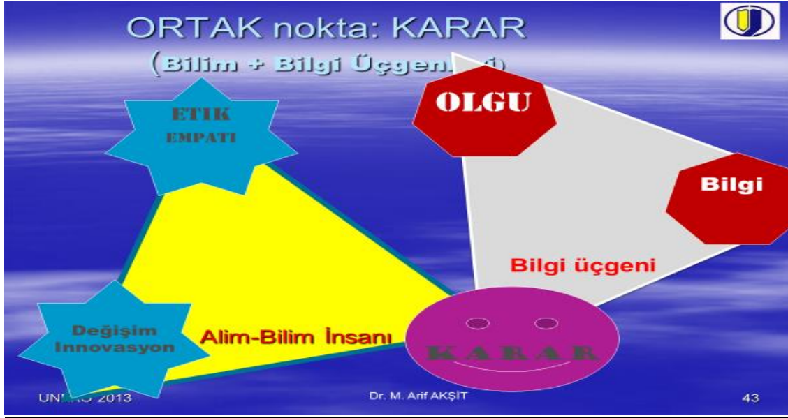
Şekil 10-3: Karar Alma: bilgi ile bilim üçgeni bütünleşmesi; innovasyon