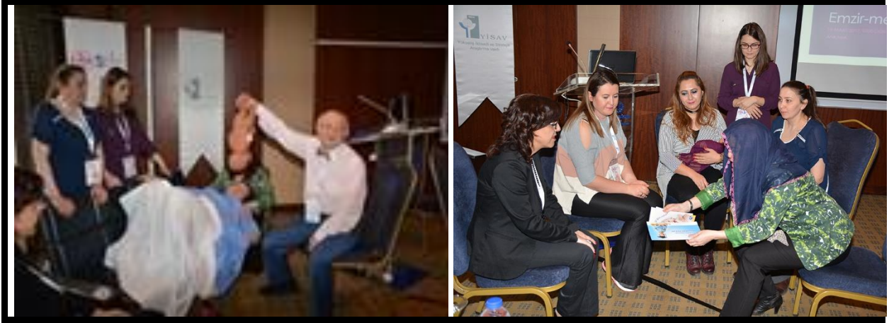
Şekil 10-2: İlk 1000 gün kapsamında Dramdan sahneler, a) Doğum, b) Emzirme değerlendirmesi yapan ekip ( www.annecocukbeslenmesi.org )

a) Doğum Eylemi: Doğumdan sonra bebeğin hangi yükseklikte tutulması gerektiği sorgusu ve takiben anneye ten tene temas