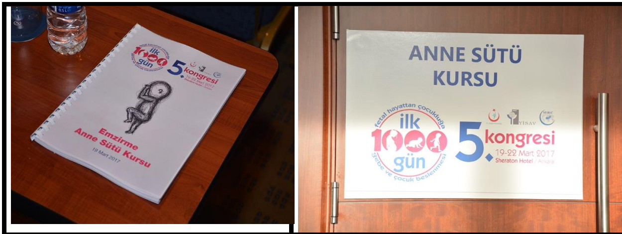
Şekil 10-1: İlk 1000 Gün Kongresinde drama yöntemi ile yapılan Anne Sütü Kursu ve Sunum Kitapçığı (bilgi ellerinde; sorulan sorulara cevapları kapsamaktadır)

Temel eğitsel model de ödül ve ceza olmayacağı için, elde edilen sonuç veya gidilen yol, değerlendirmeli, irdelenmeli ve örnek veya ibret olarak alınmalıdır. Bireylere karşı yaklaşım olamaz, yapılan veya oluşana karşı tenkit yapılabilir. Anne sütünün önemi başlıca amaçlanan hedefdir. Bu kadar bir drama yapıp, mama vererek bu sorunu çözebilirsiniz sözü, tüm çabaları yok edicidir. Eğitici kullanacağı kelimeleri iyi seçmelidir.