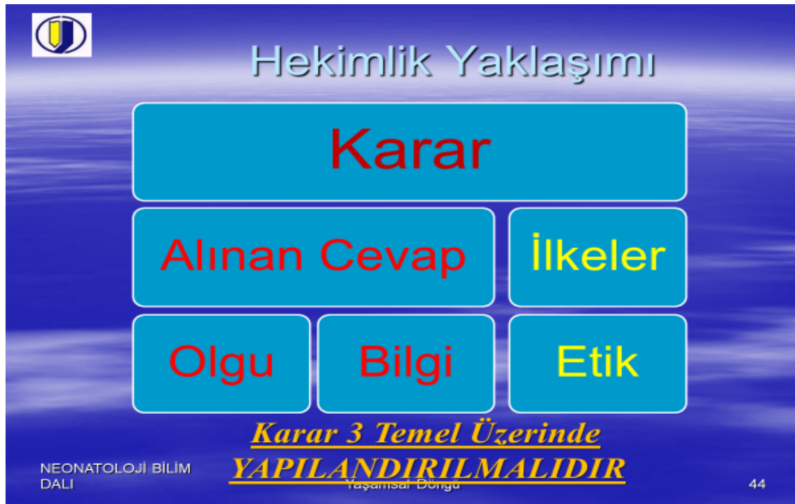
Şekil 10-6: Karar Almayı kapsayan parametreler