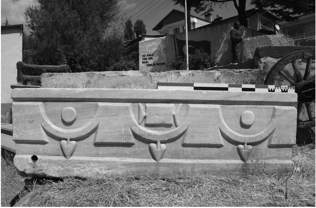
Resim 5: Bursa Baraklı'dan yarı mamul lahit

sadece duvarda bir oyuk biçiminde oluşturulmaktaydı. Pınara kentinde Likya'da görülebilecek en sade kayaya-duvara oyma mezarlara rastlanırken, Telmessos, Myra gibi yerleşimlerde tapınak ve ev cepheli büyük boyutlu örnekleri görülür. Frigya'da ise en erken mezarlar muhtemelen MÖ 8. yüzyıldan beri bulunmaktaydı. Ancak bu tür mezar geleneği bölgenin idari bağımsızlığını kaybettiği Helenistik ve Roma dönemlerinde de devam etmiştir. Sadece Dağlık Frigya'da ana kayanın oyularak lahit biçiminin verildiği ve doğrudan kayaya oyulan mezar biçiminde iki ayrı tipte yapılmış dört yüz otuz kadar khamosorion tespit edilmiştir. 30 İmparator Hadrianus (hd. 117-138) döneminde Frigya'da kayaya oyma mezarlar yeniden canlanmışken, bu uygulama Antoninler döneminde Paflagonia'da da varlığını sürdürmüştür. 31 Özellikle Afrika'da ve doğu eyaletlerinde yapılan bir uygulama da büyük ve yüksek kayalık bir tepenin oyulmak suretiyle mezarlara dönüştürülmesi şeklindeydi. Bunun en iyi örnekleri Libya Cyrenae, Suriye Qatura ve Kilikya'da Mersin Korykos antik kenti yakınlarındaki Adam Kayalar adıyla anılan bölgelerdedi. Özellikle Adam Kayalar ve Qatura örneklerinde ölen kişiler kayadan oyma mezar odaları içine gömülmekle kalmayıp gömüldükleri kayanın üstünde oyulan kayalara da yüksek kabartma biçiminde bezemeleri de yapılmıştır. (Resim 4) Adam Kayalar'ın bölgenin yöneticilerine ait oldukları ve Helenistik dönem başlarında yapılmaya başlanıp Roma imparatorluğu döneminde de devam ettiği bilinmektedir.