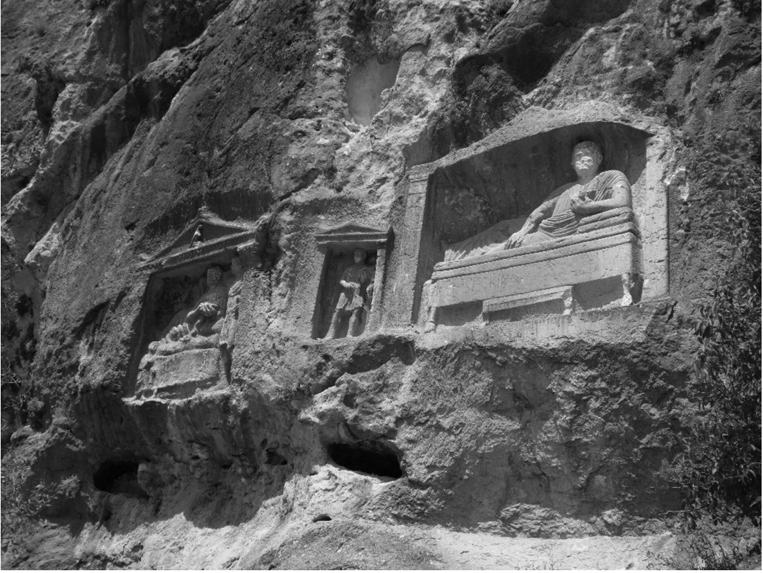
Resim 4: Adamkayalar mezarları

mezarlara rastlanmaktadır. Az bilinen bir örneği oluşturan Djebel Baghouz'dan da anlaşıldığı gibi bu tür mezarların yaygınlaşmaya başlaması MÖ 2. yüzyıldan itibaren olmuştur. 28 Bunun en iyi örneklerinden biri MS 2. yüzyıl başlarına tarihlenen ve içine çok sayıda kişinin gömülmesine imkân sağlayabilecek olan Palmyra Elahbel mezarıdır. (Resim 3) Bu bölgeden çok uzak bir eyalette Germania'da da İgel kentinde Secundinii ailesinin MS 250 yılı civarına tarihlenen mezarı benzer bir uygulamanın batıdaki çok nadir örneklerinden biridir.