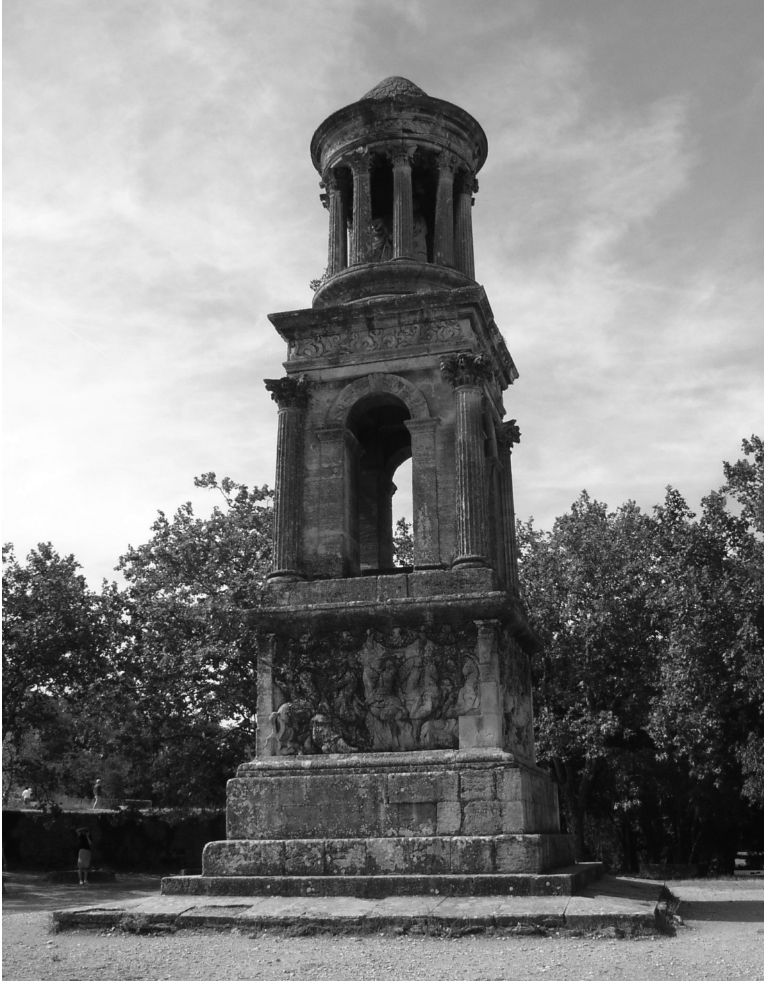
Resim 7: Glanum'da İlülî kenotafi