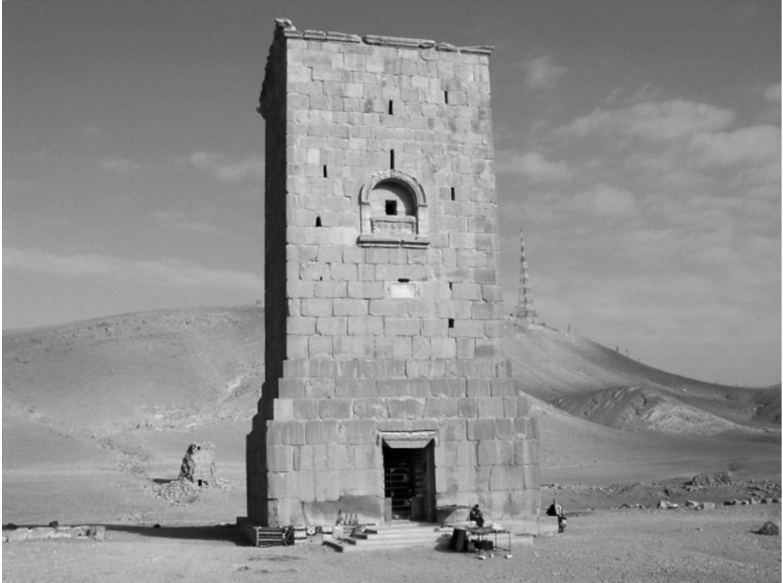
Resim 3: Palmyra Elahbel mezarı