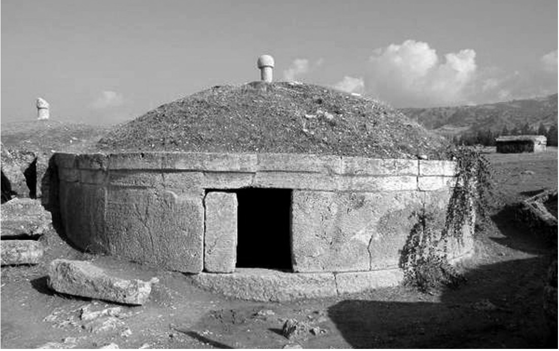
Resim 6: Hierapolis'ten heroon