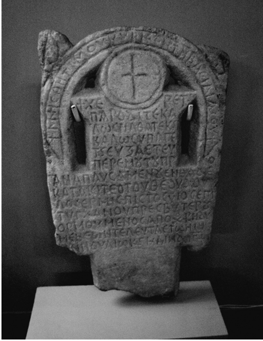
Resim 13: Petersburg Hermitage müzesinden Erken Bizans dönemi mezar taşı

bilinmektedir. 70 Olması gereken dini uygulama ve mezarların yönlendirilmesi söz konusu değilken tiyatro gibi kullanım dışı kalmış olan alanlar bu amaçla değerlendirilmişlerdir. Bu uygulamanın en iyi örneklerinden biri İznik tiyatrosundaki toplu mezardır. Tiyatro içinde gömülenlerin askerler olduğu anlaşılmıştır. 71