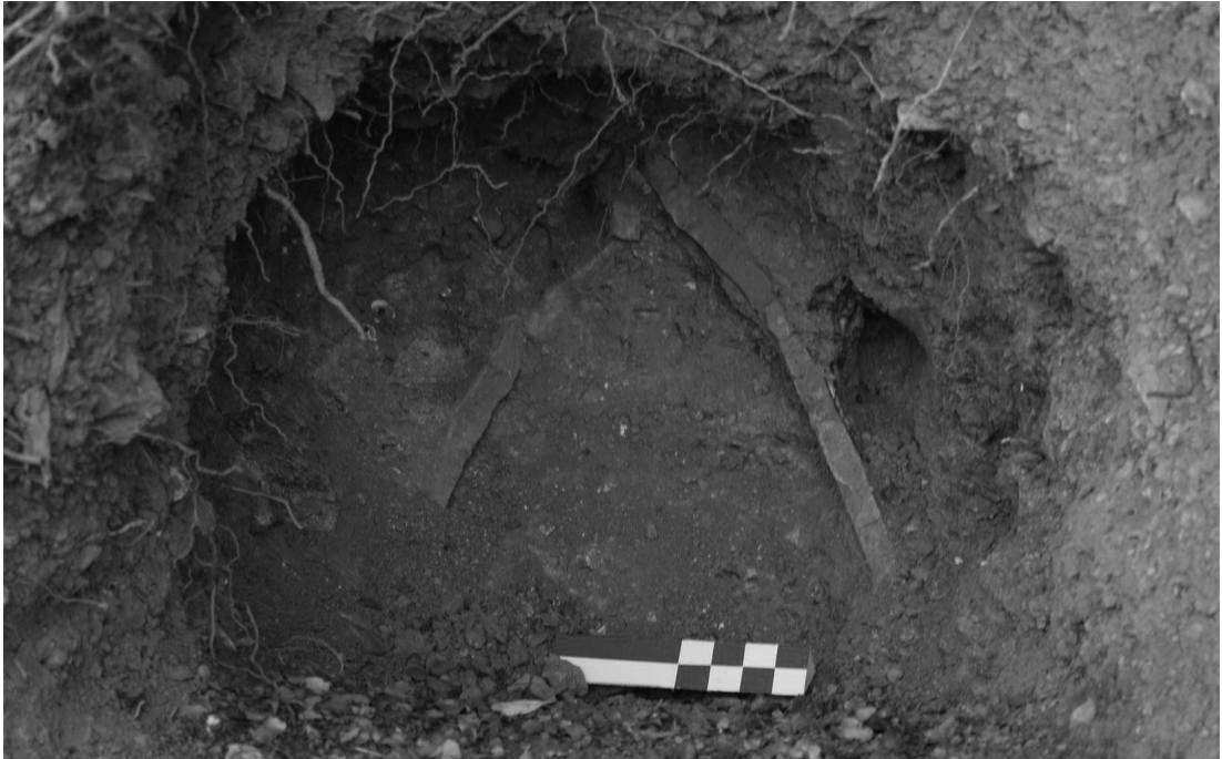
Resim 8: Bursa yakınlarında Erken Bizans dönemi kiremit mezar

Sıklıkla heroon tipi mezarlarla bir anılır. Roma tarihinde özellikle cumhuriyetin son dönemlerinde imparatorluk öncesinde ölen önemli komutan ve idarecilere olan sevginin bir göstergesi olarak asıl mezarlarının olduğu yerden farklı yerlerde kenotaf adıyla anılan sembolik mezarlar bulunmaktaydı. Bu tür mezarlar için en iyi örneği İulius Caesar için olanlar oluşturur. Bununla beraber Fransa Glanum antik kentinde MÖ 30-20 yılları arasında tarihlenen İulii ailesi örneğinde görüldüğü gibi güçlü şahısların kendi adlarına yaptırdıkları kenotaf'lara rastlamak da mümkündür. (Resim 7) Anadolu'daki en önemli kenotaf ise Limyra'da İulius Caesar için MS 1. yüzyılda yaptırılmış olmaktadır. Bunun yanı sıra kime ait olduğu bilinmemekle beraber kapı görünümlü kenotaf'ların en iyi örneklerinden biri de MS 2. yüzyıla tarihlenen Mersin Aydıncık Dört ayak kenotaf'ıdır.