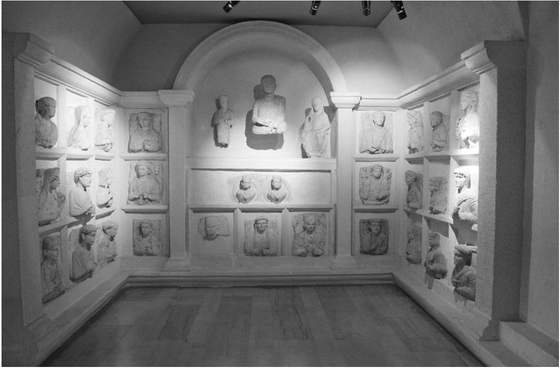
Resim 2: Palmyra'dan mezar odası