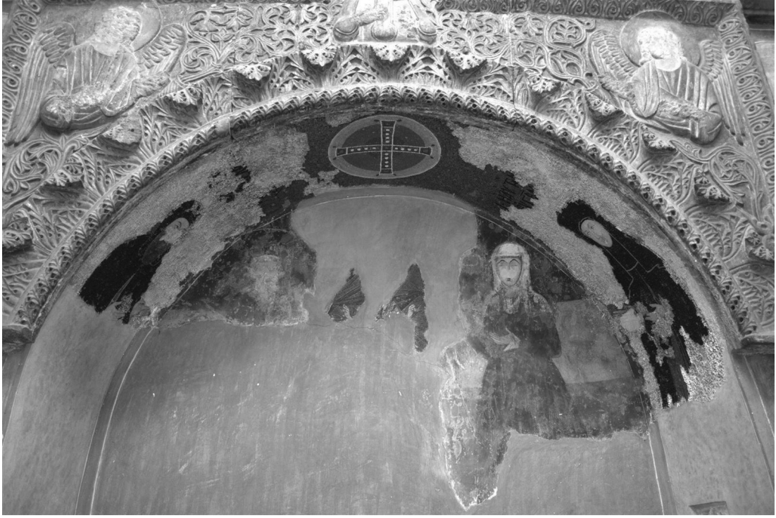
Resim 10: Kariye panklesionunda mezar

örneğinde olduğu gibi narteks zemini altında ve bezemesiz olan örnekleri vardır. 11.-15. yüzyıllar arasında bu mezarın yedi türü olduğu tespit edilmiştir. 58 Erken ve Orta Bizans dönemlerinde yapıların zemini altında oluşturulan mekânlarda fresko bezemeli arcosoliumlara rastlanırken, İstanbul'da özellikle Son Bizans döneminde kilise içinde ve freskoların yanı sıra kemerli bölümlerinin de kabartmalarla bezendiği Kariye gibi örneklere rastlanmaktadır. 59 (Resim 10)