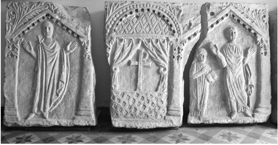
Resim 12: İstanbul Silivrikapı hipojesi kabartmaları

bunun yanında bulunan iki yuvarlak mezar binası ile haç biçimli mezar binalarına gömülmektedirler. 67 Bu tarihten itibaren, yer kalmaması sebebiyle, manastır kiliselerine defnedilmişlerdir. Bu sebeple 11. yüzyıl sonrasında mausoleum kullanımı sona ermiştir.