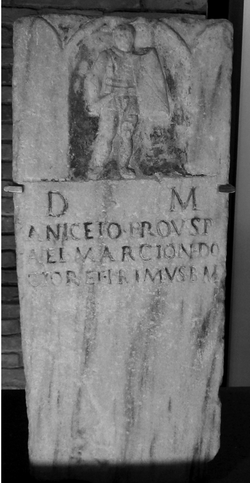
Resim 9: Roma Capitolini müzesinden gladyatör mezarı steli