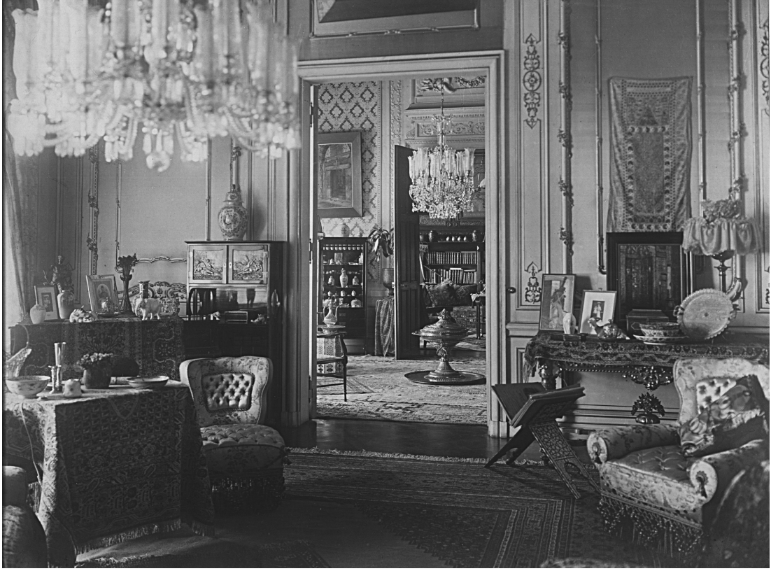
Fotoğraf 3: Hariciye Nezareti (Tevfik Paşa) Konağı Büyük Salonu ve Büyük Salondan Küçük Salonun Görünümü

Başbakanlık Osmanlı Arşivi'nde Hariciye Nezareti (Tevfik Paşa) Konağı'nın Saray tarafından Ahmet Tevfik Paşa'ya ihsan edilmesine dair Temmuz 1902 tarihli dört adet belge 8 bulunmaktadır. Bu belgelerde, 1902 yılında konağın Ahmet Tevfik Paşa'ya bağışlandığı ve konağın tapu kayıtlarının Paşa'nın üzerine geçirildiği belirtilmektedir.