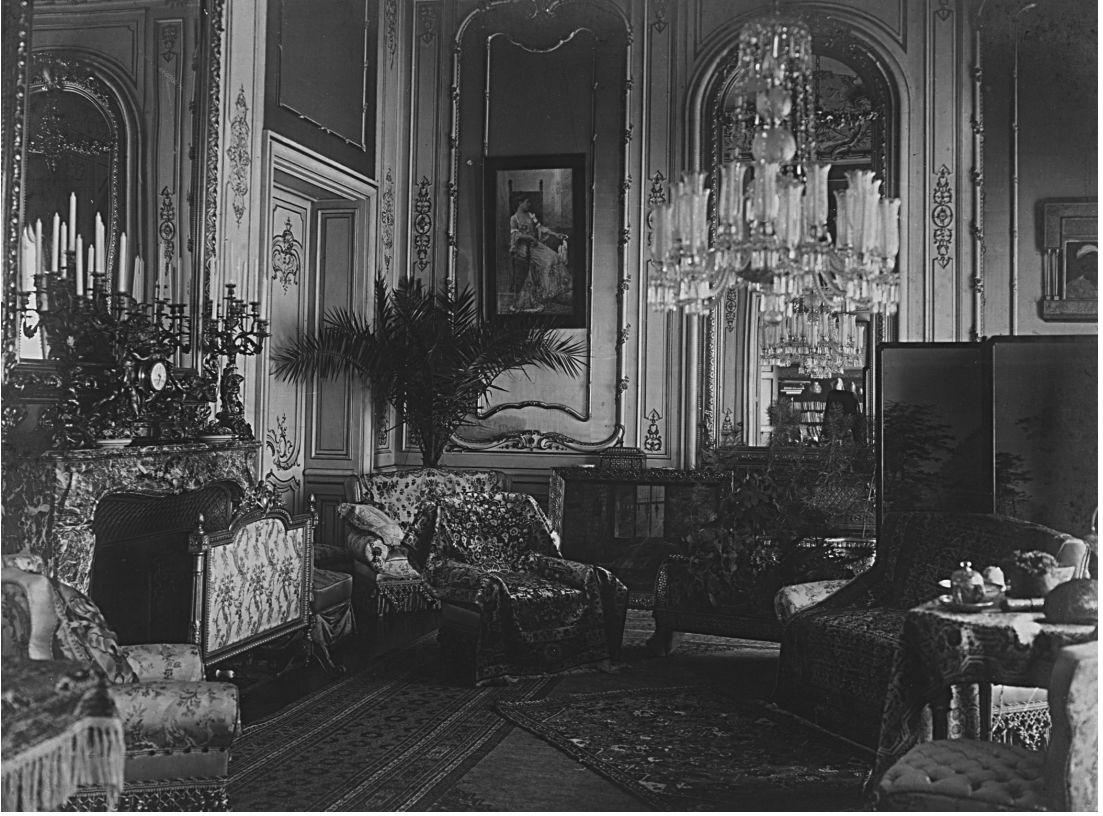
Fotoğraf 4: Hariciye Nezareti (Tevfik Paşa) Konağı Büyük Salon

Tevfik Paşa'dan sonra göreve gelen Hariciye Nazırlarının bu konakta oturmaya devam ettiklerini ve konakta gerçekleşen bir dizi sosyal olayı aşağıdaki satırlarda anlatmaktadır: