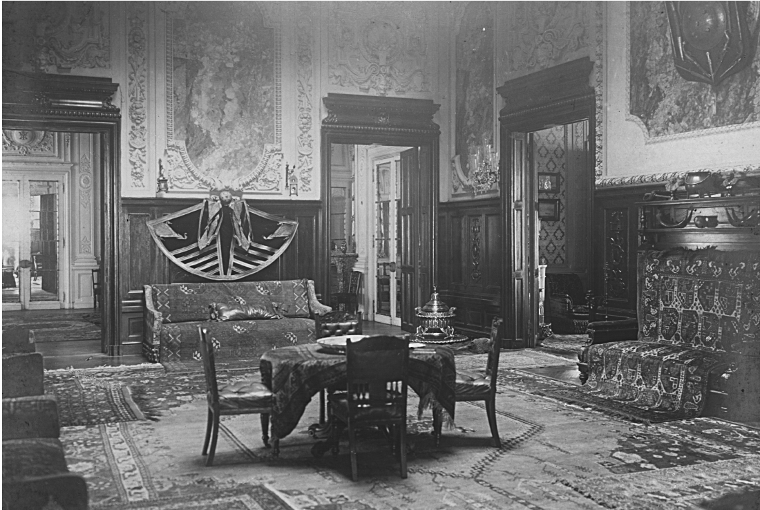
Fotoğraf 8: Hariciye Nezareti (Tevfik Paşa) Konağı Balo (Dans) Salonu (MSGSÜ İstanbul Resim Heykel Müzesi Arşivi Leyla Turgut Terekesi Fotoğraf Dosyası, Env. No: 7/8921)