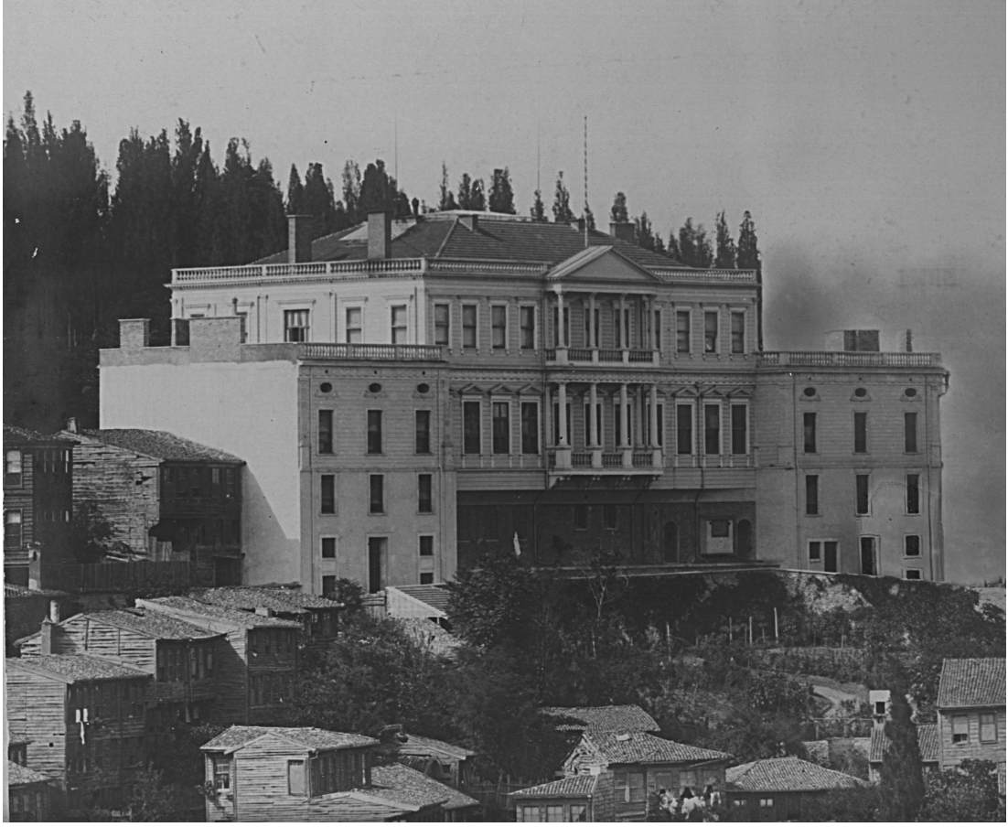
Fotoğraf 2: Hariciye Nezareti (Tevfik Paşa) Konağı'nın Dolmabahçe Kıyısından Görünümü (MSGSÜ İstanbul Resim Heykel Müzesi Arşivi Leyla Turgut Terekesi Fotoğraf Dosyası, Env. No: 18/8932)

Leyla Turgut Terekesi'ndeki yapıya ait 2 nolu dış cephe fotoğrafında 4 Hariciye Nezareti (Tevfik Paşa) Konağı'nın; giriş, birinci ve ikinci kat olmak üzere üç katlı ve neoklasik üslupta inşa edildiği anlaşılmaktadır. Neoklasik tarz bu dönem yapıları için karakteristiktir.