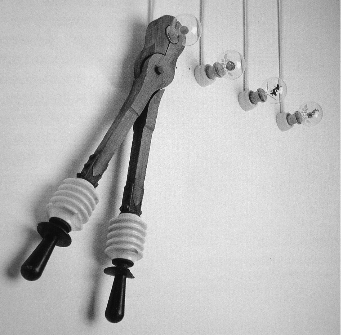
Resim 1: Hale Tenger, Kitsch Catch, yüksek gerilim maşası, ampul, 1992.

engellene talep olmayacak ve bu birim/kurum “talepsizlikten” doğal elemeye sistem dışı kalacak gibi algılanmaktadır.