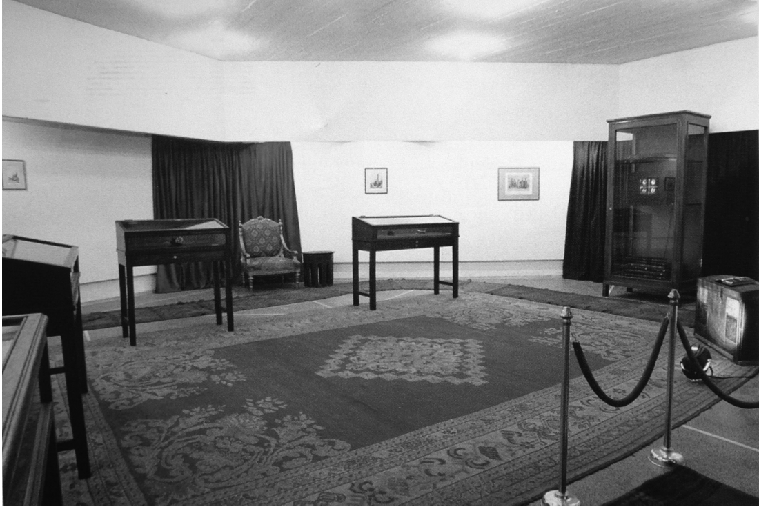
Resim 2: Hale Tenger, Havanın Lüzumu , düzenleme, karışık malzeme, 1992.

üst başlığında bu konuda bilimdeki her üye ülkeyi kapsayacak keskinlikte bir tanımlama henüz oluşturulmamıştır.