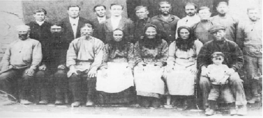
Resim 3: Bir grup yaşlı Malakan 31

19. yüzyıl sonlarına doğru bu bölgede yaklaşık 6.500 Malakan nüfusu yaşamaktadır. 29 Malakanlar dışında savaş sonrası Kars bölgesinin nüfus profilini Kürt, Türk, Ermeni, Karapapak, Terekeme, Duhabor, Rum, Alman, Eston, Türkmen vb. etnik ve dinsel topluluklar oluşturmaktadır. 30