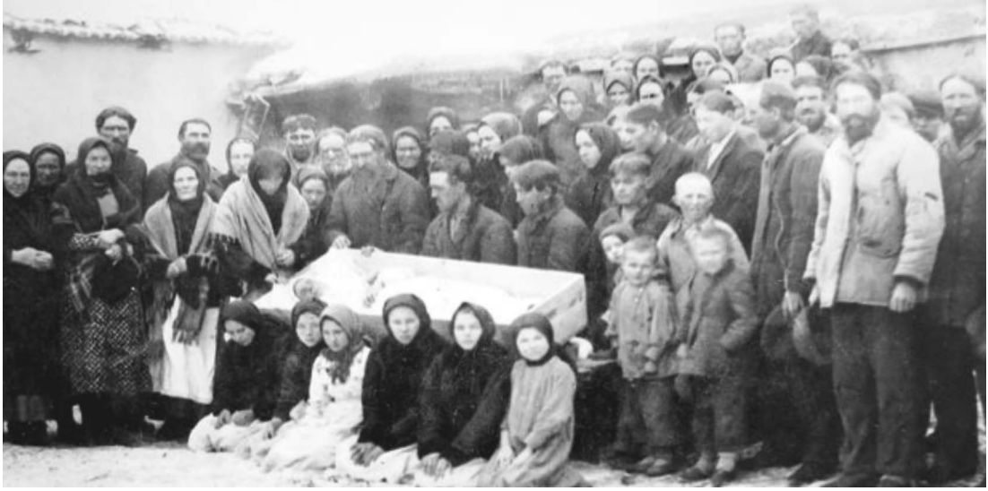
Resim 1: Malakanlar 24

hareketidir. 22 Malakanlardan tarihsel olarak ilk defa 18. yüzyılda bahsedilmeye başlanması onun köylü toplumunun dönüşümüne neden olan Batılılaşma hareketlerine ve kırdan ortaya çıkan dönüşüme karşı bir hareket olduğunu göstermektedir. Rusya’da kapitalizmin gelişimi ve tarımsal yapıdaki dönüşüm süreci salt iktisadi bir dönüşüm olmaktan çok, Rus köylüsünün topraktan koparılması ve yaşam biçimine müdahale edilmesiyle sonuçlanmıştır. Bu süreç köylü cemaatlerle Ortodoks kilisesi arasındaki ayrılığın ve çatışmanın temelini belirlemiştir. 23