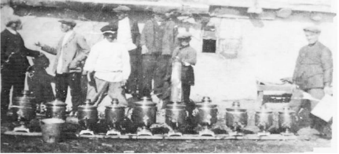
Resim 4: Malakan Köyünde Semaver yapımı 33

“Malakanlar Ruslar zamanında dahi askerliğe gitmezlermiş, erkekleri hep sakallı. Umumiyetle iri vücutlu, canlı kanlı, sıhhat numunesi insanlar. Elbise ve vücutları temiz. Hayvanları kadana, arabaları çok eşya alır, dört tekerlekli, büyük ve sağlam. Ziraat ekme, biçme aletleri hep son sistem, yalnız çekme kuvveti beygirdir. Kan dökmek en büyük günah imiş, harpte dahi olsa. Ben onları yalnız nakliyyede kullanıyordum. Buna dahi itiraz ediyorlardı. Karsın her tarafında şoseler boyunca uzanan bu köylüler teşviklerle Bolşevik teşkilatına başlayarak bugün gösterdikleri samimi hayatlarını bozmaya da başlamışlardı.” 32