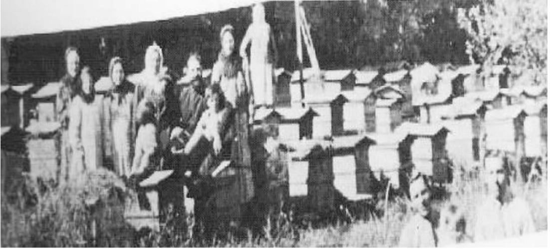
Resim 5: Arıcılıkla uğraşan Malakanlar 34

Kazım Karabekir’in Malakanlar üzerinden ele aldığı Bolşeviklik tartışması aynı zamanda o dönemin basınında oldukça yer bulmuştur. 19.yüzyılın sonundan itibaren Osmanlı devleti içerisinde sosyalist fikirler tartışılmış, 1917 Sovyet Devrimi sonrasında ise komünizm fikri Anadolu’da