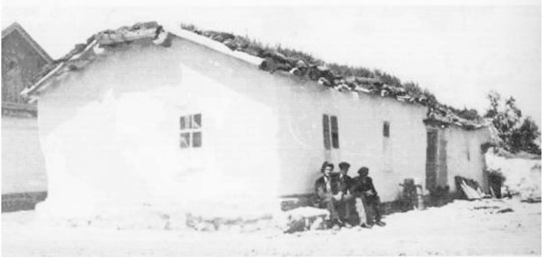
Resim 2: Çakmak Köyü'nde bir Malakan Evi 28

19. yüzyıl sonlarına doğru bu bölgede yaklaşık 6.500 Malakan nüfusu yaşamaktadır. 29 Malakanlar dışında savaş sonrası Kars bölgesinin nüfus profilini Kürt, Türk, Ermeni, Karapapak, Terekeme, Duhabor, Rum, Alman, Eston, Türkmen vb. etnik ve dinsel topluluklar oluşturmaktadır. 30