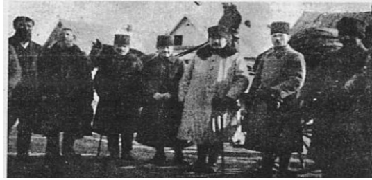
Resim 6: Kazım Karabekir Kars Çakmak köyünde bir grup Malakanla 39

Bu dönemin Bolşevizm'e ilişkin tartışmalarının dışında 2 Eylül 1920 tarihli Büyük Millet Meclisi kararı Anadolu'daki Bolşevik örgütlenme süreçlerine dikkat çekmektedir. Alınan kararda Bolşevik örgütlenme pratiklerinin ve ideolojisinin yaygınlık kazandığına dikkat çekilmiş. 37 18 Ekim 1920 yılında resmi Türkiye Komünist Partisi'nin (TKP) kurulması Anadolu'da örgütlenme süreci içerisinde olan Bolşevik TKP'nin yasal olarak dışarıda bırakılmasına ve Türkiye'de olabilecek bir komünist örgütlenmeleri hükümet kontrolüne bağlamıştır. Özellikle Mustafa Kemal'in gizli meclis konuşmaları komünist örgütlenmelere yönelik bakışı özetler niteliktedir. 38