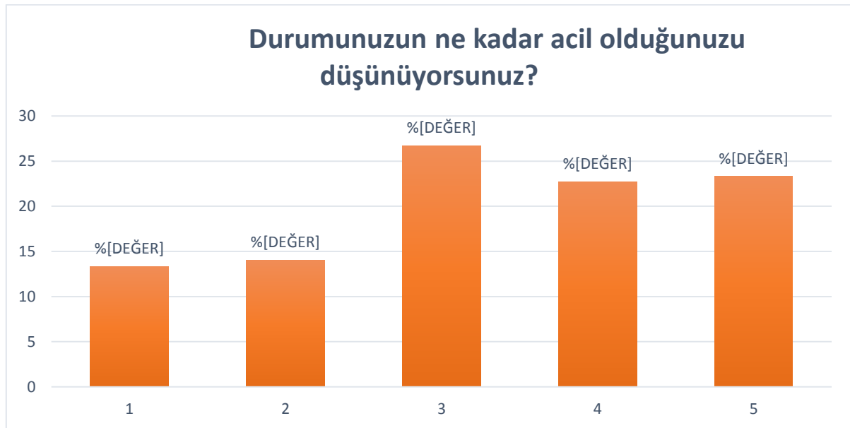
Grafik 1. Hastaların durumlarının aciliyetini değerlendirme skorlamaları

Hastalara durumlarının aciliyetliklerinin 1'den 5'e skorlamaları istendiğinde skor ortalaması 3,27 \pm 1,356 olarak saptandı. Hastaların % 26,7 (n=40)'si durumunun 3 değerinde acil olduğunu, %22,7 (n=34)' si 4 derecede acil olduğunu, %23,3 (n=35)'ü 5 derecede acil olduğunu düşünmekteken; %13,3 (n=20)'ü durumunun 1 derecede acil olduğunu düşünmekteydi. Hastaların durumlarının aciliyetini değerlendirme skorlamaları grafik 1'de verilmiştir.