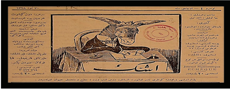
1. Resim: Eşek, 12 Ağustos 1912, S.4

Gazetenin logosunda insan vücudunun eşek kafasıyla birleştirilerek oluşturulan karikatürde, masada oturan, sağ gözünde monokl denilen kaş ile yanak arasına sıkıştırılan, çerçevesiz, tek camlı gözlük takılı olan ve insanî bir davranış biçimi sergileyerek önündeki kâğıda bir şeyler yazan bir canlıya yer verilmiştir.