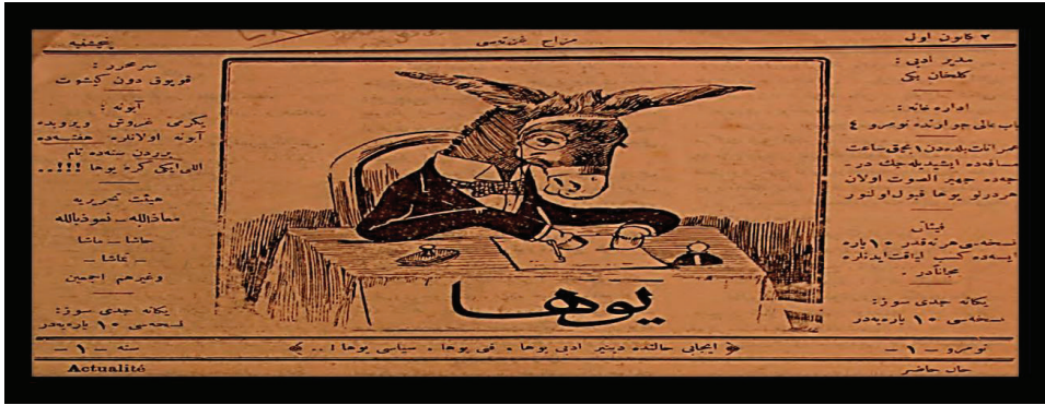
10. Resim: Yuha , 2 Kanun-ı Evvel ?, S.1

Malum 'da masanın arkasına gizlenen ve yalnızca kulakları görünen eşeğin, Yuha 'da Eşek ve Kibar adlı mizah gazetelerinde olduğu gibi yeniden masada oturduğu ve bir şeyler yazdığı görülür. Tevfik'in gazetelerinin kapak klişelerinde kullanılan bu karikatürler zihindeki yerleşmiş kavramları ve şekilleri çarpıtarak sarsıcı etki yaratmaktadır.