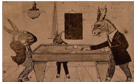
9. Resim: Malum , 28 Aralık 1910, S.3