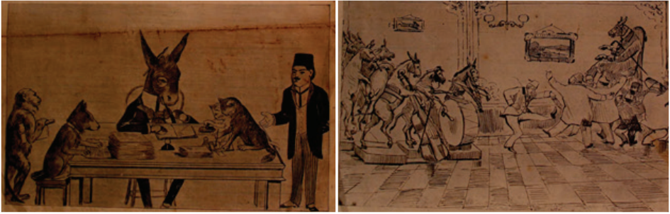
10. ve 11. Resim: Yuha , 2 Kanun-ı Evvel ?, S.1

Aşağıdaki onuncu resimde kedi, köpek, maymun ve eşek figürlerinin Yuha gazetesinin gazetecilerini temsil ettiği ve gazeteyi baskıya hazırladıkları görülmektedir. Yanlarına gelen bir erkeğin korkmadan nasıl gazetecilik yaptıklarını sorması dikkat çekmektedir. Çünkü Yuha 'nın yayımlandığı dönemde baskıcı yönetim nedeniyle pek çok gazete yayınına ara vermek zorunda kalmıştır. Karikatürün altında bu konuda “Korkacak ne var ki... Evvela memur değiliz, saniyen...” şeklinde bir açıklamaya yer verilmiştir. Buradaki korkusuzluğun ikinci nedeni olarak gazetenin kapatıldığında yeni adla çıkmayı çözüm olarak bulduğu düşünülebilir. On birinci resimde ise eşek figürlerinden oluşan bir orkestranın çaldığı ve takım elbiseli erkeklerin de oynadığı, sağ üst köşede ise yüksekte oturan bir eşek figürünün onları izlediği görülmektedir. Karikatürün alt metnindeki ağam eğleniyor yazısıyla nitelenen kişinin yüksekteki eşek figürü olduğu ve onun da yönetici kesimi simgelediği düşünülebilir.