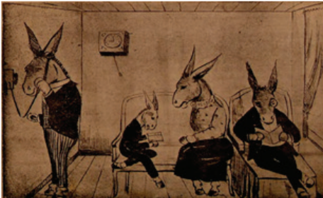
8. Resim: Malum , 20 Aralık 1910, S.1

Gazetenin edebî müdürünün O'dur O müstearlı bir kişi ve müdürünün de Kibar 'da olduğu gibi Salih isminde birisi olduğu bilgisi verilir. Başyazarı El-malum Donkişot 'tur. Gazetenin yazı heyetini ise Belli, Bildik, Yabancı Değil, Belki, Amcazâde, Unutma Yahu, İşte O müstearlı kişiler oluşturur. Gazetede yegâne ciddi söz nüshasının 10 para olduğu hakkındadır. Eşek'in idarehanesiyle Malum 'un idarehanesi aynıdır. Yapı ve şekil bakımından da önceki mizah gazeteleriyle aynı şekilde düzenlenmiştir. Sekizinci resim olarak belirtilen karikatürün alt yazısından, yazdıkları nedeniyle tatil edilen gazetenin yöneticilerinden birinin Beyrut'taki bir gazeteyi arayarak bu durumda ne yapılması gerektiği hakkında akıl danıştığı görülür. İkinci karikatürde ise bilardo oynayan eşek figürleri üzerinden muhalif düşüncede olanların birbirini eleştirmesi karikatürize edilmiştir.