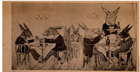
5. ve 6. Resim: Kibar , 06 Aralık 1910, S.1

Eşek gazetesinin yönetim tarafından kapatılmasından sonra yayını sürdürdüğü farklı isimdeki gazetelerden biri de Kibar 'dır. Her iki gazete kapak sayfasındaki karikatür, yazı heyeti ve gazetenin tanıtım bilgileri açısından karşılaştırıldığında bu rahatlıkla anlaşılabilir. Kibar 'ın birinci sayısında da Eşek gazetesinin devamı olduğunu kanıtlayıcı bir mısraya yer verilir: “Dinleyin nağmesin artık bî şek/Dâhil silin Kibar oldu Eşek ”.