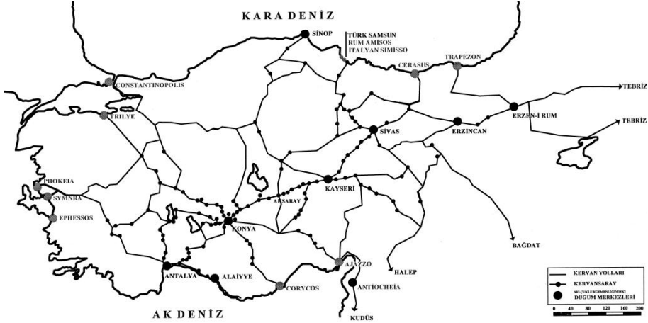
Harita 2: Anadolu'da Selçuklu Dönemi Ulaşım Sistemi ve Kervansaraylar Ağı

Yılğın/Ilgın Pazarı, Yabanlu Panayırı, Ziyaret Pazarı, Âzîne/Ezine Pazarı, Alâmeddîn-i Bazârî/Alâmeddin Pazarı, Pınar Pazarı ve Koçhisar/Dunaysar Pazarı gibi yerler, tespit edilebilen pazar veya panayır yerleridir. 17