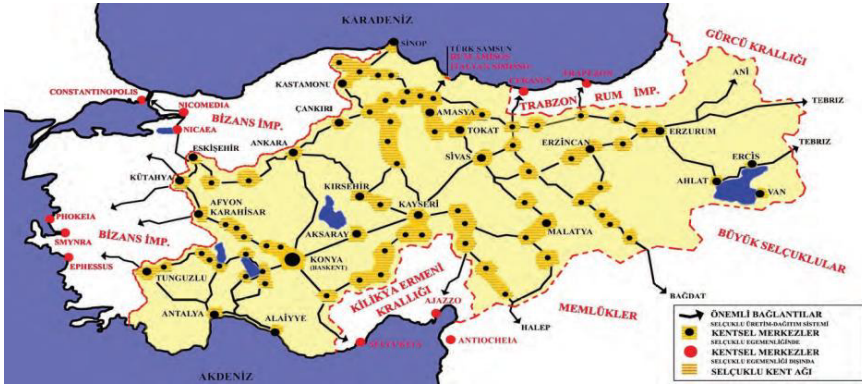
Harita 1: Anadolu Selçuklu Hâkimiyet Bölgesi, Şehirler Sistemi ve Ulaşımı

Selçuklular Anadolu coğrafyasında şehirleşme politikası olarak öncelikle askeri yani stratejik önemi ön planda tutmuşlardır. Ardından şehirlerin yönetimi, siyasi ve ekonomik durumları dikkate alınmıştır. Bu yöntemle şehirlerin kurulması, canlanması ve ulaşım sistemlerinden azami düzeyde yararlanılması hedeflenmiştir. Aynı zamanda hem dini hayatın uygulanmasında çeşitli kolaylıklar sağlanıyor hem de kültürel faaliyetler bağlamında pek çok etkinliği halkın rahatlıkla yerine getirmesine imkân tanınmıştır. 12