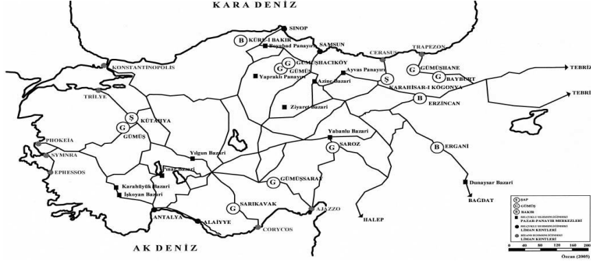
Harita 3: Anadolu'da Selçuklu Dönemi Üretim Dağıtım Merkezleri

leşmesiyle bölgelerarası mübadele merkezleri ve askeri tersane merkezleri olarak kullanıldığı anlaşılmaktadır. 19