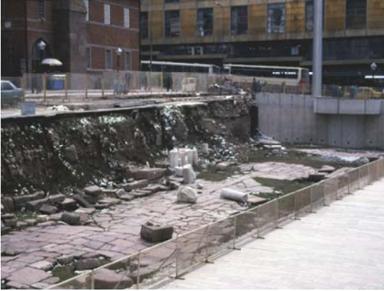
Şekil 9. Platforma dönüştürülen antik ticaret alanı (The antique commercial area transformed to a platform)

İnşaat bittiğinde antik dükkânların üzerinin bir platformla kapatıldığı, Roma Yolu'nun Hükümet Konağı binasına doğru uzanan kuzey kısmının bir beton duvarla kesildiği, Zincirli Cami yönünde mevcut sokağın antik yola kaymasını önleyecek hiçbir girişimde bulunmadığı ve yeni yapının bir bölümünün kültür varlığı olarak tescil edilmiş olan Sümerbank Genel Müdürlüğü binasına da bitiştirildiği tespit edilmiştir (Şekil 9-11).