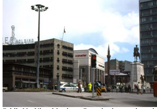
Şekil 11. Ulus Meydanı; Sümerbank ve arkasında yeni işhanı (Ulus Square; Sümerbank and the new commercial center at the rear)

Birinci derece arkeolojik sit alanı olan kazı alanının yarısı yeni yapılan işhanının giriş platformu altında kalmıştır. Koruma sadece bir antik yolun yarısının açıkta bırakılması olmamalıdır. Üstelik bir kent içi yol, hangi döneme ait olursa olsun, ancak iki yönünde onu bir güzergâh olarak tanımlayan yapılarla anlam kazanır. İnşaat sonrası bu bütünlük bir daha geriye dönülemeyecek biçimde ortadan kaldırılmıştır.