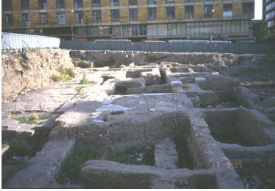
Şekil 4. Roma Yolu ve antik ticaret alanı (The Roman road and the antique commercial area)