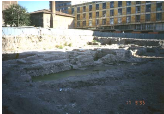
Şekil 8. Kazı alanını çevreleyen metal perde (The metal curtain wall surrounding the excavation area)