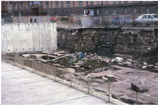
Şekil 10. Beton duvarla kapatılan Roma Yolu ve önlem alınmayan doğu yönü (The Roman road blocked with a concrete wall and the east side without any precautions)