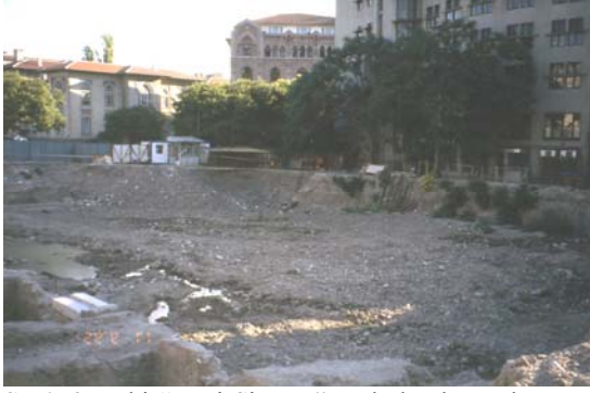
Şekil 3. Eski "Yeni Sinema"nın bulunduğu alan (The area of the old "Yeni Sinema")