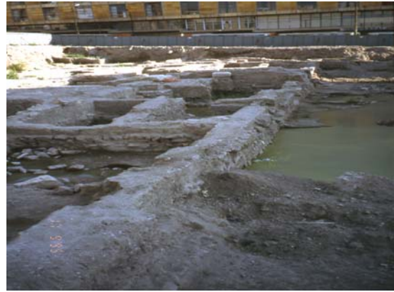
Şekil 7. Kazı alanını kaplayan atık su (The waste water covering the excavation area)