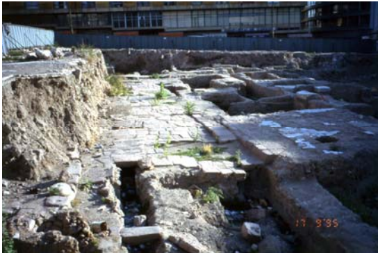
Şekil 5. M.S. 2. yüzyıla ait kanaldan bir bölüm (A part of the channel from the 2 nd century A.D.)

Bilimsel bulguların yanı sıra, bu alanın daha Roma döneminden başlayarak günümüze kadar ticaret işlevini sürdürüyor olması heyecan vericidir. Buna karşılık, kente sahip çıkma, kentli olma bilincini kuvvetlendirecek olan bu bulgular kamuoyunda beklenen yankıyı bulamamıştır. Bilimsel açıdan yerinde, "in situ", korunması beklenen bulgular önce güvenlik endişesi ile Roma Hamamı'nın depolarına kaldırılmıştır. Daha sonra alanın dükkânlar bölümünün üzeri kapatılacağından bir daha özgün yerlerine getirilebilme olanağı da kalmayacaktır.