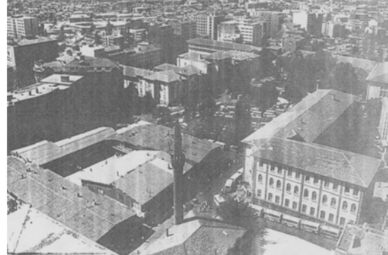
Şekil 1. Zincirli Cami ve Şehir Çarşısı'nın yeni yeri (Zincirli Mosque and the new place of Şehir Çarşısı)

Masrafi mülk sahibi tarafından karşılanan kazı sonucunda Geç Roma ve Erken Bizans dönemine tarihlenen döşeme seviyesinde dükkanlar ve bir kısmı Zincirli Cami yönüne doğru uzanan cadde ortaya çıkarılır (Şekil 4). 2. yüzyılda yapılmış ve halen işlevini sürdüren bir kanalın bulunması da kazının dikkate değer buluntuları arasındadır (Şekil 5).