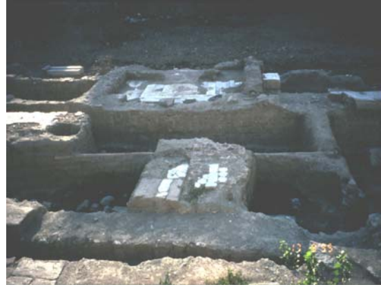
Şekil 6. Dükkân döşeme kaplamaları (The floor finishes of the shops)

Buluntu alanı kazıyı takip eden mevsim sonunda yeraltı suyu nedeniyle kısmen su altında kalır ve çeşitli atıkların boşaltıldığı, etrafı metal bir perde ile çevrili olduğu için kentliler tarafından hiç algılanmayan ve tanınmayan bir açık alana dönüşür (Şekil 7, 8). Alanın altında bir yeraltı su kaynağının bulunduğu parselin Sümerbank'a bitişik olan kısmında, bu alana Yeni Sinema yapılmadan önce bir hamam bulunduğu sözlü bilgisini de doğrulamaktadır.