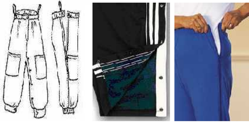
Şekil 3. 9: Bel kemeri ve paça boyunda yan kapama ( 26 )

Tekerlekli sandalyede oturan bireyler için tasarlanan pantolonlarda paçalar bol olup arka bedende cep yer almamakta, bel kesimi arkada yüksek önde düşük olmaktadır. Yan ve ön paçalarda cebi olan kargo tipi pantolonlar yedek ped, ıslak mendil gibi temizlik gereçlerinin taşınmasını kolaylaştırmaktadır (Şekil 3. 9). Bu bireyler için denim kumaştan üretilmiş sert tutumlu jean pantolonlar uygun değildir (4: 8-9, 9). Bir diğer pantolon modeli, idrar ve/veya dışkı kaçıran ve tekerlekli sandalyede oturan bireyler için tasarlanmış olup önden bakıldığında klasik görünümüne sahiptir ancak arka bedende kalça bölgesine oyuntulu bir kesim uygulanmıştır ya da ihtiyaç durumunda seyyar olarak arka bedene sentetik tutturucular ile takılıp çıkarılabilecek şekilde iki parçalı hale getirilmiştir (3: 4) (Şekil 3. 10).