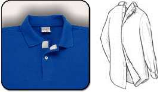
Şekil 3. 6: İlik-düğme görünümlü sentetik tutturucu ile kapama ( 27 )