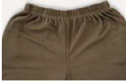
Şekil 3. 7: Sentetik tutturucu ile kapama (24) Şekil 3. 8: Elastik bel kemeri (24)

Bazı pantolon modelleri yandan açık olup fermejüp, fermuar ya da sentetik tutturucular ile kapanmaktadır. Bel kemerine her iki yandan tutturulan büyük lişetler pantolonun kolayca yukarı çekilmesinde kolaylık sağlamaktadır (Şekil 3. 9), (15, 19: 32-33).