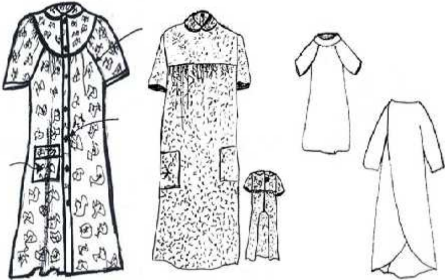
Şekil 3. 3: Özel amaçlı tasarlanmış robalı, reglan kollu elbise modelleri ( 29 )

Tekerlekli sandalyede oturan ve idrar ve/veya dışkı kaçıran bireyler için özel elbise modelleri tasarlanmaktadır. Önden bakıldığında normal bir