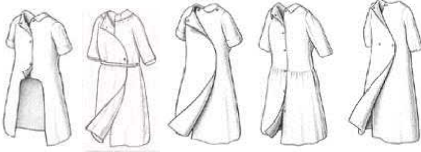
Şekil 3. 4: Özel amaçlı tasarlanmış arkadan açık elbise modelleri ( 24 )

Tüm elbise modelleri için büyük tutaçlı normalden uzun fermuarlar, normalden büyük ilik-düğmeler, kopçalar, beceri gerektirmeden kapanan materyaller kullanılması tavsiye edilir. Bağlantı yerleri için ilik düğme yerine fermejüp (çıt çıt) ya da sentetik tutturucular daha uygundur (19: 32-33).