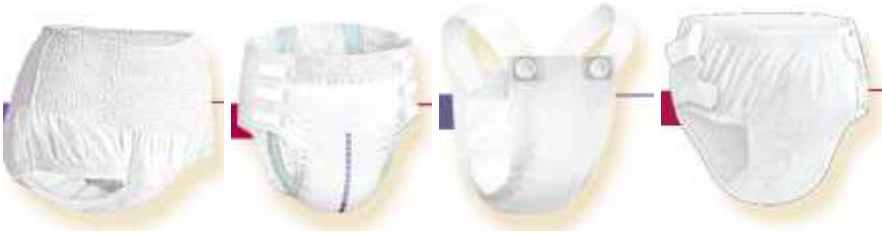
Şekil 3. 2: Özel amaçlı tasarlanmış alt çamaşırlar ( 25 )