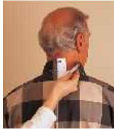
Şekil 3. 5: İlik-düğme görünümlü fermejüp ile kapama ( 27 )