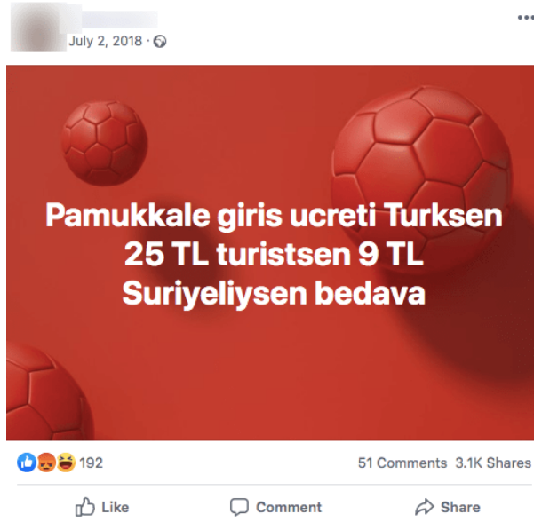
Şekil 1. Yalan olduğu ortaya çıkan bir provokasyon trollemesi örneği

2018 yılında WhatsApp üzerinden yayılan bir sahte haber Meksika’da 2 kişinin yakılarak öldürülmesine sebep olmuştur. Gönderilen mesajda “Herkes dikkatli olsun, çocuk kaçırın başbelaları ülkeye girdi” ve “Bu kişilerin organ kaçakçılığıyla ilişkili oldukları anlaşılıyor. Son birkaç günde, 4, 8 ve 14 yaşındaki çocuklar kayboldu ve bu çocuklar organlarının çalındığına dair vücutlarındaki işaretlerle ölü bulundu. Karınları kesilmişti ve boştu.” Şeklindeki mesajlar yer almıştır. Kısa süre sonra gelişen olaylar neticesinde ve hiçbir suç bulunmayan iki kurban yakılarak öldürülmüştür (Avşar, 2018).