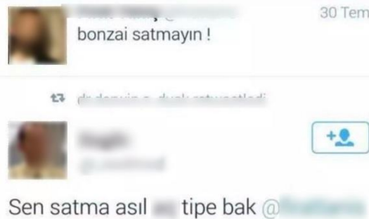
Şekil 4. Ad Hominem Trollemesi Örneği

Akıl yürütmelere verilen cevaplarda mantıksal hata yapılmasından dolayı safsata tanımı yapılmaktadır. Ancak başka kişiler tarafından akıl yürütmeye karşı verilmiş bir safsata cevabı mantıklı görünebilir ve haklı bulunabilir. Ad hominem olarak da bilinen trolleme türünde kullanılan safsata, serbest safsata olarak da adlandırılır. Argumentatim Ad Hominem olarak bilinir ancak ad hominem olarak kısaltılmıştır.