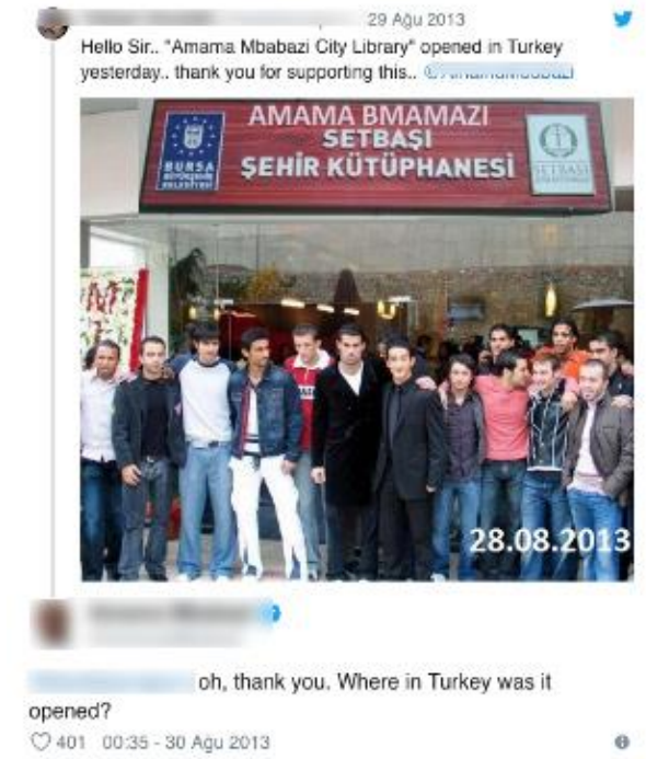
Şekil 3. Şaka Trollemesi Örneği

Bu trolleme türünde hedef trolün başarıya ulaşması ve bundan haz duymasıdır. Ayrıca başarılı bir trolleme yapmış olması çevresinde toplanacak takipçilerin sayısını da artıracaktır. Trolün tatmin olmasının hedeflendiği trollemede eğlence ön plandadır.