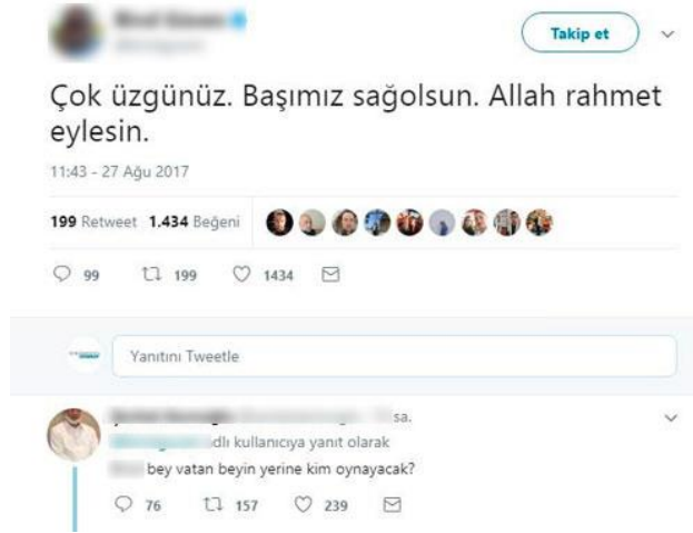
Şekil 5. Karın ağrısı trollemesi örneği