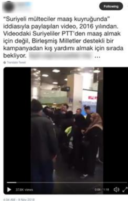
Şekil 9. Sahte Olay Trollemesine Karşı Kurulmuş Bir Hesap

Yalan haberler, olmamış olaylar ve diğer yalanlar gerçek görünümü ile sunulmaktadır. Bu tür trollemeye karşı savaşmak için kurulmuş bazı platformlar, doğrulama hesapları vardır. Bu tür trollemelerde de genellikle fotoğraf veya video içeriği bulunmaktadır ancak bu görüntüler üzerinde ya oynanmıştır ya da verilen enformasyonla bağlantısı bulunmaktadır. En çok rastlanan sahte olaylar trollemelerinde bir ülkede yaşandığı söylenen bir olayla ilgili kullanılan görüntü ya başka bir ülkeden alınmış olmakta veya farklı zaman diliminde gerçekleşmektedir.