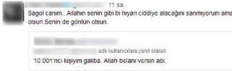
Şekil 10. Hakaret Trollemesi Örneği

Trollemenin iç mantığını anlayamayan kurbanlar onların gerçekten de yaptıkları işe, yayınladıkları iletiye ilişkin fikir beyan ettiklerini düşünürler ve hakarete varacak tepkiler almasını sağladığını düşünürler. Bu yüzden ya kendilerine karşı bir güvensizlik hissetmekte veya hakaret trolüne cevap vererek ona savaş açmaktadırlar. Her iki seçenekte de kurban psikolojik olarak darbe almakta ve bir süre sonra yıpranmaktadır. Bazı ünlü kullanıcılar ise hesaplarını yoruma kapatarak bu soruna çözüm bulma yoluna gitmektedirler.