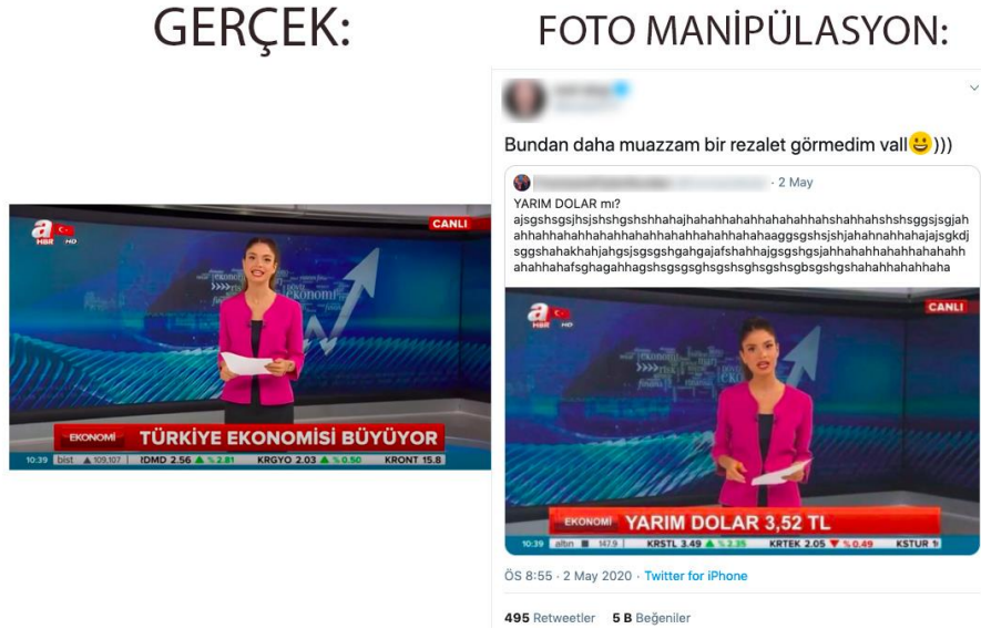
Şekil 3. Partizan Trollemesi Örneği

olabileceği gibi bir partiye oy vermeye teşvik ederken başka bir partiyi küçük düşürmek için de hazırlanabilir. (Şekil.3)'teki örnekte foto montaj yöntemiyle hazırlanmış bir televizyon ekranı görüntüsü bulunuyor, aslında görüntü bir foto manipülasyon.