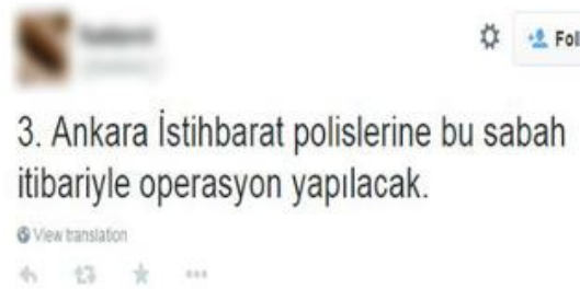
Şekil 2. Sosyal Mühendislik Trolleme Örneği

Kullanıcıların normal şartlar altında üstlenmeyecekleri bir eyleme-davranışa teşvik amacı taşıyan kışkırtıcı trollemelerdir. Bu tür trollemelerin arasında uzmanlar tarafından ciddi hesaplamalar neticesinde oluşturulanlarının olması olasıdır. Bu tür trol hesaplarında nüfuzlu kişilerin ilişkilerinin etkinliği de olasıdır. Zaman zaman nüfuzlu kişilerden bilgiler sızdırılarak bunu sosyal ağlarda paylaşarak takipçilerini artırma yoluna gitmektedirler. Yönetim kademelerinden sızdırılan bilgilerin zamanla doğru çıktığının görülmesi sosyal ağ kullanıcılarının dikkatini bu trollere çekmektedir ve bu sayede manipülasyon imkânı arttırılmaktadır (Şekil.2).