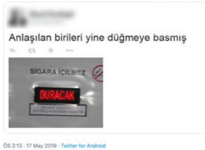
Şekil 11. Hiciv Trollemesi Örneği

Hiciv oluşturmak zor olduğundan keskin bir zekâ gerektirir ve iyi hicivler etkili olduğu gibi troll dünyasında kalıcı da olabilmektedirler. "Efsane troller" adı altında hesaplar açılmakta ve iyi hiciv trollemeleri kayıt altına alınmaktadır. Zaman zaman bu eski trollemeler tekrar paylaşılıp anılmaktadır.