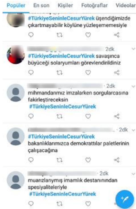
Şekil 6. Trolbotlar ile tıkama trollemesi örneği

Basitçe, otomatik olarak trolleme üretirler, bir sohbet kutusunda verilen otomatik cevaplara benzetilebilir. Bir trolbot bir kelime çantası kullanır ve bir algoritmaya uygun bir şekilde ünlü bir kişinin gönderilerine cevap gönderebilir. Stoklanmış kelime havuzundan kullanır örneğin "o kadar haklısın ki". İyi hazırlanmış bir trolbotu görünüşte diğer trollerden ayırt etmek mümkün değildir. Trolbotların yapmak istedikleri şey kitlesel bir aşılama işlemidir. Gönderilen cevaplara bakan diğer kullanıcılar toplumda yer etmiş bir teveccüh olduğunu düşünecektir. Özellikle Twitter'da kullanılan trolbotlar seçilen bir etiketi o saatlerde ülkede en çok kullanılan etiket olarak gösterme hedefindedirler. Bu sayede politik hedeflere ulaşmada kamuoyunu etkilemek istenmektedir. Trolbotların 'sahte bayrak trollemesi' yöntemiyle de kullanılması mümkündür.