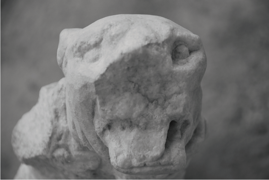
Fig. 5 Tripolis panter heykelinin yukarıdan baş ve yüzü (2007-2008 Tripolis kazısından)