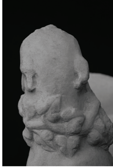
Fig. 4 Tripolis Çocuk Dionysos ve panter heykelinin arkadan baş ve boynu (2007-2008 Tripolis kazısından)