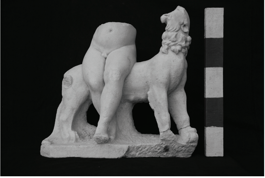
Fig. 1 Tripolis Çocuk Dionysos ve panter heykelinin önden genel görünümü