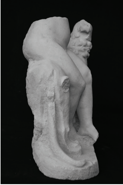
Fig. 6 Tripolis Çocuk Dionysos'un yandan ve panter heykelinin de arkadan görünümü