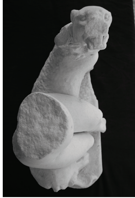
Fig. 7 Tripolis Çocuk Dionysos'un ve panter heykelinin yukarıdan görünümü