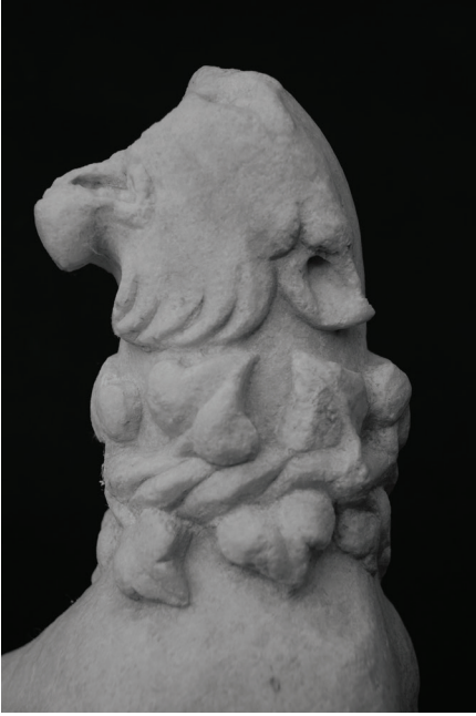
Fig. 3 Tripolis Çocuk Dionysos ve panter heykelinin önden baş ve boynu (2007-2008 Tripolis kazısından)