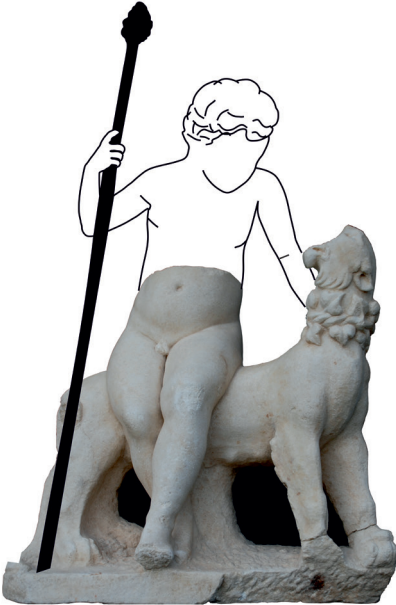
Fig. 8 Tripolis Çocuk Dionysos olası görünümü