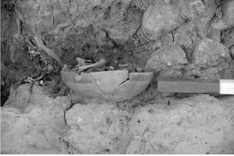
Fig. 6 Salat Tepe IIB, Tabaka 4, OTÇ I Duvarı temel taşları arasına yerleştirilmiş bir çanak içerisinde domuz yavrusu / A bowl including a piglet placed into the foundations of a MBA I Building at Salat Tepe IIB, Level 4.