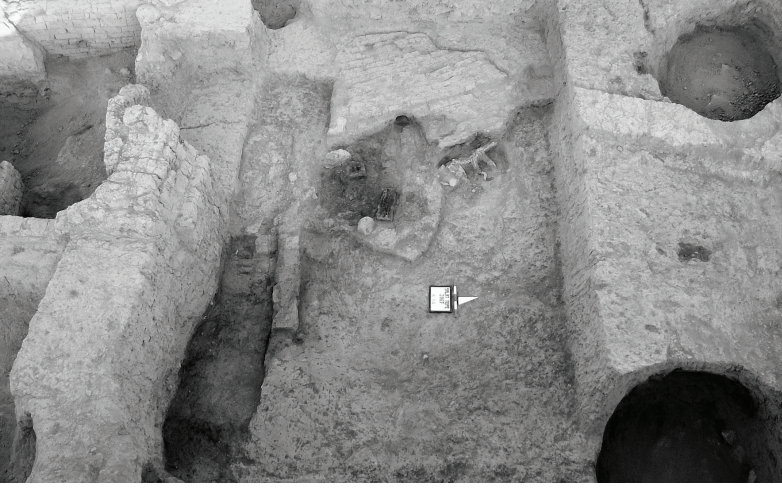
Fig. 4 Salat Tepe IIC, Tabaka 2, OTÇ III Duvarı yıkıntısı üzerine açılan çukura yerleştirilmiş kuzu/oğlak iskeleti / Skeleton of a lamb placed in a pit dug into the debris of a MBA III Wall at Salat Tepe IIC, Level 2.