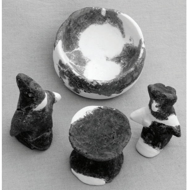
Fig. 9 Salat Tepe IIB, Tabaka 4, OTÇ I yapısı temeline yerleştirilmiş pişmiş toprak figürin grubu / Terracotta figurine group placed into the foundations of a MBA I Building at Salat Tepe IIB, Level 4.