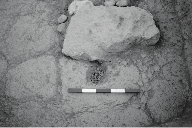
Fig. 5 Salat Tepe IIB, Tabaka 4, OTÇ I Duvarı altına açılan çukura yerleştirilmiş domuz yavrusu / A piglet placed under the foundations of a MBA I Building at Salat Tepe IIB, Level 4 (Salat Tepe Kazı Arşivi).