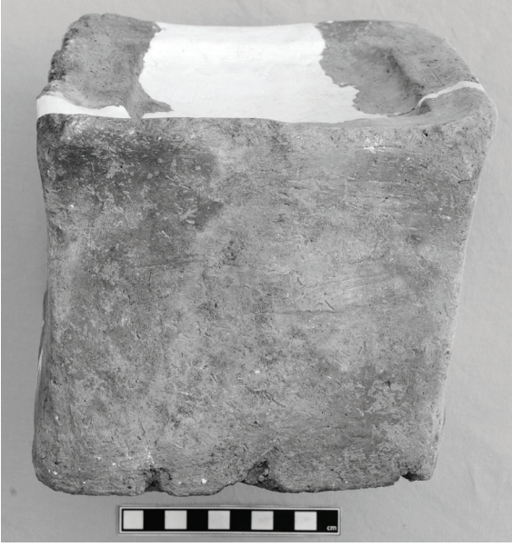
Fig. 8 Salat Tepe IIB, Tabaka 4, OTÇ I yapısı yıkıntıları arasında ele geçen küp biçimli sunak / A cubic altar found among the debris of a MBA I Building at Salat Tepe IIB, Level 4.