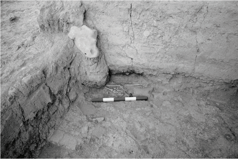
Fig. 7 Salat Tepe IIB, Tabaka 4, OTÇ I yapısı temelinde yerleştirilmiş geyik bacakları ile yapı yıkıntısı üzerine boğa başı biçimli bir taş / Deer legs placed into the foundations, and a bull-head shaped stone placed on the debris of a MBA I Building at Salat Tepe IIB, Level 4.