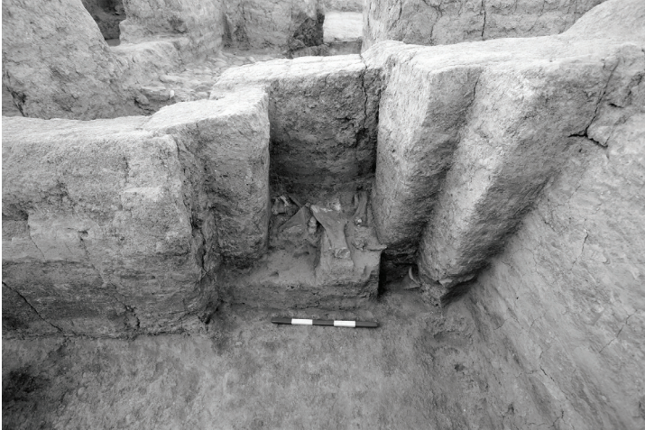
Fig. 12 Salat Tepe IIA, Tabaka 6, ETÇ IVA yapısında bir nişe yerleştirilen sığır kemikleri / Big ruminant bones placed in a niche at an EBA IVA Building at Salat Tepe IIA, Level 6 (Salat Tepe Kazı Arşivi).