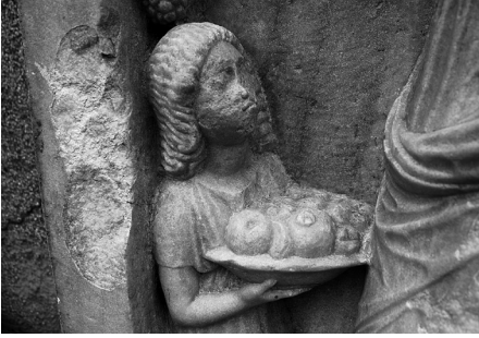
Fig. 6 Larissa steli, hizmetçi kız figürü, detay.