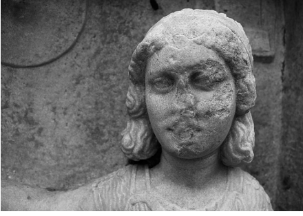
Fig. 4 Larissa steli, genç kız figürünün baş kısmı, detay.