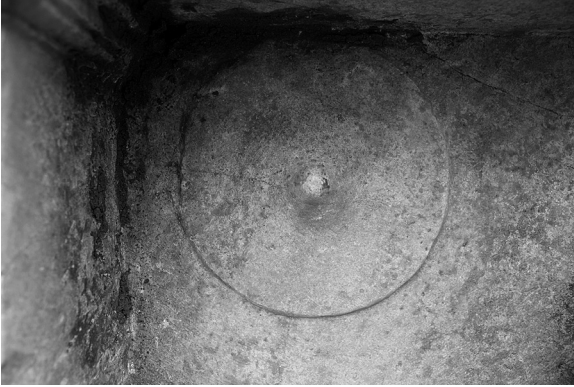
Fig. 12 Larissa steli, şapka, detay.