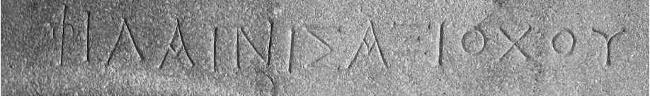
Fig. 11 Kyme steli, yazıt, detay.