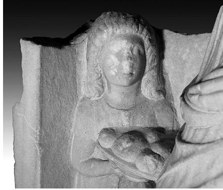
Fig. 7 Larissa steli, hizmetçi kız figürü, detay.