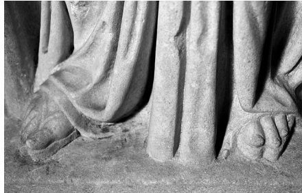
Fig. 9 Kyme steli, genç kız figürü, detay.