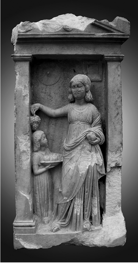
Fig. 1 Larissa steli, genel görünüm.