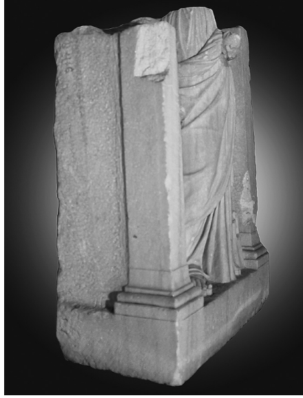
Fig. 5 Kyme steli, yandan genel görünüm.