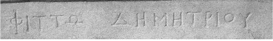
Fig. 10 Larissa steli, yazıt, detay.