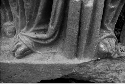
Fig. 8 Larissa steli, genç kız figürü, detay.