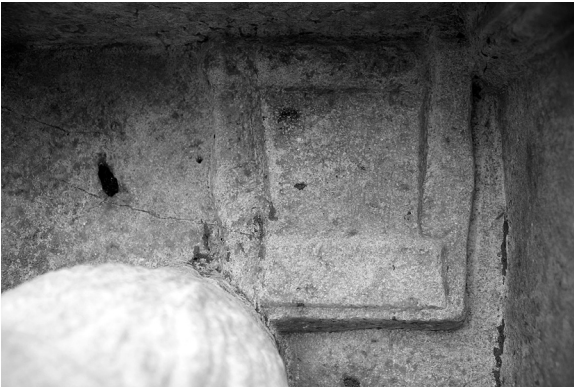
Fig. 13 Larissa steli, kithara, detay.