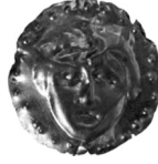
Fig. 5 Apollon betimli Impression (sikke-aplik).