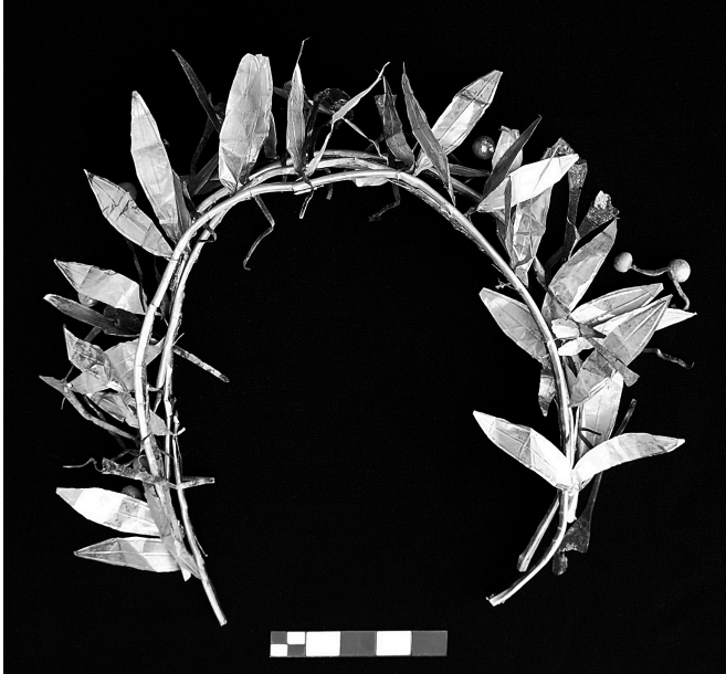
Fig. 9 TSM2'den ele geçen altın taçlar (üç adet).