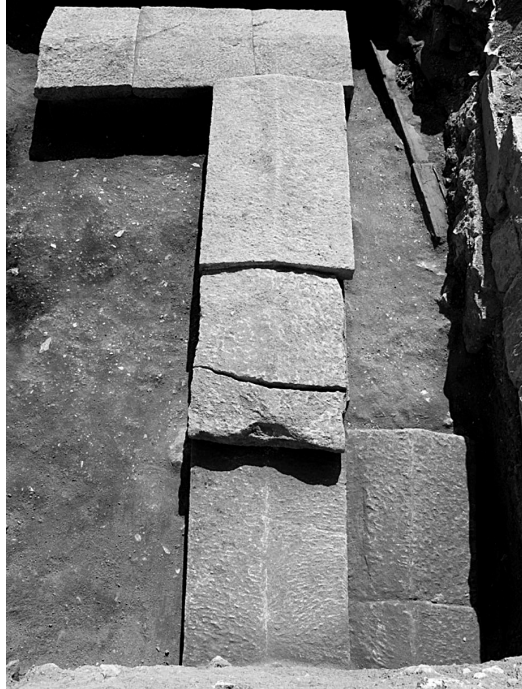
Fig. 2 Parion Güney Nekropolü TSM1, TSM2 ve TSM3.