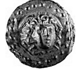
Fig. 7 Kütahya'da ele geçen aplik.