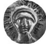
Fig. 6 Persephone betimli Madalyon (Brechteate).