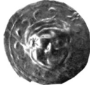
Fig. 4 Gorgo medusa betimli Impression (sikke-Aplik).