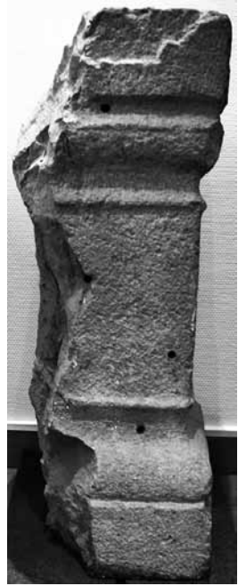
Fig. 21 a-b