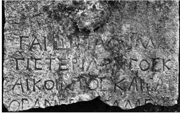
Fig. 17 a-b