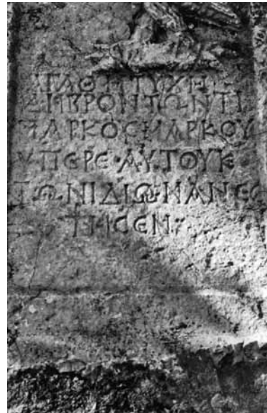
Fig. 3 a-b