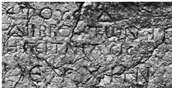
Fig. 19 a-b