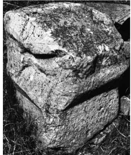
Fig. 5 a-b