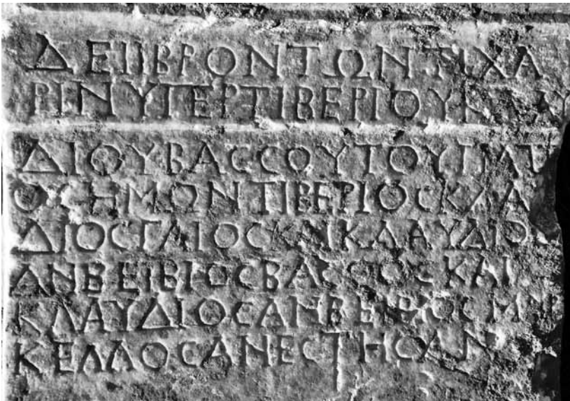
Fig. 16 a-b