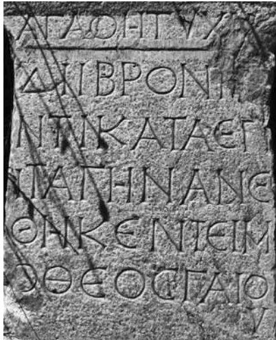
Fig. 15 a-b