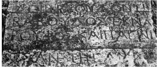
Fig. 10 a-b