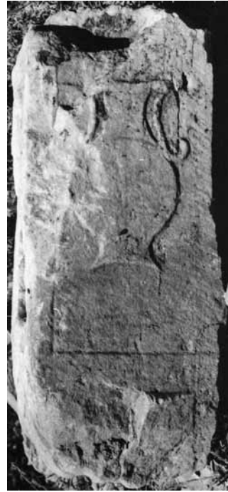
Fig. 2 a-b