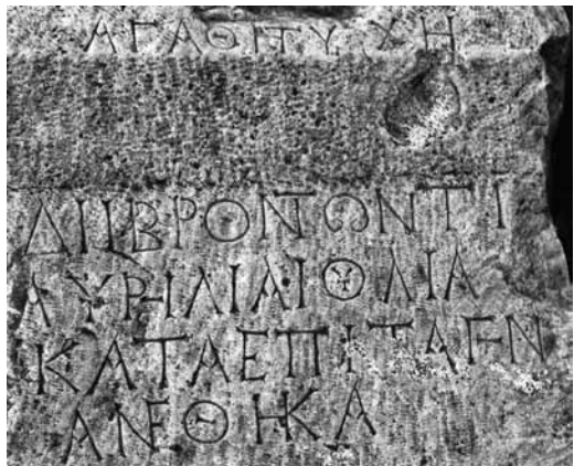
Fig. 12 a-b