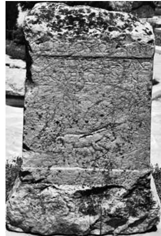
Fig. 18 a-b