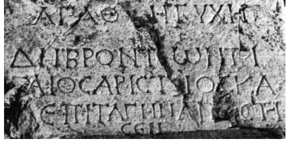
Fig. 4 a-b