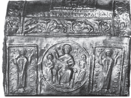
Fig. 4 Adana Müzesi 4 Numaralı Röliker Ön Yüzü