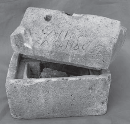
Fig. 9 Silifke Müzesi 3 ve 4 Numaralı Röliker