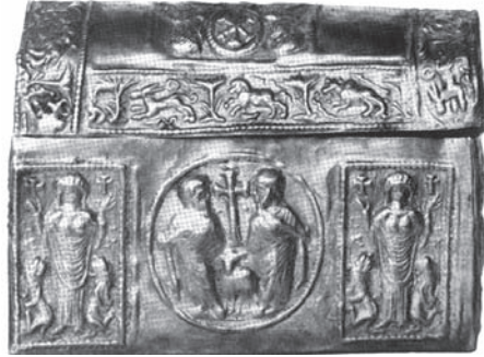
Fig. 5 Adana Müzesi 4 Numaralı Röliker Arka Yüzü