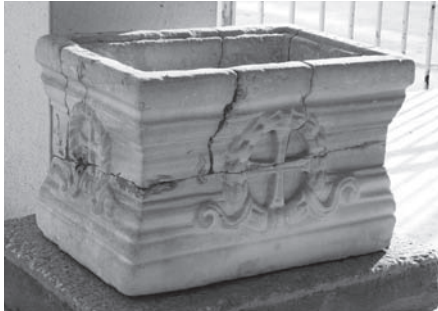
Fig. 3 Adana Müzesi 3 Numaralı Röliker