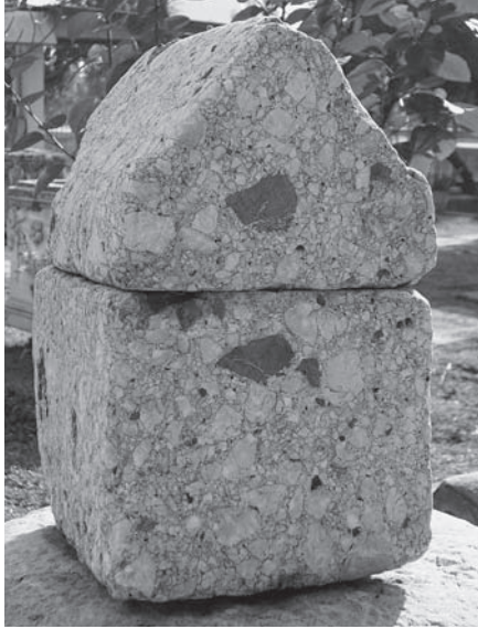
Fig. 1 Adana Müzesi 1 Numaralı Röliker