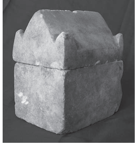
Fig. 10 Tarsus Müzesi'ndeki Röliker