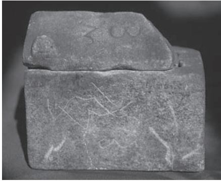
Fig. 2 Adana Müzesi 2 Numaralı Röliker