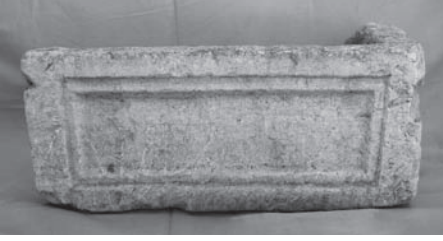
Fig. 7 Silifke Müzesi 1 Numaralı Röliker Gövdesi