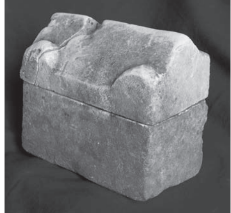
Fig. 11 Taşucu Amfora Müzesi'ndeki Röliker