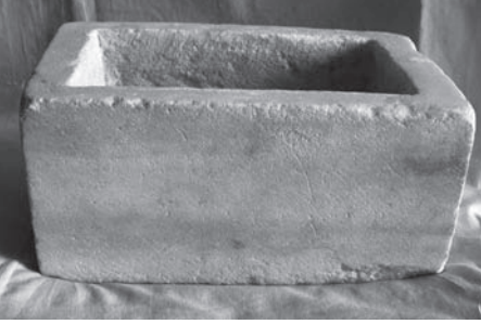
Fig. 8 Silifke Müzesi 2 Numaralı Röliker