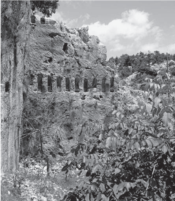
Fig. 6 Diokaisareia, Friedhofskirche, Westteile nach Norden