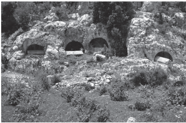
Fig. 2 Diokaisareia, Arkosolgräber in der Nordnekropole