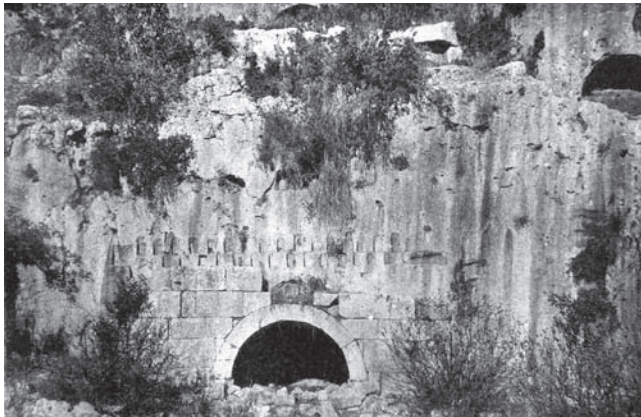
Fig. 3 Diokaisareia, Friedhofskirche, alte Fotografie, nach Westen (nach Keil - Wilhelm)