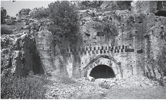
Fig. 5 Diokaisareia, Friedhofskirche, nach Westen