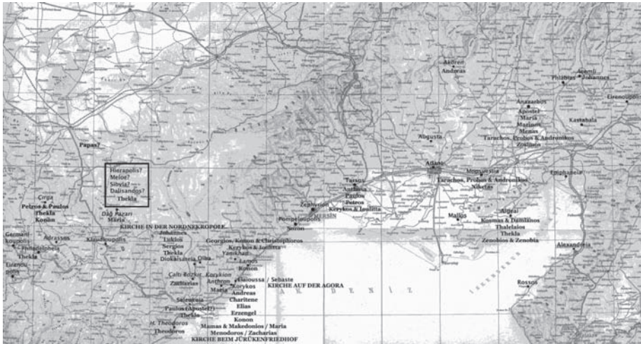
Fig. 1 Mittleres und östliches Kilikien, in frühbyzantinischer Zeit bezeugte Heilige (auf Grundlage der Karte Hild - Hellenkemper 1990, Beilage)