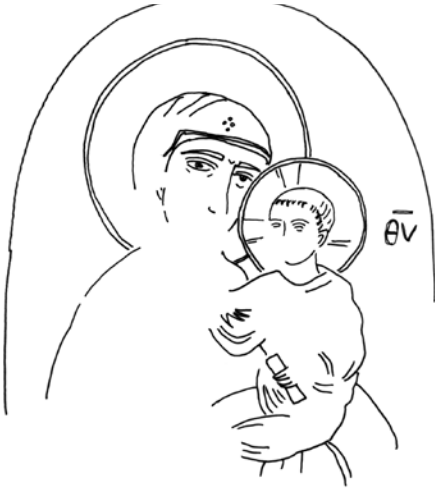
Fig. 3 Theotokos Hodegetria