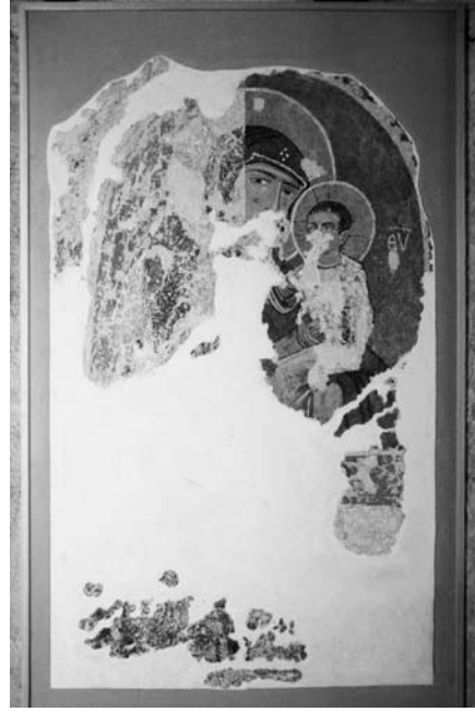
Fig. 2 Theotokos Hodegetria, Restorasyon sonrası.